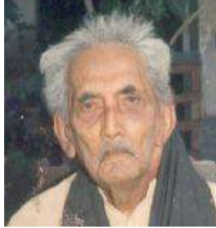
प्रोफेसर नीलरत्न धर