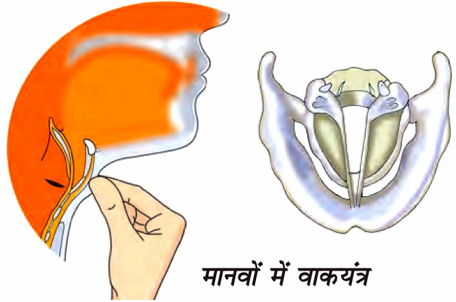
मानवों में वाक्यंत्र

उत्तर- वह ध्वनि जिसे हम सुनना पसंद नहीं करते शोर कहलाती है। उदाहरण के लिए फैक्ट्री से निकलने वाली ध्वनि शोर होती है। कभी-कभी संगीत भी शोर बन जाता है अगर हमें वह पसंद नहीं है और हम उसे सुनना नहीं चाहते। ज्यादा देर तक कोई भी आवाज सुनने से हमारे सिर में दर्द होने लगता है। इसे हम शोर प्रदूषण कहते हैं।