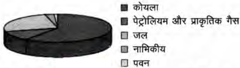
चित्र—भारत में हमारी ऊर्जा की आवश्यकताओं के लिए ऊर्जा के प्रमुख स्रोतों को दर्शाने वाला वृत्तरेखा