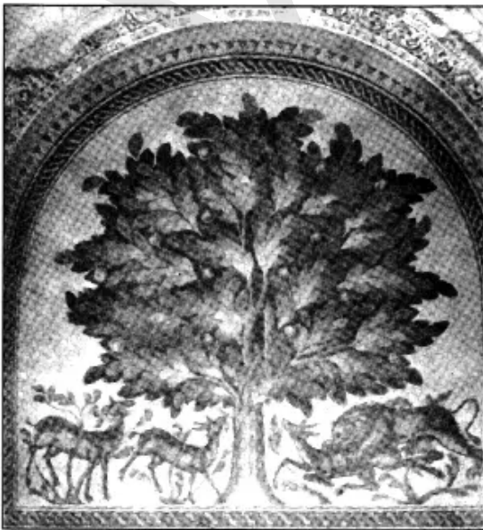
चित्र 4.1: खिरबत-अल-मफ़ज़र महल के स्नानगृह का फ़र्श

इमारत मुख्य रूप से मीनार से जुड़ी होती है। इस मीनार का प्रयोग नियत समयों पर प्रार्थना हेतु बुलाने के लिए किया जाता है। मीनार नए धर्म के अस्तित्व का प्रतीक था। शहरी और ग्रामीण स्थलों में समय का अनुमान पाँच दैनिक प्रार्थनाओं व साप्ताहिक प्रवचनों की मदद से लगाते थे।