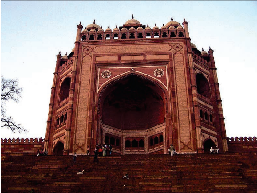
6.7 બુલંદ દરવાજો

ઉત્તર પ્રદેશના આગ્રાથી 26 માઈલ દૂર ફતેહપુર સિકરી આવેલું છે. અકબરે સૂફી સંત સલીમ ચિસ્તીની યાદમાં આ શહેર વસાવ્યું હતું અને તેને પોતાની રાજધાની બનાવી હતી. સીકરીમાં ઈમારતોનું બાંધકામ કાર્ય ઈ.સ. 1569માં શરૂ થયું અને ઈ.સ. 1572 સુધીમાં અહીં ઘણી ઈમારતો બંધાઈ. આ ઈમારતોમાં બીરબલનો મહેલ, બીબી મરિયમનો સુનહલા મહેલ, તુર્કી સુલતાનનો મહેલ, જામે મસ્જિદ અને તેનો બુલંદ દરવાજો શ્રેષ્ઠ છે.