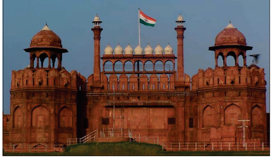
6.6 લાલ કિલ્લો

દિલ્હી સ્થિત લાલ કિલ્લાનું નિર્માણ શાહજહાંએ ઈ.સ. 1638માં કરાવ્યું હતું. લાલ પથ્થરોમાંથી તૈયાર થયેલ આ કિલ્લામાં શાહજહાંએ પોતાના નામથી શાહજહાંનાબાદ વસાવ્યું હતું. આ કિલ્લાની અંદર દીવાન-એ-આમ, દીવાન-એ-ખાસ, રંગમહેલ જેવી મનોહર ઈમારતો બંધાવી હતી. દીવાન-એ-ખાસ અન્ય ઈમારતોની તુલનામાં વધુ અલંકૃત છે. તેની સજાવટમાં સોનું, ચાંદી, કિમતી પથ્થરોનો અદ્ભુત સમન્વય થયો છે.