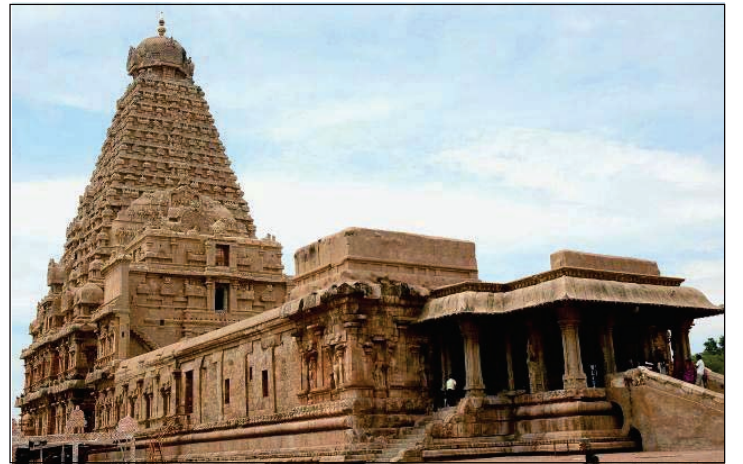
6.3 બૃહદેશ્વર મંદિર

આ મંદિર ચોલ વંશના રાજા રાજરાજ પ્રથમે બંધાવ્યું હોવાથી તેને રાજ રાજેશ્વર મંદિર પણ કહે છે. આ મંદિર 500 ફૂટ લંબાઈ અને 250 ફૂટ પહોળાઈ ધરાવતા કોટવાળા યોગાનમાં બનાવેલું છે. આ મંદિરનું શિખર જમીનથી લગભગ 200 ફૂટ ઊંચું