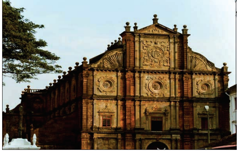
6.8 બેસાલીકા ઓફ બોમ જીસસ દેવળ-ગોવા

પોર્ટુગીઝો સાથે ખ્રિસ્તી ધર્મના ધર્મગુરુઓ પણ ભારતમાં આવ્યા. ગોવા પોર્ટુગીઝોની રાજધાની હતી. અહીં બેસાલીકા ઓફ બોમ જીસસ કે બેસાલીકા ઓફ ગુડ જીસસ દેવળ જૂના ગોવામાં આવેલું છે. અહીં સેન્ટ ફ્રાન્સીસ ઝેવિયર્સનો પાર્થિવ દેહ સાચવીને મુકાયો છે. ઘણાં વર્ષો પછી પણ તેમનું પાર્થિવ શરીર વિકૃત થયું નથી. આ ઉપરાંત ગોવામાં અનેક ચર્ચ (દેવળ) આવેલાં છે. તેમ જ ગોવા તેના રમણીય દરિયાકિનારા માટે પણ જાણીતું છે.