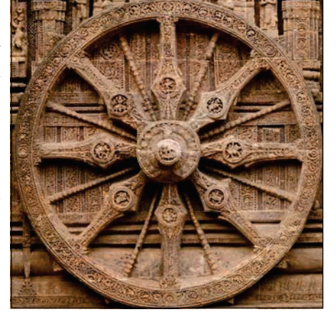
6.2 કોણાર્કના સૂર્ય મંદિરનું રથ ચક્ર

ઓડિશા રાજ્યના પુરી જિલ્લામાં બંગાળના અખાત પાસે કોણાર્કનું સૂર્ય મંદિર આવેલું છે. આ મંદિરનું નિર્માણ 13મી સદીમાં ગંગવંશના રાજા નરસિંહવર્મન પ્રથમના સમયમાં થયું. આ રથ મંદિર સાત અશ્વો વડે ખેંચાતા સૂર્યના રથનું સ્વરૂપ પામ્યું છે. એને 12 વિશાળ પૈડાં છે. મંદિરના આધારને સુંદરતા પ્રદાન કરતાં આ પૈડાં વર્ષના બાર મહિનાને પ્રતિબિંબિત કરે છે. જ્યારે પ્રત્યેક ચક્રમાં આઠ આરા છે જે દિવસના આઠ પ્રહરને દર્શાવે છે. રૂપાંકનોની વિગત અને વિષય વૈવિધ્યની બાબતમાં આ મંદિર અદ્વિતીય છે. આ મંદિરનું