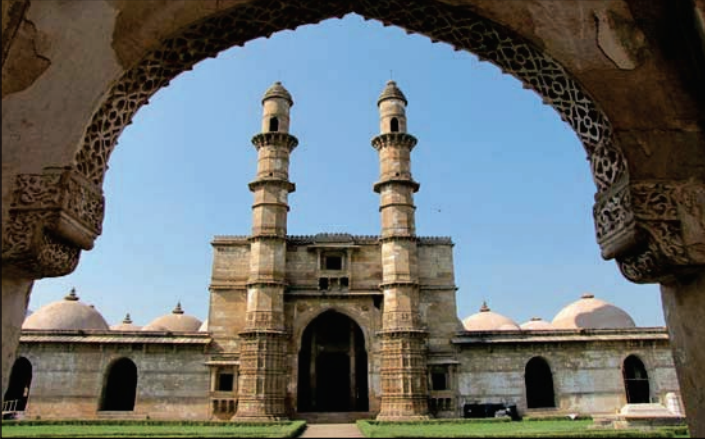
6.9 જામી મસ્જિદ - ચાંપાનેર