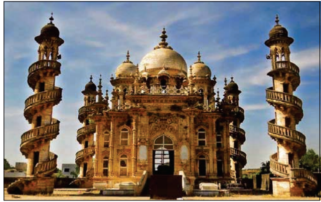
6.10 બહાઉદ્દીન વજીરનો મકબરો

જૂનાગઢમાં અશોકનો શિલાલેખ, ખાપરા કોડિયાની બૌદ્ધ ગુફાઓ ઉપરકોટ, જૈન મંદિરો, દામોદર કુંડ, અડીકડીની વાવ, જૂનો રાજમહેલ, નવઘણ કૂવો, મહાબતખાનનો મકબરો, બહાઉદ્દીન વજીરનો મકબરો વગેરે જોવાલાયક સ્થળો છે. મહાશિવરાત્રિએ ગિરનાર તળેટીમાં ભવનાથનો મોટો મેળો ભરાય છે.