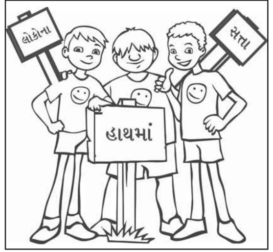
પંચાયતી રાજનું ત્રિસ્તરીય માળખું

પંચાયતી રાજ એક સરકારી પદ્ધતિ છે. આ પદ્ધતિમાં ગ્રામ પંચાયતો વહીવટનું મૂળભૂત એકમ છે. રાજ્ય સરકારો દ્વારા પંચાયતી રાજની પદ્ધતિ 1950થી 1960ના દાયકામાં અપનાવવામાં આવી હતી. 24 એપ્રિલ, 1993ના રોજ ભારતમાં પંચાયતી રાજ માટે બંધારણીય (73મો સુધારો) એક્ટ બંધારણીય દરજ્જો પૂરો પાડે છે. બળવંતરાય મહેતા સમિતિએ ત્રિસ્તરીય (ગ્રામ, તાલુકા અને જિલ્લા) પંચાયતી રાજની સ્થાપના કરવાનું જણાવ્યું હતું. ભારતની દરેક રાજ્ય સરકારોએ પોતાને અનુકૂળ હોય તે રીતે લોકશાહી વિકેન્દ્રીકરણનું સ્વરૂપ વિકસિત કર્યું છે.