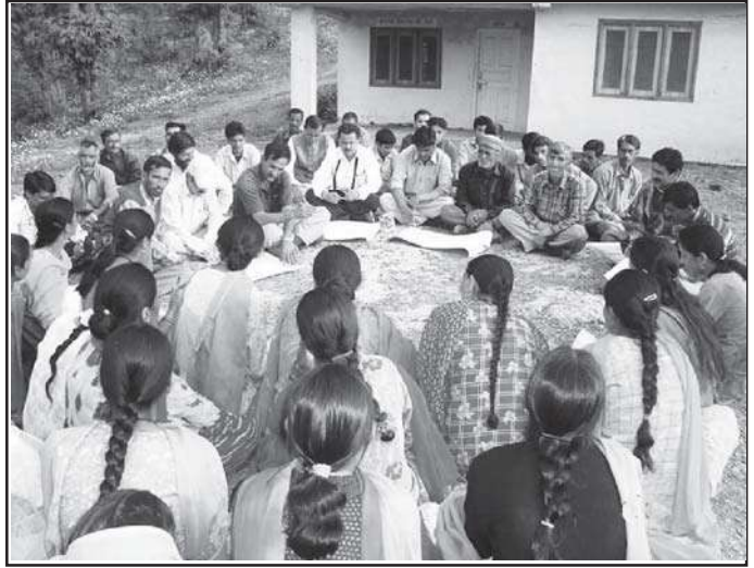
ગ્રામ પંચાયત સભા

એસ. કે. ડે – “પંચાયતી રાજ એ પ્રજાની ઉન્નતિ માટેનો રસ્તો છે. પંચાયતી રાજનો સાચો અર્થ તો એ છે કે લોકો સંગઠિત, જાગૃત અને સ્વાવલંબી બને અને સરકાર પાસે જે અધિકારો છે તે લઈને પોતે બજાવે.”