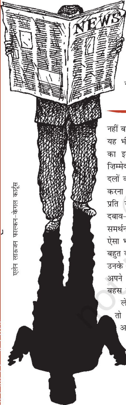
एलेन लाऊजन फाल्कन-केगल कार्टून

ऊपर के अनुच्छेद में आपको लोकतंत्र और सामाजिक आंदोलन में क्या संबंध नजर आ रहा है? इस आंदोलन को सरकार के प्रति क्या रवैया अपनाना चाहिए?