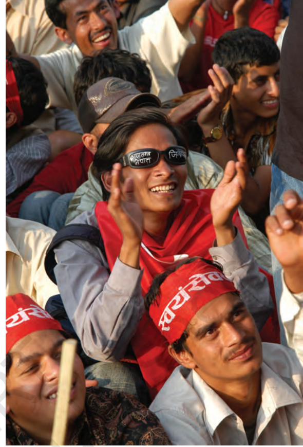
नेपाल के लोग और राजनीतिक दल एक 'रैली' में लोकतंत्र की बहालों की माँग करते हुए।

इसमें माओवादी बागी तथा अन्य संगठन भी साथ हो लिए। लोग कम्प्यू तोड़कर सड़कों पर उतर आए। तकरीबन एक लाख लोग रोजाना एकजुट होकर लोकतंत्र की बहाली की माँग कर रहे थे और लोगों की इतनी बड़ी तादाद के आगे सुरक्षा-बलों की एक न चल सकी। 21 अप्रैल के दिन आंदोलनकारियों की संख्या 3-5 लाख तक पहुँच गई और आंदोलनकारियों ने राजा को 'अल्टीमेटम' दे दिया। राजा ने आधे-अधूरे मन से कुछ रियायत देने की घोषणा की जिसे आंदोलन के नेताओं ने स्वीकार नहीं किया। नेता अपनी माँगों पर अडिग रहे कि संसद को बहाल किया जाय; सर्वदलीय सरकार बने तथा एक नयी संविधान-सभा का गठन हो।