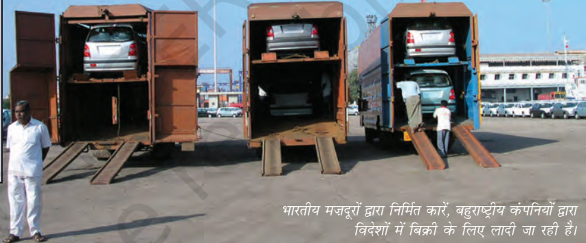
भारतीय मजदूरों द्वारा निर्मित कारें, बहुराष्ट्रीय कंपनियों द्वारा विदेशों में बिक्री के लिए लादी जा रही हैं।