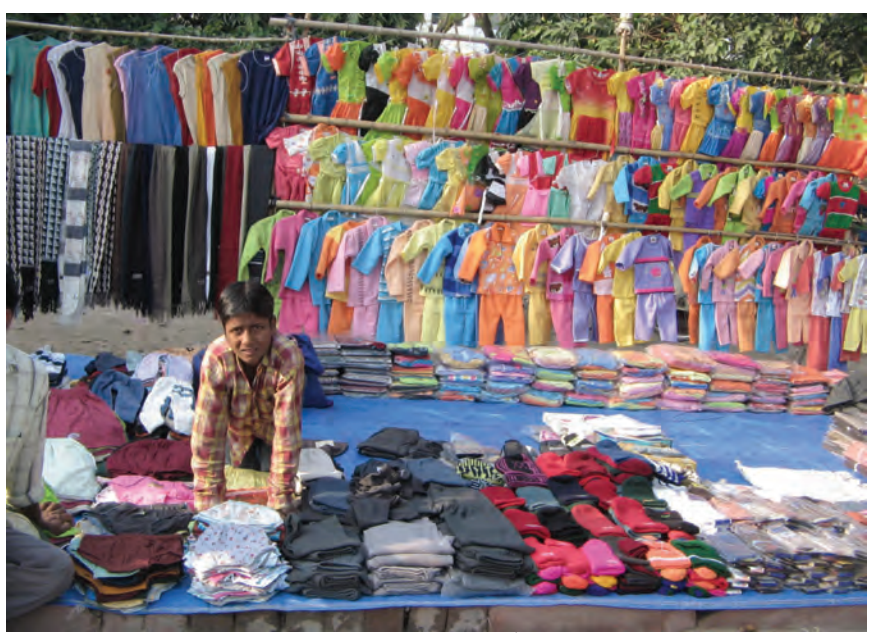
सिलेसिलाए वस्त्रों के छोटे व्यापारी बहुराष्ट्रीय कंपनियों के ब्रांड और आयात दोनों से कड़ी प्रतिस्पर्धा का सामना करते हुए।

सामान्यतः व्यापार के खुलने से वस्तुओं का एक बाज़ार से दूसरे बाज़ार में आवागमन होता है। बाज़ार में वस्तुओं के विकल्प बढ़ जाते हैं। दो बाज़ारों में एक ही वस्तु का मूल्य एक समान होने लगता है। अब दो देशों के उत्पादक एक दूसरे से हजारों मील दूर होकर भी एक दूसरे से प्रतिस्पर्धा कर सकते हैं। इस प्रकार, विदेश व्यापार विभिन्न देशों के बाज़ारों को जोड़ने या एकीकरण में सहायक होता है।