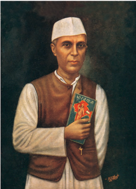
चित्र 13 - जवाहरलाल नेहरू, एक लोकप्रिय चित्र।

इस चित्र में नेहरू भारत माता और भारत के नक्शे को हृदय के पास रखे दिखाई दे रहे हैं। बहुत सारे चित्रों में राष्ट्रवादी नेताओं को अपना सिर भारत माता के चरणों में चढ़ाते हुए दर्शाया गया है। माँ के लिए बलिदान का विचार लोगों की कल्पना में बहुत महत्वपूर्ण था।