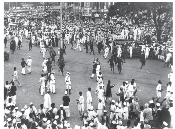
चित्र 8 - सत्याग्रहियों पर हमला करती पुलिस, 1930

महात्मा गांधी ने एक बार फिर आंदोलन वापस ले लिया। 5 मार्च 1931 को उन्होंने इरविन के साथ एक समझौते पर दस्तख़त कर दिए। इस गांधी-इरविन समझौते के ज़रिए गांधीजी ने लंदन में होने वाले दूसरे गोलमेज़ सम्मेलन में हिस्सा लेने पर अपनी सहमति व्यक्त कर दी (पहले