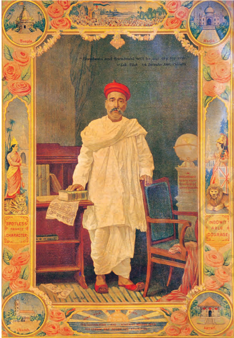
चित्र 11 - बालगंगाधर तिलक, बीसवीं सदी के शुरू की तसवीर।

ध्यान से देखें कि तिलक एकता के प्रतीकों से घिरे हुए हैं। चित्र के चारों ओर विभिन्न धर्मों के पवित्र स्थान (मंदिर, चर्च, मस्जिद) चित्रित किए गए हैं।