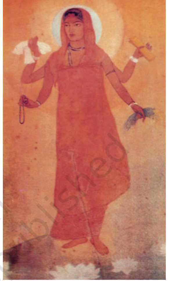
चित्र 12 - भारत माता, अबनीन्द्रनाथ टैगोर, 1905 ध्यान से देखें कि यहाँ दर्शाई गई माँ की छवि शिक्षा, भोजन और कपड़े दे रही है। एक हाथ में माला उसके संन्यासी गुण को रेखांकित करती है। अपने पूर्ववर्ती रवि वर्मा की भाँति अबनीन्द्रनाथ टैगोर ने भी ऐसी चित्र शैली विकसित करने का प्रयास किया जिसे सच्चे अर्थों में भारतीय माना जा सके।

राष्ट्रवाद का विचार भारतीय लोक कथाओं को पुनर्जीवित करने के आंदोलन से भी मजबूत हुआ। उन्नीसवीं सदी के आखिर में राष्ट्रवादियों ने भाटों व चारणों द्वारा गाई-सुनाई जाने वाली लोक कथाओं को दर्ज करना शुरू कर दिया। वे लोक गीतों व जनश्रुतियों को इकट्ठा करने के लिए गाँव-गाँव घूमने लगे। उनका मानना था कि यही कहानियाँ हमारी उस परंपरागत संस्कृति की सही तसवीर पेश करती हैं जो बाहरी ताकतों के प्रभाव से भ्रष्ट और दूषित हो चुकी है। अपनी राष्ट्रीय पहचान को ढूँढ़ने और अपने अतीत में गौरव का भाव पैदा करने के लिए इस लोक परंपरा को बचाकर रखना जरूरी था। बंगाल में खुद रबीन्द्रनाथ टैगोर भी लोक-गाथा गीत, बाल गीत और मिथकों