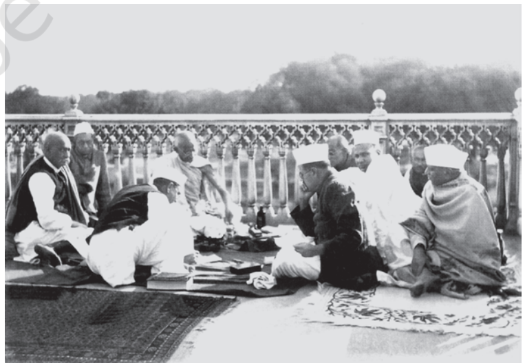
चित्र 6 - इलाहाबाद में कांग्रेस के नेताओं की बैठक, 1931

साइमन कमीशन के खिलाफ़ शांतिपूर्ण प्रदर्शन के दौरान ब्रिटिश पुलिस ने लाला लाजपत राय पर हमला किया। प्रदर्शन के दौरान मिले गहरे जख्मों के कारण उन्होंने दम तोड़ दिया।