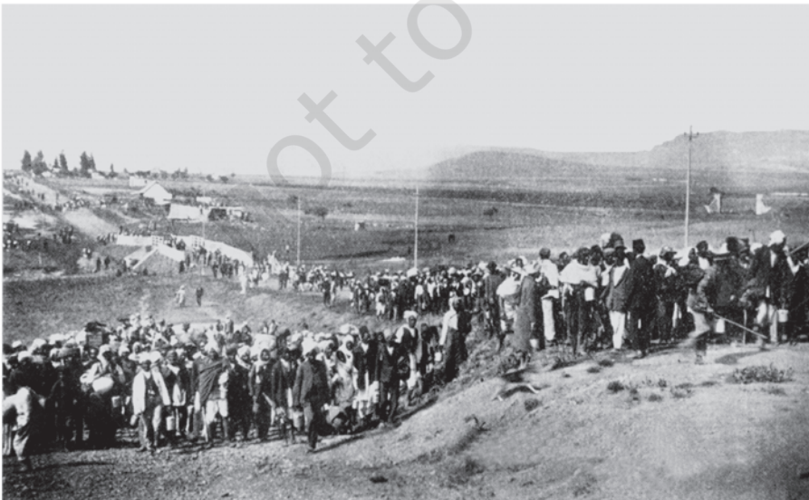
चित्र 2 - दक्षिण अफ्रीका में भारतीय मज़दूर फोकस्वस्ट से गुज़र रहे हैं, 6 नवंबर 1913

महात्मा गांधी जनवरी 1915 में भारत लौटे। इससे पहले वे दक्षिण अफ्रीका में थे। उन्होंने एक नए तरह के जनांदोलन के रास्ते पर चलते हुए वहाँ की