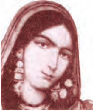
बेगम हज़रत महल

गया। कई महीनों तक उत्तरी और मध्य भारत के विस्तृत भूभाग पर विद्रोहियों का कब्ज़ा रहा।