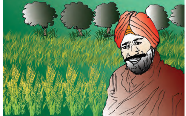
चित्र 4.3 : पंजाब का एक किसान एच.वाई.वी. प्रकारों वाले गेहूँ के एक खेत के सामने, जिस पर हरित क्रांति आधारित है

तत्कालीन प्रधानमंत्री इंदिरा गांधी ने जुलाई, 1968 में 'गेहूँ क्रांति' शीर्षक से एक विशेष डाक टिकट जारी कर कृषि के क्षेत्रक में हरित क्रांति की प्रभावशाली प्रगति को आधिकारिक रूप से दर्ज किया। गेहूँ की सफलता के बाद चावल के क्षेत्र में इस सफलता की पुनरावृत्ति हुई। बहरहाल, अनाज की उपज में वृद्धि समानुपातिक नहीं थी। उत्तर प्रदेश और मध्य प्रदेश में