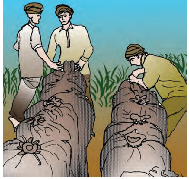
चित्र 4.5 : भंडारों में खाद्यान्न ले जाते हुए किसान

एन.एस.एस.ओ. न. 558 की रिपोर्ट के अनुसार ग्रामीण भारत में प्रति व्यक्ति चावल की खपत 6.38 किग्रा. वर्ष 2004-05 से घटकर 5.98 किग्रा. वर्ष 2011-12 में हो गया।