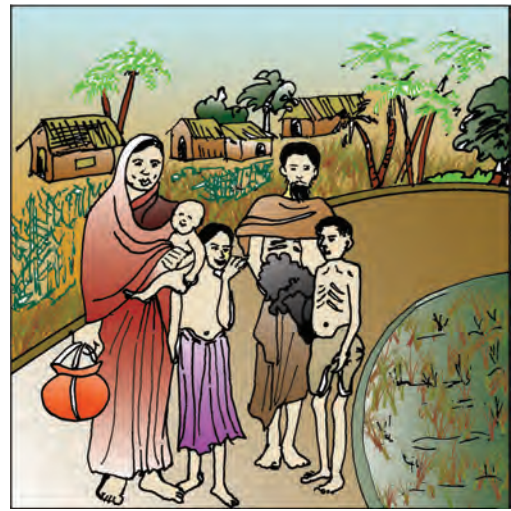
चित्र 4.2 : 1943 के बंगाल के अकाल के दौरान पूर्वी बंगाल के चटगाँव जिले में गाँव छोड़ कर जाता हुआ एक परिवार।