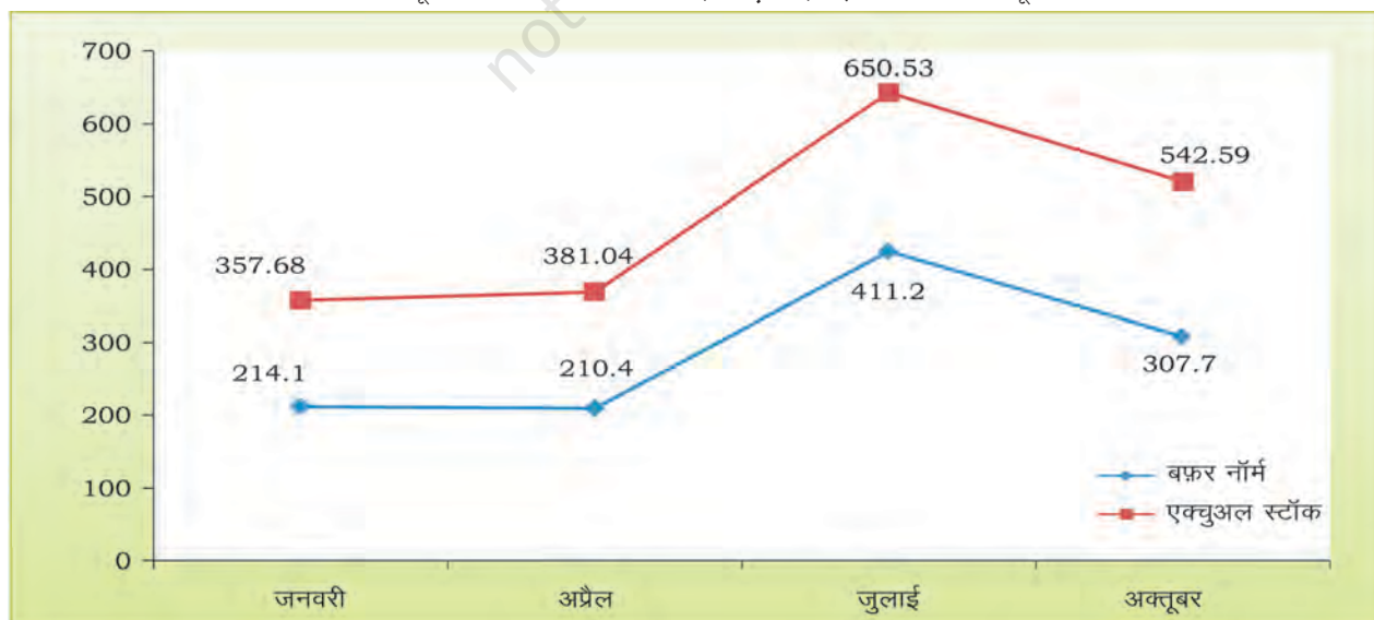
आरेख 4.2 : न्यूनतम बफ़र स्टॉक का स्तर (करोड़ टन) एवं चावल और गेहूँ के मानक

स्रोत : भारतीय खाद्य निगम, 2018; बफ़र स्टॉक का स्तर 1 जुलाई 2017 से माननीय है