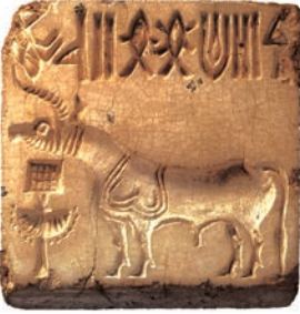
एक हड़प्पाई मुहर

भारत के अतीत की सबसे पहली तसवीर उस सिंधु घाटी सभ्यता में मिलती है, जिसके अवशेष सिंध में मोहनजोदड़ो और पश्चिमी पंजाब में हड़प्पा में मिले हैं। इन खुदाइयों ने प्राचीन इतिहास की समझ में क्रांति ला दी है।