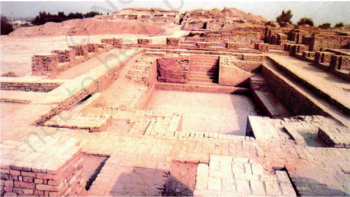
मोहनजोदड़ो का महान स्नानागार

सिंधु घाटी सभ्यता और वर्तमान भारत के बीच समय के ऐसे कई दौर गुज़रे हैं जिनके बारे में हम बहुत कम जानते हैं। वैसे भी इस बीच असंख्य परिवर्तन हुए हैं। लेकिन भीतर ही भीतर निरंतरता की ऐसी शृंखला चली आ रही है जो आधुनिक भारत को छः-सात हज़ार पुराने उस बीते हुए युग से जोड़ती है जब संभवतः सिंधु घाटी सभ्यता की शुरुआत हुई थी। यह देखकर अचरज होता है कि मोहनजोदड़ो और हड़प्पा में कितना कुछ ऐसा है जो हमें