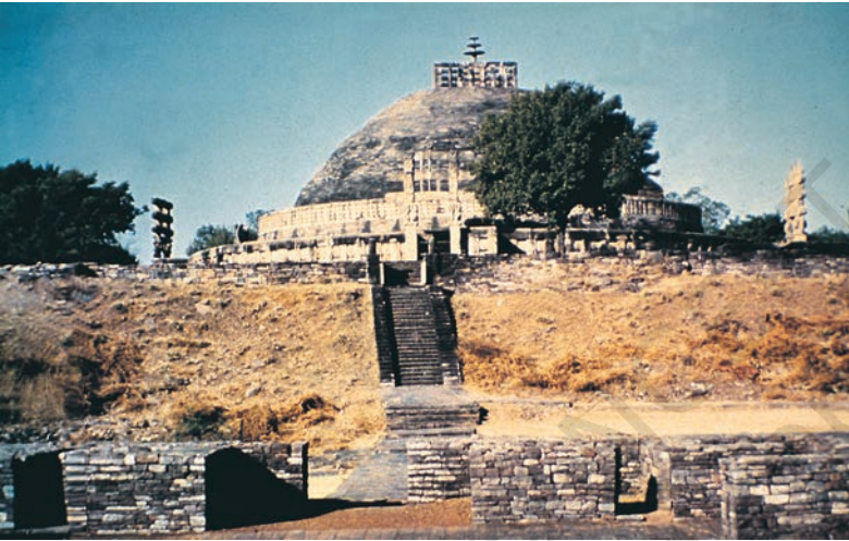
अशोक के समय में निर्मित साँची का स्तूप

इस अद्भुत शासक ने, जिसे आज भी भारत और एशिया के बहुत से दूसरे भागों में प्यार से याद किया जाता है, अपने आपको बुद्ध की शिक्षा के प्रचार में, नेकी और सद्भाव के काम में तथा प्रजा के हित के लिए सार्वजनिक कार्यों के प्रति समर्पित कर दिया। उसने ऐलान कर दिया था कि वह इनके लिए हमेशा तैयार है। हर स्थान पर और हर समय, सरकारी कर्मचारी जनता के कार्यों के बारे में उसे बराबर सूचना देते रहें, चाहे जिस समय और जहाँ भी हो वह लोक-हित के लिए अवश्य काम करेगा।