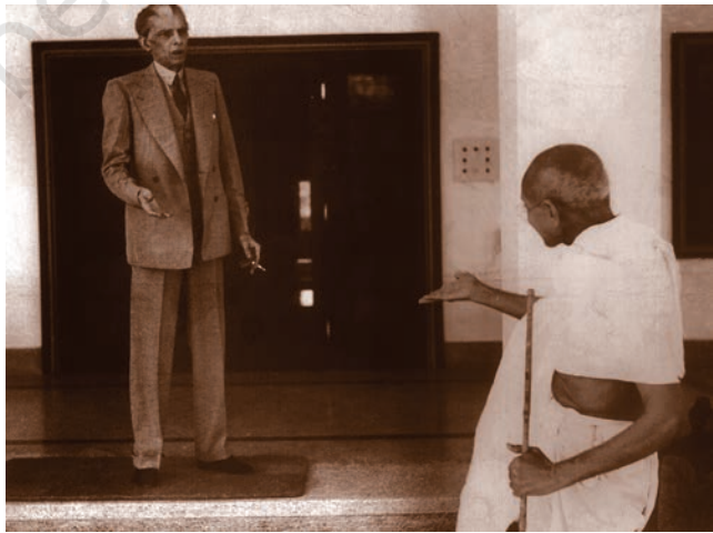
जिन्ना और गांधी

जिसे सांप्रदायिक समस्या कहा जाता था, वह अल्पसंख्यकों के अधिकारों के साथ इस तरह तालमेल बैठाना था ताकि उन्हें बहुसंख्यकों के खिलाफ़ पर्याप्त संरक्षण मिल सके। भारत के अल्पसंख्यक यूरोप की तरह जातीय या राष्ट्रीय अल्पसंख्यक नहीं, वे धार्मिक अल्पसंख्यक हैं। जातीय दृष्टि से भारत में एक विचित्र मिश्रण है, पर जातीय सवाल भारत में न कभी उठे हैं न उठ सकते हैं। धर्म इन जातीय विभिन्नताओं के ऊपर है। जातियाँ या तो एक दूसरे में मिल जाती हैं या उनमें अंतर करना कठिन होता है। ज़ाहिर है कि धार्मिक दीवारें स्थायी नहीं होतीं और जो व्यक्ति अपना धर्म बदलता है उसकी जातीय पृष्ठभूमि या उसकी जातीय और भाषिक विरासत नष्ट नहीं हो जाती। परंतु राजनीतिक मामलों में, धर्म का स्थान सांप्रदायिकता ने ले लिया है। यह एक संकीर्ण समुदाय