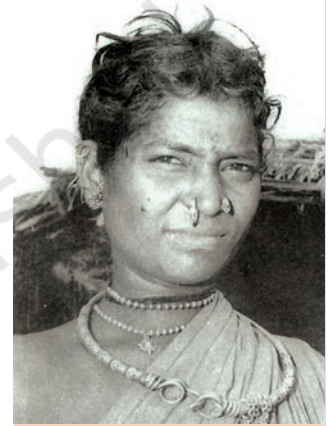
चित्र 5 गोंड महिला

इन राज्यों की प्रशासनिक व्यवस्था केंद्रीकृत हो रही थी। राज्य, गढ़ों में विभाजित थे। हर गढ़ किसी खास गोंड कुल के नियंत्रण में था। ये पुनः चौरासी गाँवों की इकाइयों में विभाजित होते थे, जिन्हें चौरासी कहा