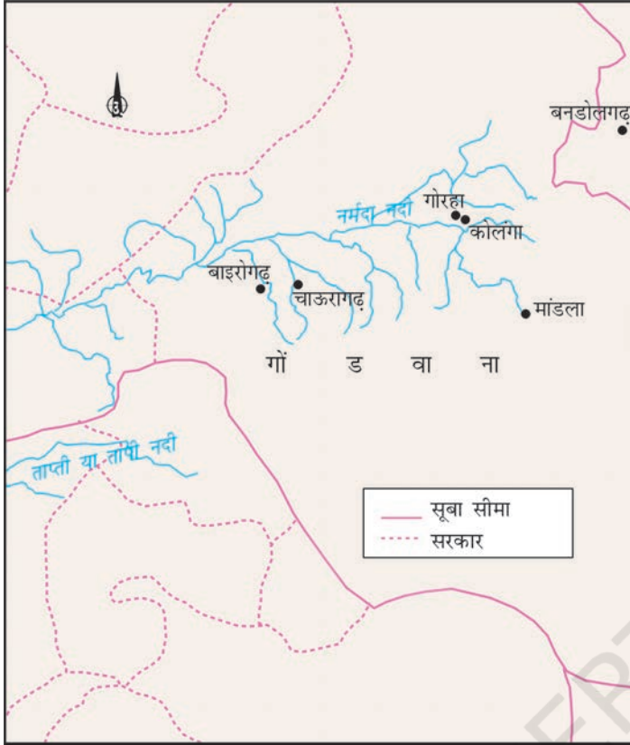
मानचित्र 2 गोंडवाना

दलपत की मृत्यु कम उम्र में ही हो गई। रानी दुर्गावती बहुत योग्य थी और उसने अपने पाँच साल के पुत्र बीर नारायण के नाम पर शासन की कमान संभाली। उसके समय में राज्य का और अधिक विस्तार हुआ। 1565 में आसिफ़ खान के नेतृत्व में मुगल सेनाओं ने गढ़ कटंगा पर हमला किया। रानी दुर्गावती ने इसका जम कर सामना किया। उसकी हार हुई और उसने समर्पण