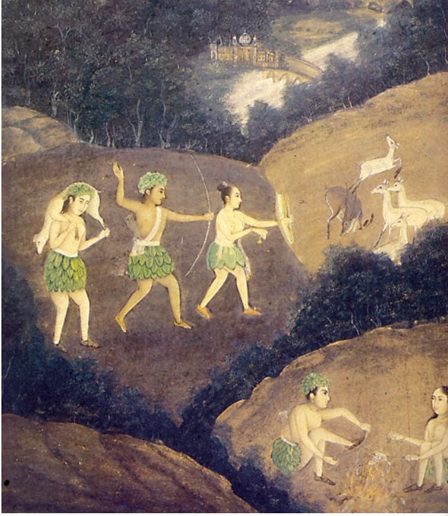
चित्र 2 रात में भील लोग हिरन का शिकार कर रहे हैं।