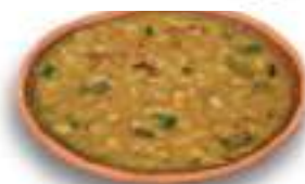
(a) कुछ पादप स्रोत

सारणी 1.2 में सूचीबद्ध कुछ कच्ची सामग्री जैसे फल और सब्जी के स्रोत का अनुमान लगाना हमारे लिए बहुत आसान हो सकता है (चित्र 1.2a)। यह कहाँ से आते हैं? निश्चित रूप से पौधों से। गेहूँ और चावल का क्या स्रोत है? आपने धान और गेहूँ के खेतों में उनके पौधों की अनेक पंक्तियाँ देखी होंगी। इनसे हमें अनाज प्राप्त होते हैं (चित्र 1.3)।