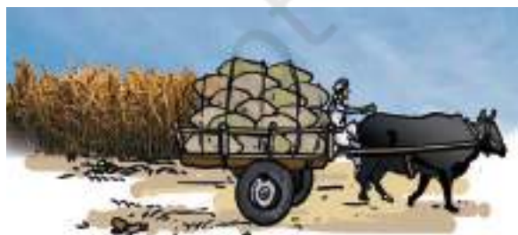
(b) गेहूँ का परिवहन