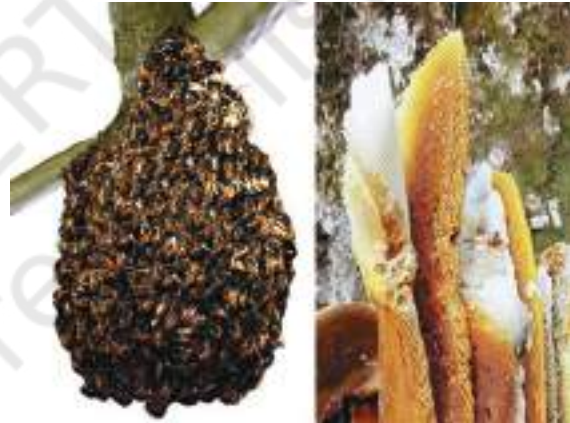
चित्र 1.7 मधुमक्खी का छत्ता

क्या आप जानते हैं कि शहद कहाँ से आता है या यह कैसे उत्पादित होता है? क्या आपने एक मधुमक्खी का छत्ता देखा है, जहाँ बहुत-सी मधुमक्खियाँ भिनभिनाया करती हैं? मधुमक्खियाँ फूलों से मकरंद (मीठे रस) एकत्रित करती हैं और इसे अपने छत्ते में भंडारित करती हैं (चित्र 1.7)। फूल और उनका मकरंद, वर्ष के केवल कुछ समय में ही उपलब्ध होते हैं। अतः मधुमक्खियाँ