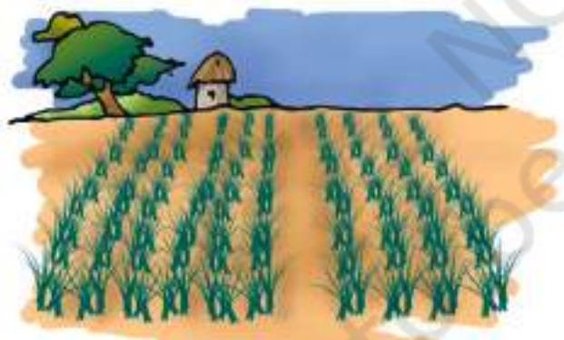
(a) धान का खेत

तथा फल इत्यादि के स्रोत हैं। जंतुओं से हमें दूध, मांस, अंडे तथा अन्य जांतव उत्पाद प्राप्त होते हैं। गाय, बकरी तथा भैंस दूध देने वाले कुछ सामान्य पशु हैं। दूध एवं विभिन्न दुग्ध उत्पाद जैसे कि मक्खन, क्रीम,