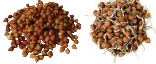
चित्र 1.6 चना एवं अंकुरित चना

अंकुरों को सावधानी से धोकर आप इन्हें खा सकते हैं। ये उबाले भी जा सकते हैं। इनमें कुछ मसाले मिलाने पर खाने के लिए एक स्वादिष्ट अल्पाहार तैयार हो जाता है।