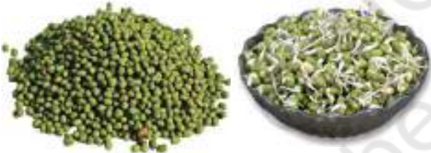
चित्र 1.5 साबुत मूँग एवं अंकुरित मूँग

मूँग अथवा चने के कुछ सूखे बीज लीजिए। अब इनमें से कुछ बीजों को जल से भरे एक पात्र में डाल दें तथा एक दिन के लिए छोड़ दीजिए। अगले दिन जल को पूरी तरह निकाल दें और बीजों को गिलास में रहने दें। उन्हें एक गीले कपड़े में लपेटकर एक ओर रख दीजिए। अब क्या आप बीजों में कुछ परिवर्तन देखते हैं? क्या एक छोटी-सी सफ़ेद संरचना