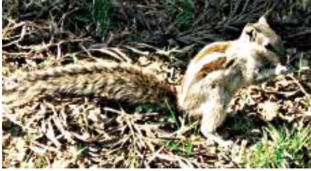
चित्र 1.8 गिलहरी अखरोट खाते हुए