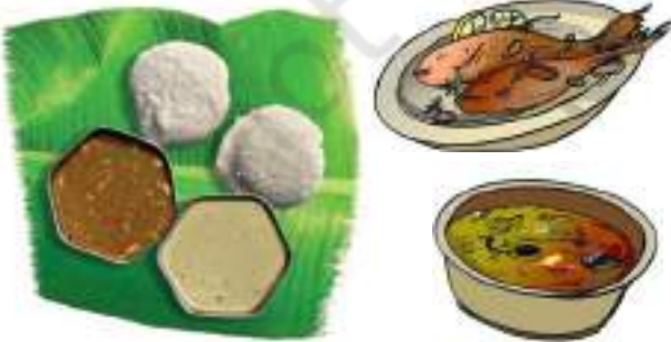
चित्र 1.1 विभिन्न खाद्य पदार्थ

अपने भोजन में हम अनेक प्रकार की चीजें खाते हैं (चित्र 1.1)। खाने की ये सभी चीजें किससे बनी हैं?