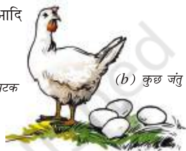
(b) कुछ जंतु स्रोत

कुछ अन्य खाद्य पदार्थ जैसे, दूध, अंडा, मुर्गा, मछली, झींगा, मांस आदि हमें जंतुओं से प्राप्त होते हैं (चित्र 1.2b)।