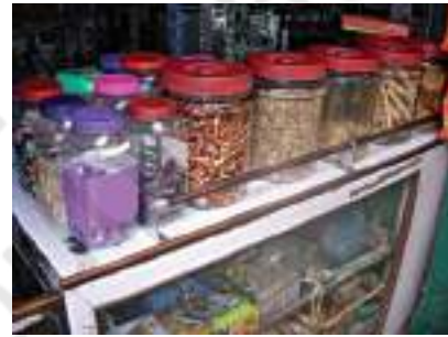
चित्र 4.8 दुकान में रखी पारदर्शी बोटलें

करते हैं ताकि खरीददार इन चीजों को आसानी से देख सके (चित्र 4.8)।