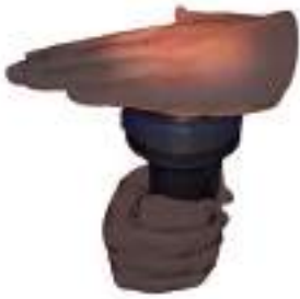
चित्र 4.9 क्या टॉर्च का प्रकाश आपकी हथेली से गुजरता है

अतः हम पदार्थों को अपारदर्शी, पारदर्शी तथा पारभासी के रूप में समूहों में बाँट सकते हैं।