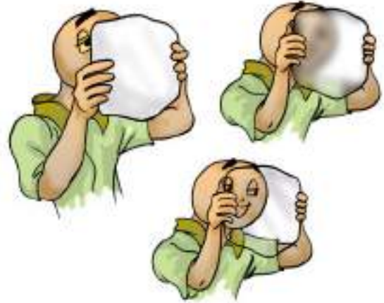
चित्र 4.7 मुखावरण अपारदर्शी, पारदर्शी, पारभासी

आपने लुका-छिपी का खेल खेला होगा। उन स्थानों के बारे में विचार करिए जहाँ आप खेलते समय छिपना चाहेंगे ताकि आप दूसरों को दिखाई न दें। आपने इन स्थानों को ही क्यों चुना? क्या आपने कभी शीशे की खिड़की के पीछे छिपने का प्रयास किया है? स्पष्ट रूप से नहीं, क्योंकि ऐसा करने पर आपका मित्र शीशे से देखकर आपका पता लगा लेगा। उन पदार्थों अथवा सामग्रियों जिनसे होकर वस्तुओं को देखा जा सकता है, उन्हें पारदर्शी कहते हैं (चित्र 4.7)। काँच, जल, वायु तथा कुछ प्लास्टिक पारदर्शी पदार्थों के उदाहरण हैं। प्रायः दुकानदार बिस्कुट, मिठाइयाँ तथा अन्य खाद्य पदार्थों को काँच अथवा प्लास्टिक के पारदर्शी पात्रों में रखना अधिक पसंद