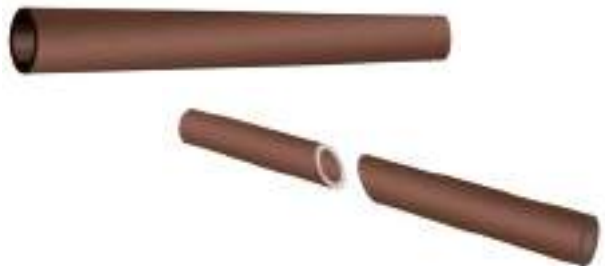
चित्र 4.3 धातुओं के टुकड़ों को उनकी द्युति देखने के लिए काटना

क्या आप अन्य पदार्थों में इसी प्रकार की कोई चमक अथवा द्युति देखते हैं? जैसे भी संभव हो सके किसी भी ढंग से इन्हें काटिए, ऐसा आप कक्षा में जितने भी पदार्थों के साथ कर सकते हैं,