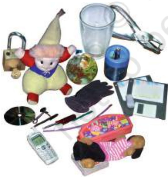
चित्र 4.1 हमारे चारों ओर की वस्तुएँ

आइए, अब हम अपने चारों ओर से जितनी संभव हो सके, उतनी वस्तुएँ एकत्र करते हैं। हममें से प्रत्येक अपने घर से प्रतिदिन उपयोग होने वाली एक वस्तु ला सकता है तथा कुछ वस्तुएँ कक्षा के कमरे से अथवा विद्यालय के बाहर से एकत्र कर सकता है। हमारे इस संग्रह में हमारे पास क्या होगा? चाक, पेंसिल, नोटबुक, रबड़, डस्टर (झाड़न), हथौड़ा, कील, साबुन, पहिए का आरा,