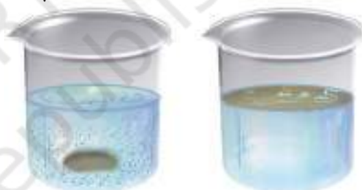
चित्र 4.4 क्या लुप्त होता है और क्या नहीं?

कुछ ठोस पदार्थों जैसे चीनी, नमक, चाक पाउडर, बालू (रेत) तथा लकड़ी के बुरादे के नमूने एकत्र कीजिए। काँच के पाँच गिलास लीजिए। प्रत्येक गिलास के लगभग 2/3 भाग में जल भरिए। पहले गिलास में कुछ मात्रा में (चम्मच भरकर) चीनी, दूसरे में नमक तथा इसी प्रकार शेष गिलासों में अन्य पदार्थ मिलाइए। प्रत्येक गिलास की अंतर्वस्तु को चम्मच से विलोडित कीजिए (धीरे-धीरे हिलाइए)। कुछ मिनट तक प्रतीक्षा कीजिए। प्रेक्षण कीजिए और पता लगाइए कि जल में मिलाए गए पदार्थों का क्या होता है (चित्र 4.4)। अपने प्रेक्षणों को सारणी 4.3 में दर्शाए अनुसार नोट कीजिए।