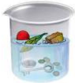
चित्र 4.6 जल में डूबती तथा तैरती वस्तुएँ

आकर तैरने लगे थे। अन्य डूबकर गिलास की तली में पहुँच गए थे, क्या यह सही नहीं है? हम ऐसे बहुत-से उदाहरण देखते हैं, जिनमें पदार्थ जल में तैरते रहते हैं अथवा डूब जाते हैं (चित्र 4.6)। किसी तालाब की सतह पर गिरी सूखी पत्तियाँ, वह कंकड़ जो आप इसी तालाब में फेंक देते हैं, शहद की कुछ बूंदें जिन्हें आप गिलास के जल में डालते हैं, इन सबका क्या होता है?