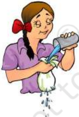
चित्र 4.2 कपड़े के गिलास का उपयोग करते हुए

क्या आपने कभी यह जानने का प्रयास किया है कि गिलास कपड़े का क्यों नहीं बनाया जाता? अध्याय 3 में कपड़े के टुकड़ों के साथ जो प्रयोग हमने किया था उसे याद कीजिए और यह ध्यान में रखिए कि हम गिलास का उपयोग सामान्यतः द्रवों को रखने के लिए करते हैं। इसलिए अब यदि हम कपड़े का गिलास बनाएँ तो क्या हमारा यह कार्य काफी हास्यास्पद प्रतीत नहीं होगा (चित्र 4.2)। गिलास बनाने के लिए हमें काँच, प्लास्टिक, धातु अथवा कोई ऐसा पदार्थ