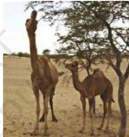
चित्र 9.2 ऊँट एवं उनका परिवेश

मरुस्थल में जल बहुत कम मात्रा में उपलब्ध होता है। मरुस्थल दिन में बहुत गरम एवं रात में ठंडा होता है। मरुस्थल में पाए जाने वाले पौधे एवं जंतु भूमि पर रहते हैं एवं श्वसन के लिए आस-पास की वायु का उपयोग करते हैं।