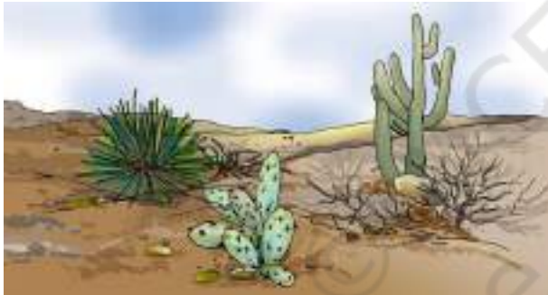
चित्र 9.5 मरुस्थल में उगने वाले कुछ पौधे

मरुस्थल में रहने वाले चूहे एवं साँप के, ऊँट की भाँति लंबे पैर नहीं होते। दिन की तेज़ गरमी से बचने के लिए वे भूमि के अंदर गहरे बिलों में रहते हैं (चित्र 9.4)। रात्रि के समय जब तापमान में कमी आती है, तो ये जंतु बाहर निकलते हैं।