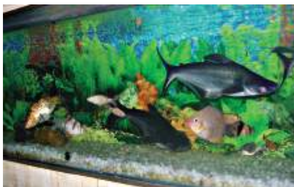
चित्र 9.3 विभिन्न प्रकार की मछलियाँ

में रहने योग्य बनाती है। ऊँट के पैर लंबे होते हैं जिससे उसका शरीर रेत की गरमी से दूर रहता है (चित्र 9.2)। उनमें मूत्रोत्सर्जन की मात्रा बहुत कम होती है तथा मल शुष्क होता है। उन्हें पसीना (स्वेद) भी नहीं आता क्योंकि शरीर से जल का हास बहुत कम होता है। इसलिए जल के बिना भी वे अनेक दिनों तक रह सकते हैं।