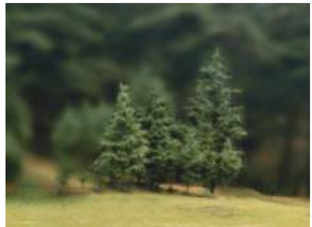
चित्र 9.6 पर्वतीय आवास के कुछ वृक्ष

पर्वतीय क्षेत्रों में पौधों एवं जंतुओं की अनेक प्रजातियाँ पाई जाती हैं। क्या आपने चित्र 9.6 में दर्शाए गए वृक्ष देखे हैं?