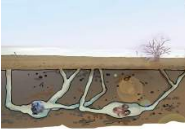
चित्र 9.4 बिल में मरुस्थलीय जंतु

मरुस्थल में रहने वाले चूहे एवं साँप के, ऊँट की भाँति लंबे पैर नहीं होते। दिन की तेज़ गरमी से बचने के लिए वे भूमि के अंदर गहरे बिलों में रहते हैं (चित्र 9.4)। रात्रि के समय जब तापमान में कमी आती है, तो ये जंतु बाहर निकलते हैं।