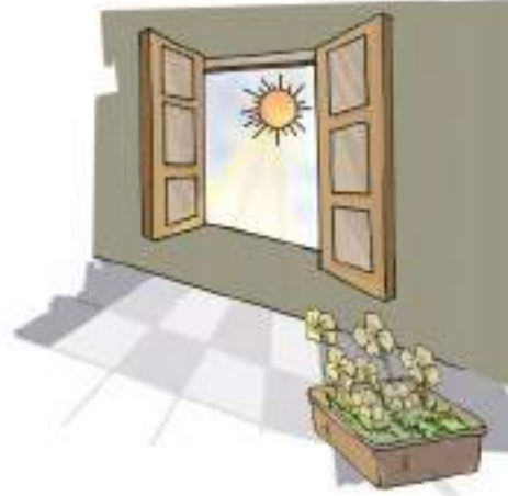
चित्र 9.12 पौधे की सूर्य के प्रकाश के प्रति अनुक्रिया

एक कमरे की खिड़की जिससे दिन के समय धूप (सूर्य का प्रकाश) आती हो, के पास एक पौधे का