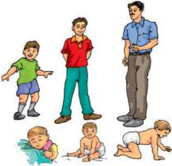
चित्र 9.10 एक शिशु वृद्धि करके वयस्क हो जाता है

का बच्चा) वृद्धि करके मुर्गी अथवा मुर्गा में परिवर्तित हो जाता है (चित्र 9.11)।