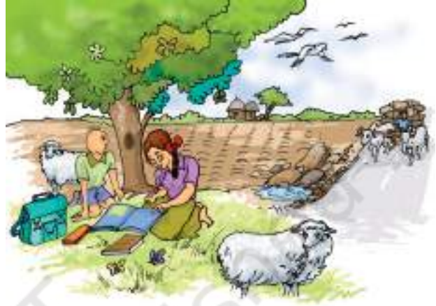
चित्र 9.1 सजीवों के लिए खोज

उन्होंने यह जानने की कोशिश की कि क्या पृथ्वी पर कोई ऐसा भी स्थान है, जहाँ कोई भी जीव नहीं पाया जाता। बूझो ने अपने घर के आस-पास के स्थानों का ध्यान किया। घर के अंदर उसने अलमारी एवं दरवाजों को देखा। उसने सोचा था कि इनमें कोई सजीव नहीं होगा, परंतु उसे एक छोटी-सी मकड़ी नज़र आई। घर से बाहर भी वह किसी ऐसे स्थान के बारे में नहीं सोच पाया जहाँ किसी न किसी प्रकार के जीव न पाए जाते हों (चित्र 9.1)। पहेली ने दूर-दूर के स्थानों के विषय में पढ़ना एवं सोचना प्रारंभ किया। उसे पता लगा कि लोगों ने तो ज्वालामुखी के मुख (मुहाने) में भी सूक्ष्म जीवों को खोज निकाला है।