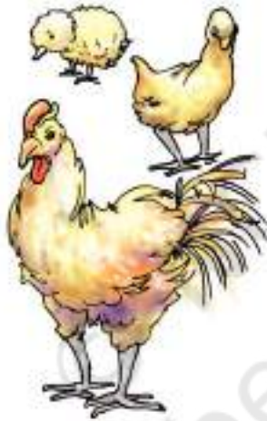
चित्र 9.11 एक चूजा वृद्धि कर वयस्क हो जाता है

क्या हम श्वसन के बिना जीवित रह सकते हैं? जब हम श्वास लेते हैं तो बाहर की वायु शरीर के अंदर