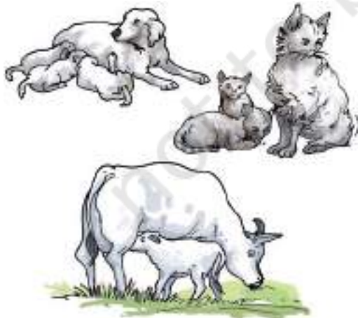
चित्र 9.14 बच्चे देने वाले कुछ जंतु

जंतु प्रजनन द्वारा अपने समान संतान उत्पन्न करते हैं। भिन्न जंतुओं में प्रजनन का ढंग अलग-अलग होता है। कुछ जंतु अंडे देते हैं जिनसे शिशु निकलते हैं। कुछ जंतु शिशु को जन्म देते हैं (चित्र 9.14)।