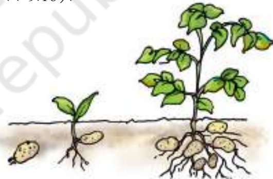
चित्र 9.16 आलू की सुप्त कलिका से उगता एक पौधा

कुछ पौधे बीज के अतिरिक्त अपने कायिक भागों द्वारा भी नए पौधे उत्पन्न करते हैं। उदाहरणतः आलू के कलिका वाले भाग से नया पौधा बनता है (चित्र 9.16)।