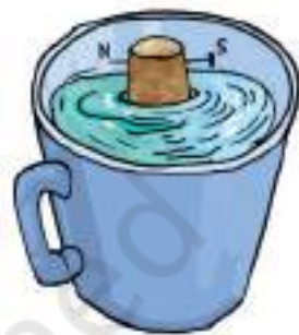
चित्र 13.12 प्याले में एक कंपास

इसे पानी से भरे प्याले अथवा टब में तैराइए। यह सुनिश्चित कीजिए कि सुई पानी को न छुए (चित्र 13.12)। अब आपकी कंपास कार्य करने के लिए तैयार है। तैरती कॉर्क पर लगी सुई की दिशा नोट कीजिए। सुई लगी कॉर्क को