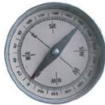
चित्र 13.10 कंपास

तत्पश्चात् चुंबकों के इस गुण पर आधारित एक युक्ति विकसित हुई। यह कंपास (दिक्सूचक) के नाम से जानी जाती है। कंपास सामान्यतः काँच के ढक्कन वाली एक छोटी डिब्बी होती है। एक चुंबकित सुई डिब्बी के अंदर एक धुरी पर लगी होती है जो स्वतंत्रतापूर्वक घूमती है (चित्र 13.10)। कंपास में एक डायल भी होता है जिसपर दिशाएँ अंकित होती हैं। कंपास को उस स्थान पर रखते हैं जहाँ हमें दिशा निर्धारण करना होता है। इसकी सुई विरामावस्था में उत्तर-दक्षिण दिशा को निर्देशित करती है। कंपास को तब तक घुमाते हैं जब तक कि डायल पर अंकित उत्तर-दक्षिण के चिह्न, सुई के दोनों सिरो पर न आ जाएँ। चुंबकीय सुई के उत्तरी ध्रुव की पहचान के लिए सामान्यतः इसे भिन्न रंग से पेंट किया जाता है।