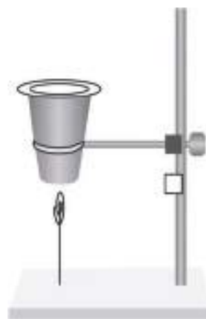
चित्र 13.5 चुंबक का प्रभाव – हवा में लटका पेपर क्लिप

प्लास्टिक अथवा कागज का एक प्याला लीजिए। इसे एक स्टैंड पर शिकंजे (क्लैंप) की सहायता से कस दीजिए जैसा कि चित्र 13.5 में दर्शाया गया है। प्याले के अंदर एक चुंबक रखिए तथा इसे कागज से ढक दीजिए, जिससे कि चुंबक दिखाई न दे। लोहे के बने एक क्लिप को एक धागे से बाँधिए। धागे के दूसरे सिरे को स्टैंड के आधार के साथ बाँध दीजिए। (ध्यान रखें, धागे की लंबाई को पर्याप्त छोटा रखना यहाँ एक युक्ति है।) क्लिप को प्याले के आधार के समीप लाइए। क्लिप बिना किसी सहारे के एक पतंग की भाँति हवा में रुका रहता है।