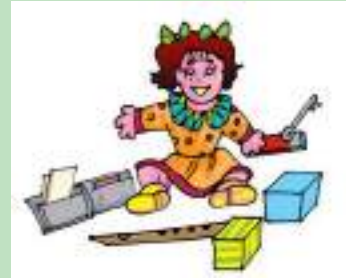
चित्र 13.17 एक बुद्धिमान गुड़िया