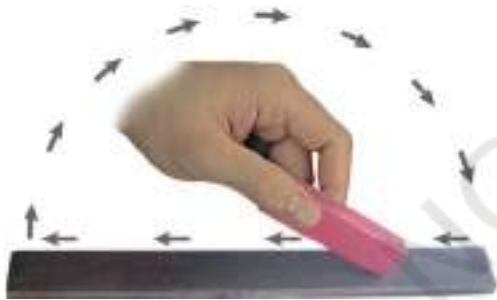
चित्र 13.11 अपना स्वयं का चुंबक बनाना

चुंबक बनाने की अनेक विधियाँ हैं। आइए, हम सरलतम विधि सीखें। लोहे का एक आयताकार टुकड़ा लीजिए। इसे मेज पर रखिए। अब एक छड़ चुंबक लीजिए तथा इसका कोई एक ध्रुव लोहे की छड़ के एक सिरे पर रखिए। चुंबक को बिना हटाए इसे लोहे की छड़ के दूसरे सिरे तक ले जाइए। चुंबक को उठाइए तथा उसी ध्रुव को लोहे के टुकड़े के प्रारंभिक सिरे पर वापस ले आइए (चित्र 13.11)। इसी प्रकार चुंबक को लोहे की छड़ के अनुदिश बार-बार ले जाइए। इस प्रक्रिया को लगभग 30-40 बार दोहराइए। जाँच कीजिए कि क्या लोहे की छड़ चुंबक बन गई है। इसके लिए कोई पिन अथवा लोहे का बुरादा