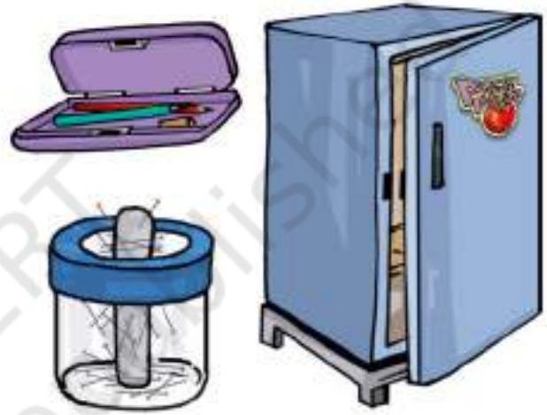
चित्र 13.2 कुछ सामान्य वस्तुएँ जिनमें चुंबक होते हैं

व्यवस्था के बिना भी जब हम ढक्कन बंद करते हैं तो यह कसकर बंद हो जाता है। ऐसे चिपकू, पिनधारकों तथा पेंसिल बॉक्सों में चुंबक लगे होते हैं (चित्र 13.2)।