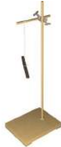
चित्र 13.9 स्वतंत्रतापूर्वक लटका चुंबक सदैव एक ही दिशा में आकर रुकता है।

एक छड़ चुंबक लीजिए। इसके एक सिरे पर पहचान के लिए एक चिह्न लगाइए। अब एक धागे को चुंबक के मध्य बिंदु से बाँधिए जिससे कि इसे एक लकड़ी के स्टैंड पर लटका सकें (चित्र 13.9)। यह सुनिश्चित कीजिए कि चुंबक प्रत्येक दिशा में स्वतंत्रतापूर्वक घूम सके। इसे विराम अवस्था में आने दीजिए। चुंबक की विरामावस्था में इसके दोनों सिरों की स्थिति दर्शाने के लिए धरती पर दो बिंदु चिह्नित कीजिए। इन बिंदुओं को एक रेखा से मिलाइए। यह रेखा उस दिशा को दर्शाती है, जिस दिशा में चुंबक अपनी विरामावस्था