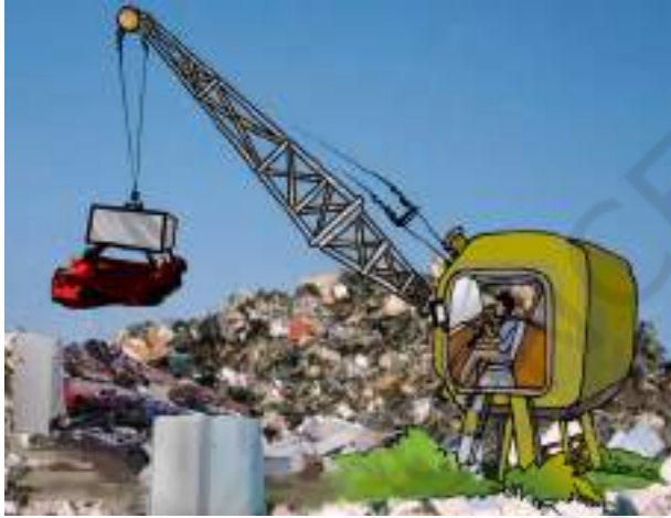
चित्र 13.1 कबाड़ के ढेर से लोहे के टुकड़ों का चयन

पहेली तथा बूझो ऐसे स्थान पर गए, जहाँ अपशिष्ट (कूड़ा-कबाड़) पदार्थ के बड़े-बड़े ढेर थे। कुछ प्रोत्साहक घटना घट रही थी। कूड़े के ढेर की ओर एक क्रेन जा रही थी। क्रेन ने इस ढेर की ओर एक गुटके को नीचे किया। फिर वह गुटका ऊपर उठने लगा। अनुमान कीजिए, यहाँ क्या हुआ? बेकार पुराने लोहे के बहुत से टुकड़े गुटके के साथ चिपककर क्रेन के साथ जाने लगे (चित्र 13.1)!