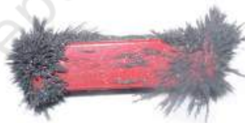
चित्र 13.7 छड़ चुंबक से चिपका लोहे का बुरादा

एक कागज़ की शीट पर लोहे का बुरादा फैलाइए। इस शीट के ऊपर एक छड़ चुंबक रखिए। आप क्या देखते हैं? क्या लोहे का बुरादा चुंबक के सभी स्थानों पर एक समान रूप से चिपकता है? क्या आप चुंबक के किसी भाग में किसी अन्य भाग से अधिक लोहे का बुरादा चिपका हुआ देखते हैं (चित्र 13.7)? चुंबक से