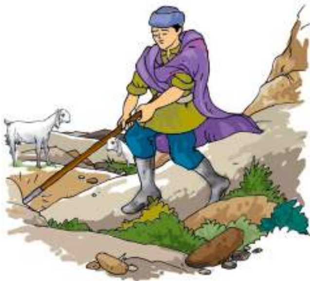
चित्र 13.3 एक पहाड़ी पर प्राकृतिक चुंबक

प्रतीत हो रही थी। यह चट्टान एक प्राकृतिक चुंबक थी और इसने गड़रिए की छड़ी की लोहे की टोपी को अपनी ओर आकर्षित कर लिया था। कहा जाता है कि इस प्रकार प्राकृतिक चुंबक की खोज हुई। संभवतः उस गड़रिए के नाम पर उस पत्थर को मैग्नेटाइट नाम दिया गया। मैग्नेटाइट में लोहा होता है। कुछ लोगों का विश्वास है कि यह मैग्नेटाइट, मैग्नेशिया नामक स्थान पर सबसे पहले पाया गया था। जिन पदार्थों में लोहे को आकर्षित करने का गुण पाया जाता है वे चुंबक कहलाते हैं।