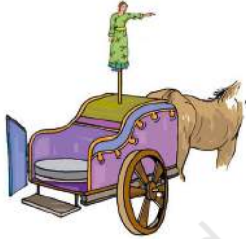
चित्र 13.8 दिशा दिखलाते हुए मूर्ति वाला रथ

हमने ज्ञात किया कि अधिकतर लोहे का बुरादा छड़ चुंबक के दोनों सिरों के पास चिपकता है। चुंबक के ध्रुव इन सिरों के नजदीक होते हैं। कक्षा में विभिन्न आकृति के चुंबकों को लाने का प्रयास कीजिए। लोहे के बुरादे का उपयोग करके इन चुंबकों के ध्रुवों की स्थिति की जाँच कीजिए।