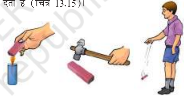
चित्र 13.15 चुंबक गर्म करने पर, हथौड़े से पीटने पर और ऊँचाई से गिराने पर अपने गुण खो देते हैं।

यदि चुंबक को गर्म किया जाए, हथौड़े से पीटा जाए या ऊँचाई से गिराया जाए तो वह अपने गुण खो देता है (चित्र 13.15)।