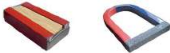
चित्र 13.16 अपनी चुंबकों का सुरक्षित भंडारण कीजिए

यदि चुंबकों का उचित रख रखाव न हो तब भी ये समय के साथ क्षीण हो जाते हैं। छड़ चुंबकों को सुरक्षित रखने के लिए उनके जोड़ों के असमान ध्रुवों को पास-पास रखा जाना चाहिए। इन चुंबकों को लकड़ी के टुकड़े से पृथक करके इनके सिरों पर नर्म लोहे के दो टुकड़े लगाने चाहिए। (चित्र 13.16)।