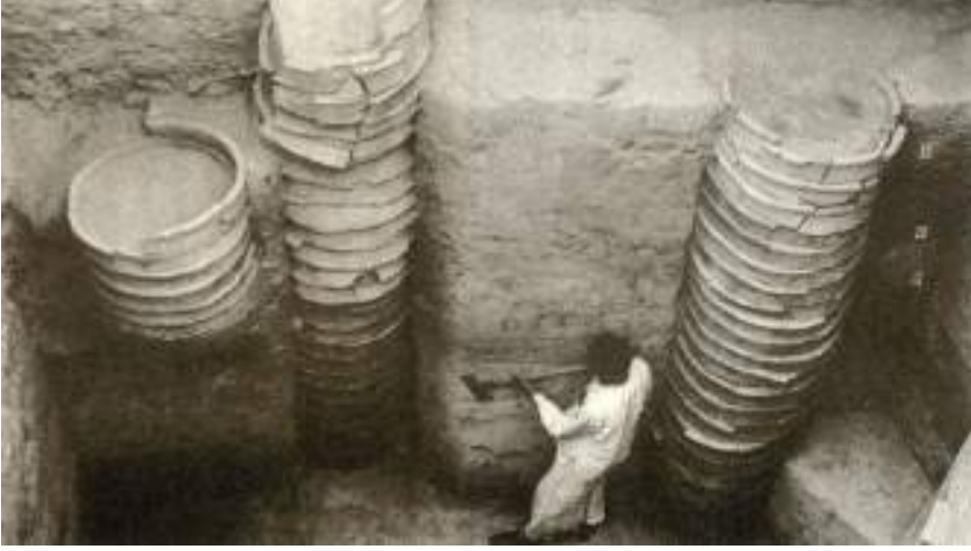
दिल्ली में मिला वलयकूप।

हड़प्पा की जल निकास व्यवस्था से यह कैसे भिन्न है?