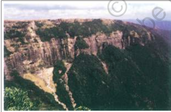
चित्र 6.5 : पठार

पठार बहुत उपयोगी होते हैं क्योंकि उनमें खनिजों की प्रचुरता होती है। यही कारण है कि विश्व के बहुत से खनन क्षेत्र पठारी भागों में स्थित हैं। अफ्रीका का पठार सोना एवं हीरों के खनन के लिए प्रसिद्ध है। भारत में छोटानागपुर के पठार में लोहा, कोयला तथा मैंगनीज के बहुत बड़े भंडार पाए जाते हैं।