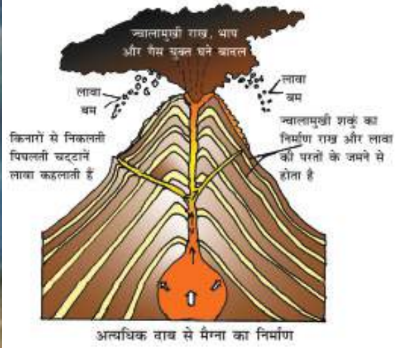
चित्र 6.4 : ज्वालामुखी पर्वत