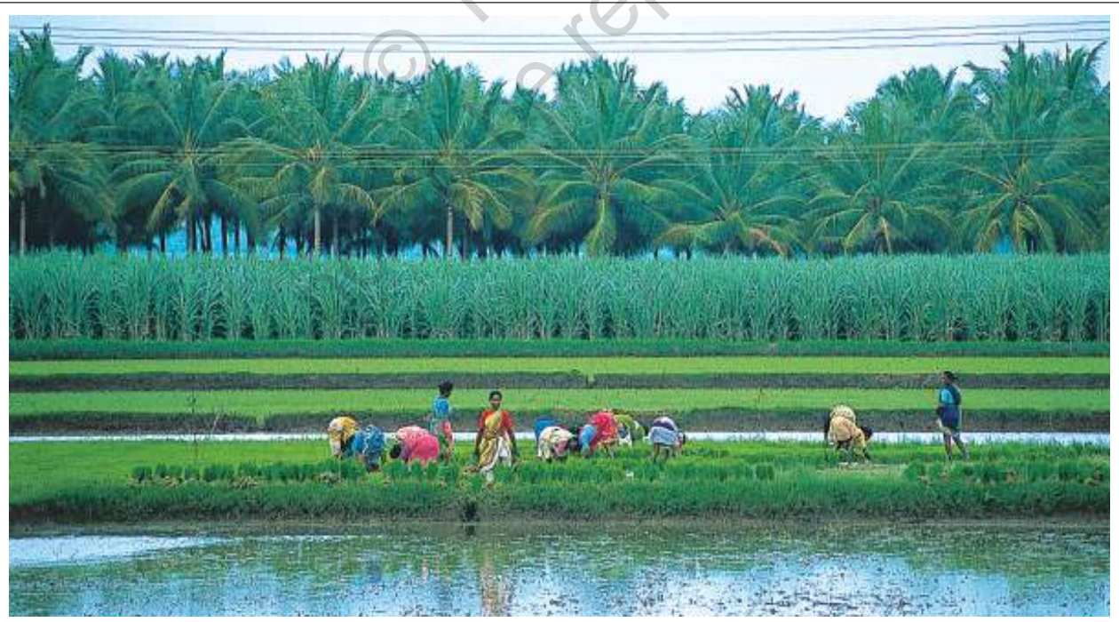
चित्र 6.6 : मैदान

स्थलरूपों की विभिन्नता के अनुरूप ही मानव विभिन्न प्रकार से जीवनयापन करते हैं। पर्वतीय क्षेत्रों का जीवन कठिन होता है। मैदानी क्षेत्रों का जीवन पर्वतीय क्षेत्रों की तुलना में सरल होता है। मैदानों में फसलें