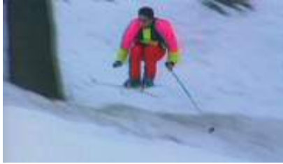
इस खेल का नाम बताएँ