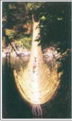
चित्र 6.7 : रस्सी से बना पुल (अरुणाचल प्रदेश)