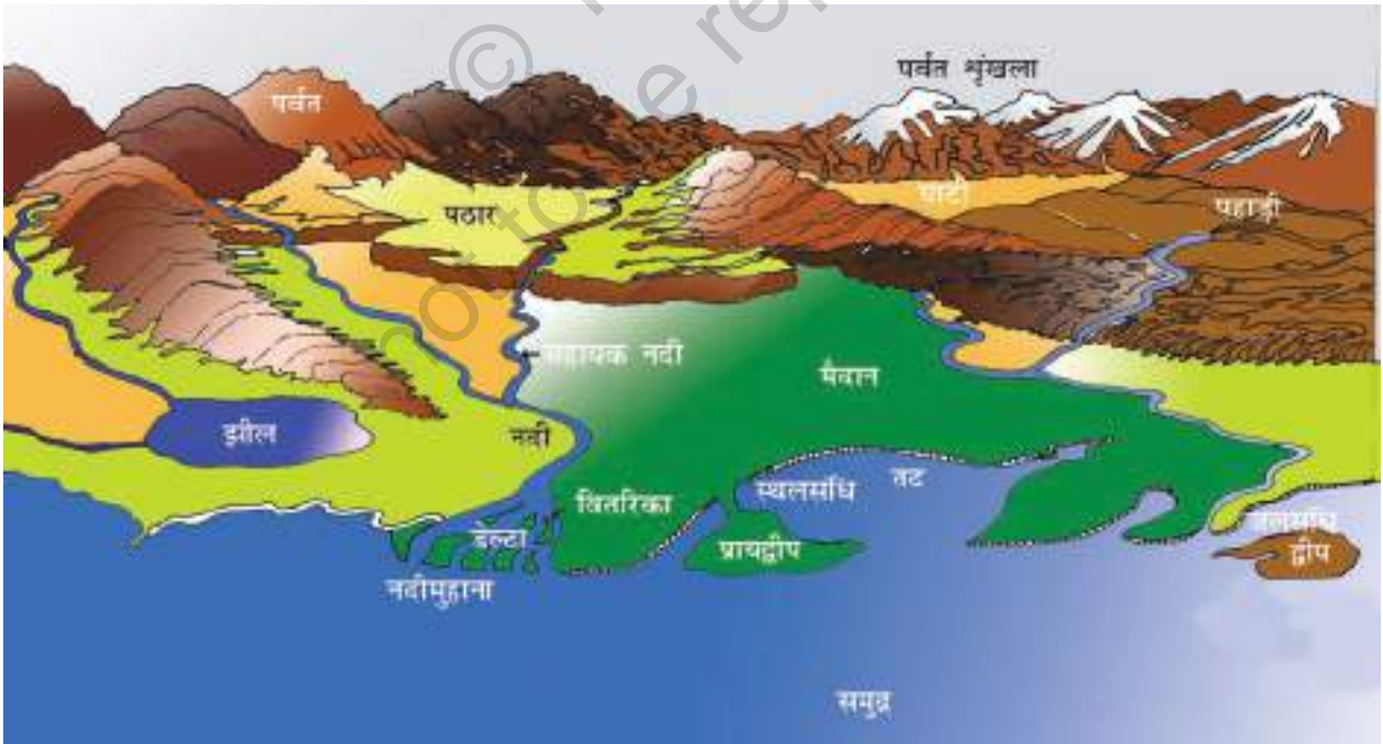
चित्र 6.1 : विभिन्न स्थलरूप

पहाड़ी वह स्थलीय भाग है जो कि आस-पास की भूमि से ऊँची उठी होती है। 600 मीटर से अधिक ऊँचाई एवं खड़ी ढाल वाली पहाड़ी को पर्वत कहा जाता है। 8,000 मीटर से ऊँचे कुछ पर्वतों के नाम बताएँ।