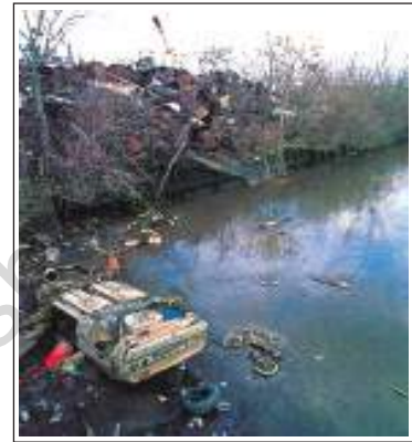
चित्र 6.8 : एक प्रदूषित नदी

हम लोग कूड़ा किसी भी भूमि पर या पानी में फेंक देते हैं जो कि उन्हें गंदा कर देता है। हमें प्रकृति के इस महत्वपूर्ण वरदान का उपयोग इस प्रकार नहीं करना चाहिए। उपलब्ध भूमि केवल हमारे ही उपयोग के लिए नहीं है। यह हमारा कर्तव्य है कि हम आगे आने वाली पीढ़ियों के लिए पृथ्वी को सुरक्षित रखें।