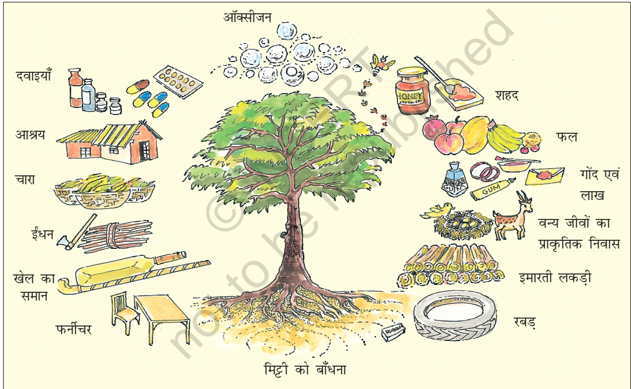
चित्र 8.2: वनों के उपयोग