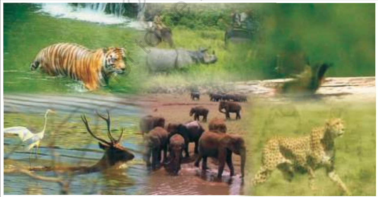
चित्र 8.3 : वन्य जीवन

वनों के कटने तथा जानवरों के शिकार के कारण भारत में पाए जाने वाले वन्यजीवों की प्रजातियाँ तेज़ी से घट रही हैं। बहुत सी प्रजातियाँ तो समाप्त भी हो चुकी हैं। उनको बचाने के लिए बहुत से नेशनल पार्क, पशुविहार तथा जीवमंडल आरक्षित क्षेत्र स्थापित किए गए हैं। सरकार ने हाथियों तथा बाघों को बचाने के लिए बाघ परियोजना एवं हस्ति परियोजना जैसी परियोजनाओं को शुरू किया है। क्या आप भारत के कुछ पशुविहारों के नाम तथा मानचित्र पर उनकी स्थिति बता सकते हैं?