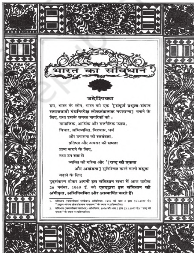
संविधान का पहला पृष्ठ जिसमें स्पष्ट कहा गया है कि सभी भारतीयों को समान प्रतिष्ठा और समान अवसर प्राप्त हैं।

संविधान के लेखकों ने यह भी कहा कि विविधता की इज्जत करना, उसे मूल्यवान मानना समानता सुनिश्चित करने में बहुत ही महत्वपूर्ण कारक है। उन्होंने यह महसूस किया कि लोगों को अपने धर्म का पालन करने, अपनी भाषा बोलने, अपने त्योहार मनाने और अपने आप को खुले रूप से अभिव्यक्त करने की आज़ादी होनी चाहिए। उन्होंने कहा कि कोई एक भाषा, धर्म या त्योहार सबके लिए अनिवार्य नहीं बनना चाहिए। उन्होंने जोर दिया कि सरकार सभी धर्मों को बराबर मानेगी। इसीलिए भारत एक धर्मनिरपेक्ष देश है जहाँ लोग बिना भेदभाव के अपने धर्म का पालन करते हैं। इसे हमारी एकता के महत्वपूर्ण कारक के रूप में देखा जाता है कि हम इकट्ठे रहते हैं और एक दूसरे की इज्जत करते हैं।