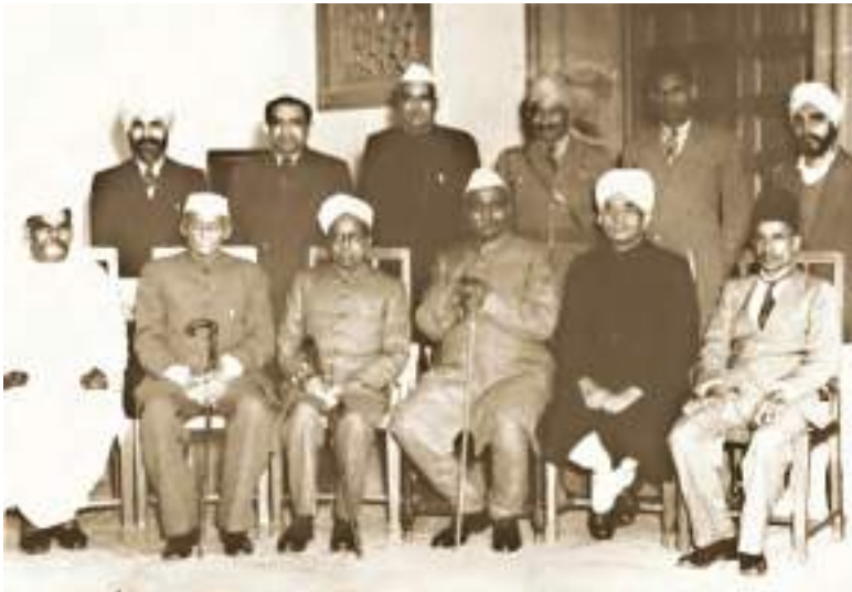
भारत का संविधान लिखने वाली समिति के कुछ सदस्य

संविधान के लेखकों ने यह भी कहा कि विविधता की इज्जत करना, उसे मूल्यवान मानना समानता सुनिश्चित करने में बहुत ही महत्वपूर्ण कारक है। उन्होंने यह महसूस किया कि लोगों को अपने धर्म का पालन करने, अपनी भाषा बोलने, अपने त्योहार मनाने और अपने आप को खुले रूप से अभिव्यक्त करने की आज़ादी होनी चाहिए। उन्होंने कहा कि कोई एक भाषा, धर्म या त्योहार सबके लिए अनिवार्य नहीं बनना चाहिए। उन्होंने जोर दिया कि सरकार सभी धर्मों को बराबर मानेगी। इसीलिए भारत एक धर्मनिरपेक्ष देश है जहाँ लोग बिना भेदभाव के अपने धर्म का पालन करते हैं। इसे हमारी एकता के महत्वपूर्ण कारक के रूप में देखा जाता है कि हम इकट्ठे रहते हैं और एक दूसरे की इज्जत करते हैं।