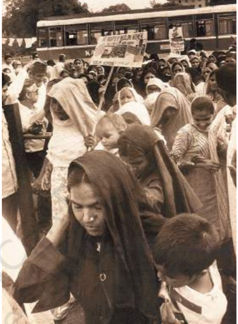
अपने अधिकारों की माँग करती हुई औरतें

1947 में भारत जब आज़ाद हुआ और एक राष्ट्र बना तो हमारे नेताओं ने समाज में व्याप्त कई तरह की असमानताओं पर विचार किया। संविधान को लिखने वाले लोग भी इस बात से अवगत थे कि हमारे समाज में कैसे भेदभाव किया जाता है और लोगों ने उसके खिलाफ किस तरह संघर्ष किया है। कई नेता इन लड़ाइयों के हिस्सा थे जैसे डा. अंबेडकर। इसलिए नेताओं ने संविधान में ऐसी दृष्टि और लक्ष्य रखा जिससे भारत में सभी लोगों को बराबर माना जाए। समानता को एक अहम मूल्य की तरह माना गया है जो हम सभी को एक भारतीय के रूप में जोड़ती है। प्रत्येक व्यक्ति को समान अधिकार और समान अवसर प्राप्त हैं। अस्पृश्यता यानी छुआछूत को अपराध की तरह देखा जाता है और