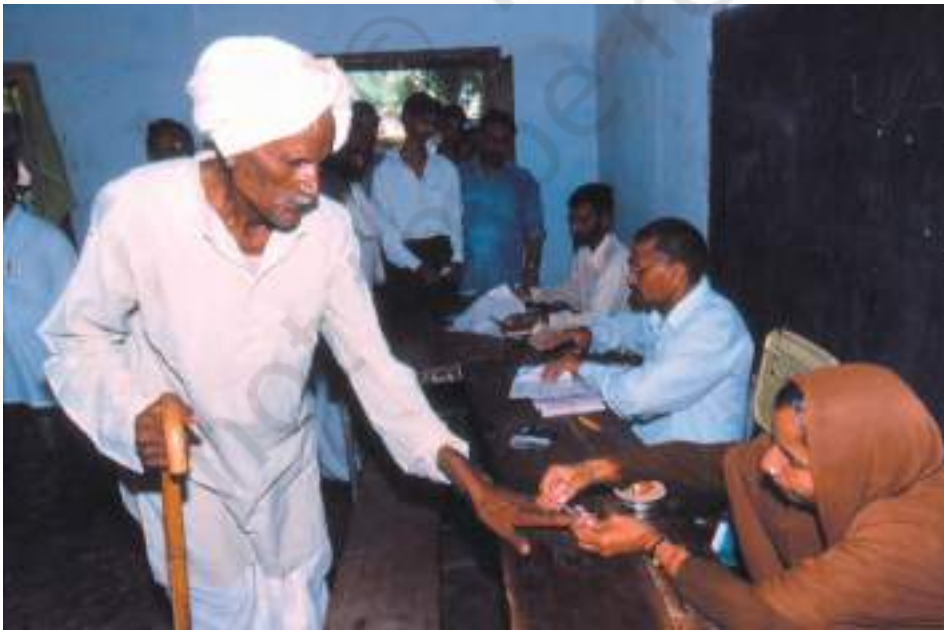
मतदान के समय मतदाता की उँगली पर स्याही से निशान लगाया जाता है ताकि वह केवल एक वोट दे सके – ग्रामीण मतदान केंद्र का दृश्य

लोकतंत्र में मूलभूत विचार यह है कि लोग नियमों को बनाने में भागीदार बनकर खुद ही शासन करें। आज के समय में लोकतांत्रिक सरकार को प्रायः प्रतिनिधि लोकतंत्र कहते हैं। प्रतिनिधि लोकतंत्र में लोग सीधे भाग नहीं लेते हैं, बल्कि चुनाव की प्रक्रिया के द्वारा अपने प्रतिनिधि को चुनते हैं। ये प्रतिनिधि मिलकर