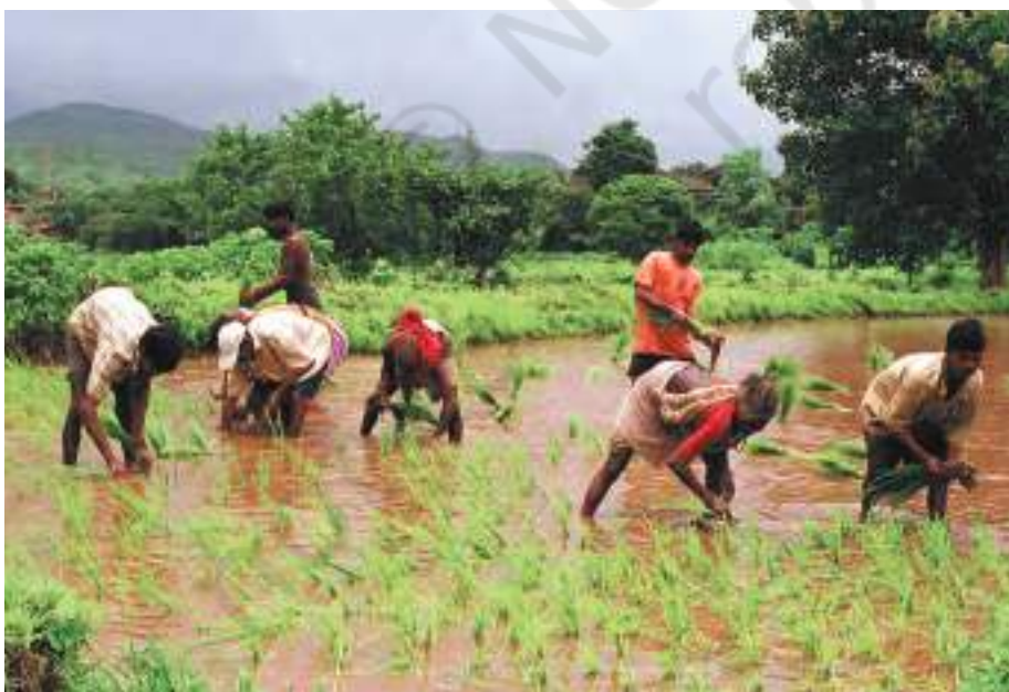
धान की रोपाईं कमरतोड़ काम होता है

कलपट्टु में कुछ लोग नर्स, शिक्षक, धोबी, बुनकर, नाई, साइकिल ठीक करने वाले और लोहार के रूप में अपनी सेवाएँ देते हैं। यहाँ कुछ दुकानदार एवं व्यापारी भी हैं। जो मुख्य गली है वह बाज़ार की तरह दिखती है। उसमें आपको तरह-तरह की कई छोटी दुकानें दिखेंगी जैसे चाय, सब्जी, कपड़े की दुकान तथा दो दुकानें बीज और खाद की। चार दुकानें चाय की हैं जहाँ 'टिफ़िन' भी मिलता है। यहाँ