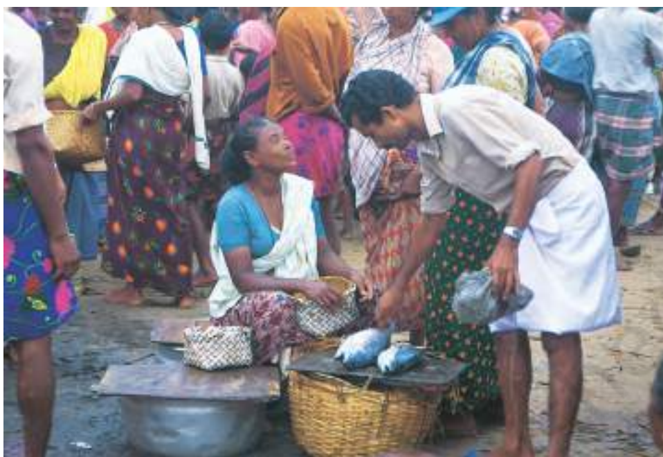
स्थानीय बाजार में मछलियाँ बेचती हुई मछुआरिनें

होता है। इन महीनों में हम व्यापारी से उधार लेकर अपना गुज़ारा चलाते हैं। इस कारण बाद में हमें मजबूरी में उसी व्यापारी को मछली बेचनी पड़ती है और हम खुद खुली नीलामी