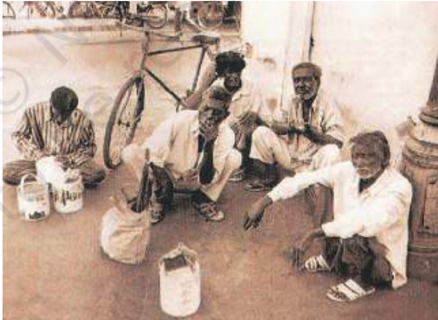
लेबर चौक पर दिहाड़ी मज़दूर अपने औज़ारों के साथ बैठकर लोगों का इंतज़ार करते हैं। लोग उन्हें काम करवाने के लिए वहीं से ले जाते हैं।

हम फ़ैक्ट्री में घुसे तो हमने पाया कि वहाँ अलग-अलग काम के लिए अलग-अलग विभाग थे। उनमें ऐसा लग रहा था कि लोगों की कभी न खत्म होने वाली पंक्तियाँ थीं। जहाँ कपड़े सिले जा रहे थे उस विभाग में हमने देखा कि लोग छोटे से कमरे में मशीनों पर काम कर रहे थे। एक-एक व्यक्ति एक-एक सिलाई की मशीन पर लगा हुआ था और हर कमरे में ऐसी बहुत सारी मशीनें थीं। जो कपड़े तैयार हो रहे थे वे कमरे में एक तरफ तह कर के लगाए जा रहे थे।