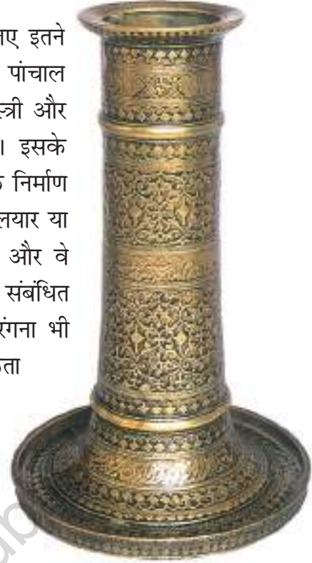
चित्र 4 पीतल के इस मोमबत्तीदान पर काला आवरण है।

बीदर के शिल्पकार ताँबे तथा चाँदी में जड़ाई के काम के लिए इतने अधिक प्रसिद्ध थे कि इस शिल्प का नाम ही 'बीदरी' पड़ गया। पांचाल अर्थात् विश्वकर्मा समुदाय जिसमें सुनार, कसेरे, लोहार, राजमिस्त्री और बढई शामिल थे; मंदिरों के निर्माण के लिए आवश्यक थे। इसके अलावा वे राजमहलों, बड़े-बड़े भवनों, तालाबों और जलाशयों के निर्माण में भी अपनी महत्वपूर्ण भूमिका अदा करते थे। इसी प्रकार सालियार या कैक्कोलार जैसे बुनकर भी समृद्धिशाली समुदाय बन गए थे और वे मंदिरों को भारी दान-दक्षिणा दिया करते थे। वस्त्र-निर्माण से संबंधित कुछ अन्य कार्य, जैसे-कपास को साफ़ करना, कातना और रंगना भी स्वतंत्र व्यवसाय बन गए थे, जिनके लिए विशेषज्ञता की आवश्यकता होती थी।