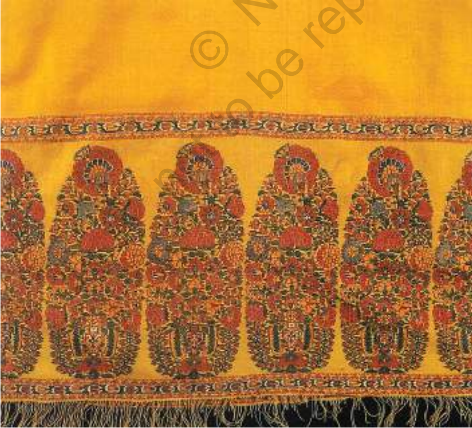
चित्र 5 शॉल का बॉर्डर