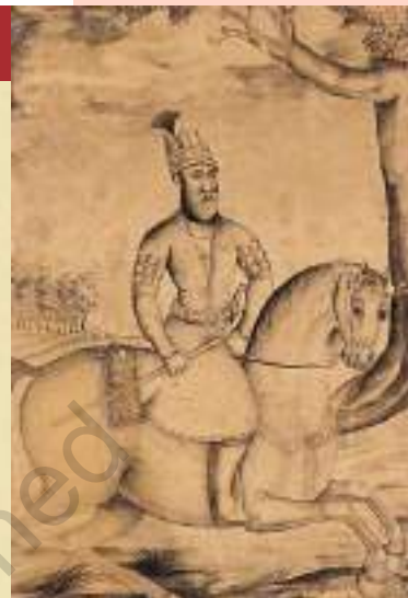
चित्र 1 नादिरशाह का 1779 का एक चित्र