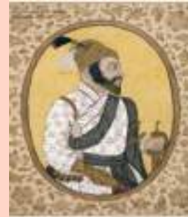
चित्र 7a शिवाजी का रूपचित्र

पेशवाओं की देखरेख में मराठों ने एक अत्यंत सफल सैन्य संगठन का विकास कर लिया। उनकी सफलता का रहस्य यह था कि वे मुगलों के किलाबंद इलाकों से टक्कर न लेते हुए, उनके पास से चुपचाप निकलकर शहरों-कस्बों पर हमला बोलते थे और मुगल सेना से ऐसे मैदानी इलाकों में मुठभेड़ लेते थे; जहाँ रसद पाने और कुमक आने के रास्ते आसानी से रोके जा सकते थे।