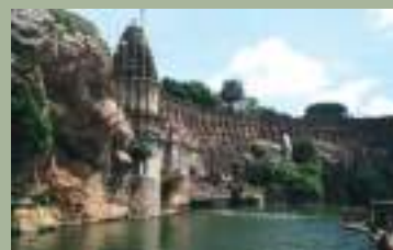
चित्र 4a चित्तौड़गढ़ किला, राजस्थान

कई राजपूत सरदारों ने पहाड़ियों की चोटियों पर किले बनाये, जो सत्ता के केंद्र बने। व्यापक किलेबंदी के साथ इन भव्य संरचनाओं में नगर, महलें, मंदिर, व्यापारिक केंद्र, जल संग्रहण संरचनाएं और अन्य इमारतें होती थीं। चित्तौड़गढ़ किले में, तालाब, कुण्डी (कुएं), बावली जैसे कई जल निकाय थे।