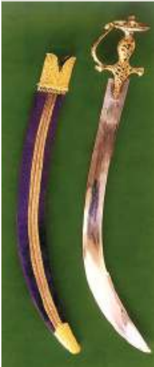
चित्र 7 महाराजा रणजीत सिंह की तलवार

खालसा से क्या अभिप्राय है? क्या आपको याद है कि इसके बारे में आपने अध्याय 8 में पढ़ा है?