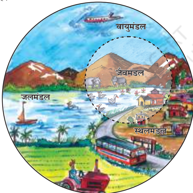
चित्र 1.2 : पर्यावरण के क्षेत्र

स्थलमंडल वह क्षेत्र है, जो हमें वन, कृषि एवं मानव बस्तियों के लिए भूमि, पशुओं को चरने के लिए घासस्थल प्रदान करता है। यह खनिज संपदा का भी एक स्रोत है।