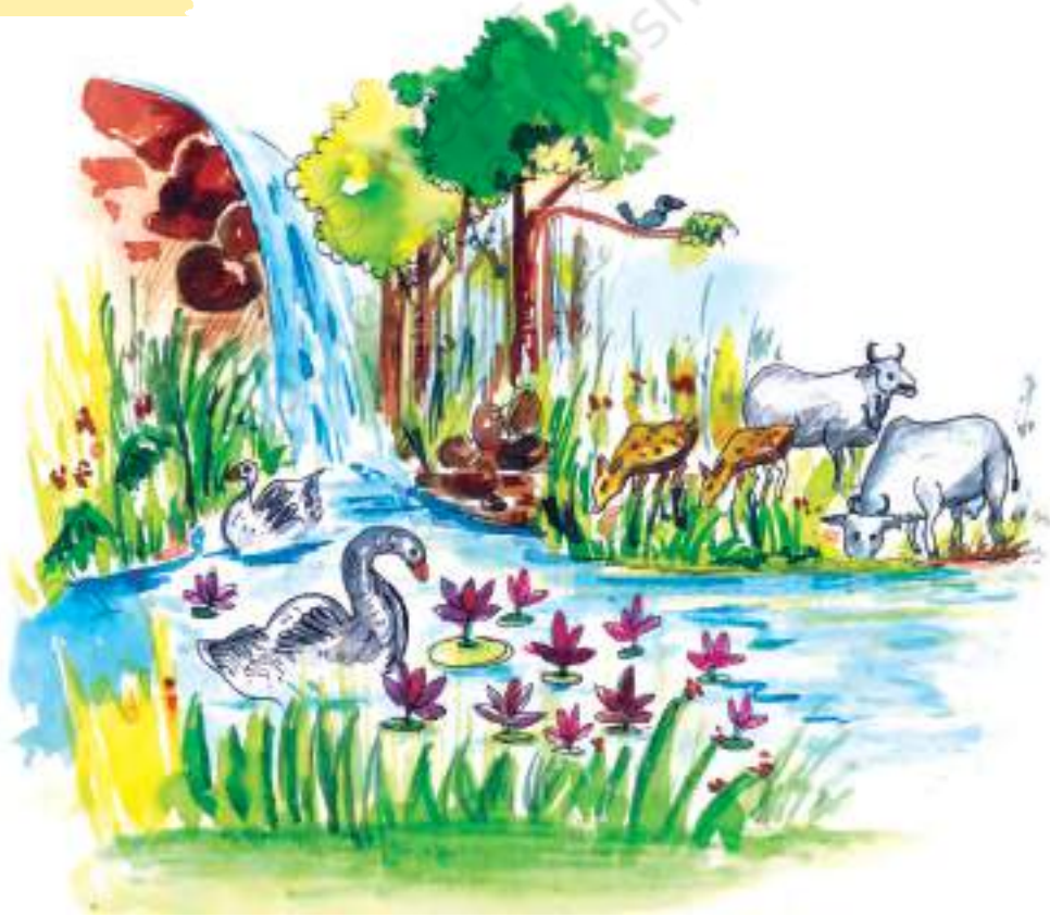
चित्र 1.3 : एक ताल का पारितंत्र