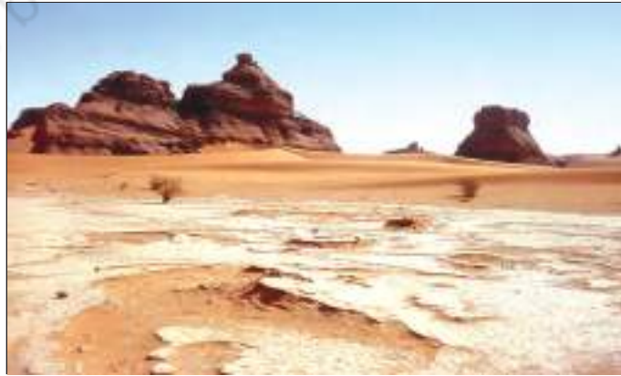
चित्र 9.1 : सहारा रेगिस्तान

विश्व एवं अफ्रीका महाद्वीप के मानचित्र को देखिए। उत्तरी अफ्रीका के बड़े भू-भाग पर फैले सहारा के रेगिस्तान का पता लगाएँ। यह विश्व का सबसे बड़ा रेगिस्तान है। यह लगभग 8.54 लाख वर्ग किलोमीटर के क्षेत्र में फैला हुआ है। क्या आपको याद है कि भारत का क्षेत्रफल 3.2 लाख वर्ग किलोमीटर है? सहारा रेगिस्तान ग्यारह देशों से घिरा हुआ है। ये देश हैं—अल्जीरिया, चाड, मिस्र, लीबिया, माली, मौरितानिया, मोरक्को, नाइजर, सूडान, ट्यूनिशिया एवं पश्चिमी सहारा।