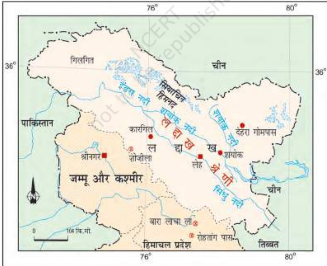
चित्र 9.4 : लद्दाख

लद्दाख की ऊँचाई कारगिल में लगभग 3000 मीटर से लेकर काराकोरम में 8000 मीटर से भी अधिक पाई जाती है। अधिक ऊँचाई के कारण यहाँ की जलवायु अत्यधिक शीतल एवं शुष्क होती है। इस ऊँचाई पर वायु परत पतली होती है जिससे सूर्य की गर्मी की अत्यधिक तीव्रता महसूस होती है। ग्रीष्म ऋतु में दिन का तापमान 0° सेल्सियस से कुछ ही अधिक होता है एवं रात में तापमान शून्य से-30° सेल्सियस से नीचे चला जाता है। शीत ऋतु में यह बर्फीला ठंडा हो जाता है, तापमान लगभग हर समय-40° सेल्सियस से नीचे ही रहता है। चूँकि यह हिमालय के वृष्टि-छाया क्षेत्र में स्थित है, अतः यहाँ वर्षा बहुत ही कम होती