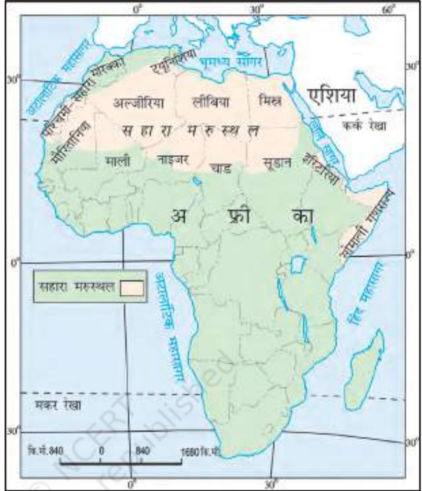
चित्र 9.2 : अफ्रीका महाद्वीप में सहारा

आपको यह जानकर आश्चर्य होगा कि आज का सहारा रेगिस्तान एक समय में पूर्णतया हरा-भरा मैदान था। सहारा की गुफ़ाओं से प्राप्त चित्रों से ज्ञात होता है कि यहाँ नदियाँ तथा मगर पाए जाते थे। हाथी, शेर, जिराफ़, शतुरमुर्ग, भेड़, पशु तथा बकरियाँ सामान्य जानवर थे। परंतु यहाँ के जलवायु परिवर्तन ने इसे बहुत गर्म व शुष्क प्रदेश में बदल दिया है।