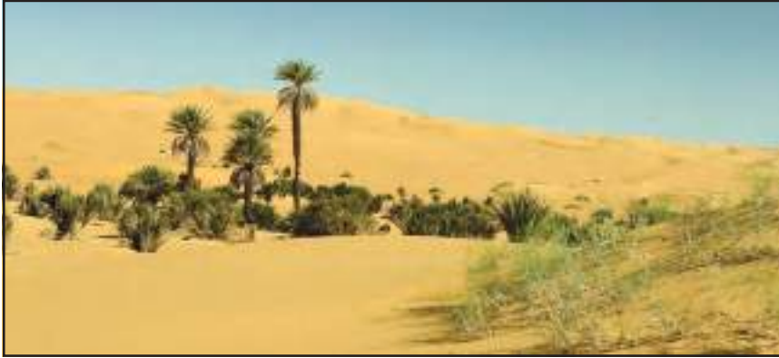
चित्र 9.3 : सहारा रेगिस्तान में मरूद्यान

ऊँट, लकड़बग्घा, सियार, लोमड़ी, बिच्छू, साँपों की विभिन्न जातियाँ एवं छिपकलियाँ यहाँ के प्रमुख जीव-जंतु हैं।