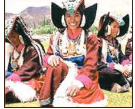
चित्र 9.6 : पारंपरिक वेशभूषा में लद्दाखी महिलाएँ

आधुनिकीकरण के फलस्वरूप यहाँ के जनजीवन में परिवर्तन आ रहा है। लेकिन लद्दाख के लोगों ने शताब्दियों से प्रकृति के साथ समन्वय एवं संतुलन करना सीखा है। जल एवं ईंधन जैसे संसाधनों की कमी के कारण ये आवश्यकतानुसार एवं मितव्ययिता से ही इनका उपयोग करते हैं और कुछ भी व्यर्थ नहीं करते।