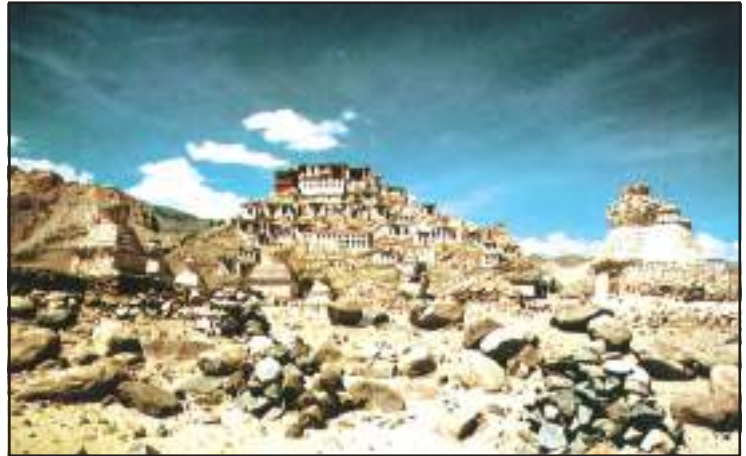
चित्र 9.5 : थिकसे मठ

ग्रीष्म ऋतु में यहाँ के निवासी जौ, आलू, मटर, सेम एवं शलजम की खेती करते हैं। शीत ऋतु में जलवायु इतनी कष्टकारी होती है कि लोग धार्मिक अनुष्ठानों एवं उत्सवों में अपने आपको व्यस्त रखते हैं। यहाँ की महिलाएँ अत्यधिक परिश्रमी होती हैं। वे केवल घर एवं खेतों में ही काम नहीं करती बल्कि छोटे व्यवसाय एवं दुकानें भी संभालती हैं। लद्दाख की राजधानी लेह, सड़क एवं वायुमार्ग द्वारा भलीभाँति जुड़ी हुई है। राष्ट्रीय राजमार्ग-1ए लेह को जोजीला दर्रा होते हुए कश्मीर घाटी से जोड़ता है। क्या आप हिमालय के कुछ अन्य दर्रा के बारे में बता सकते हैं?