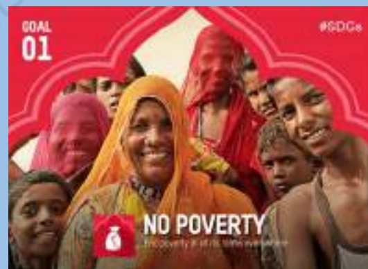
सतत विकास लक्ष्य 1: गरीबी का अंत करना www.in.undp.org

‘मताधिकार की ताकत’ से आप क्या समझते हैं? इस पर आपस में विचार कीजिए।