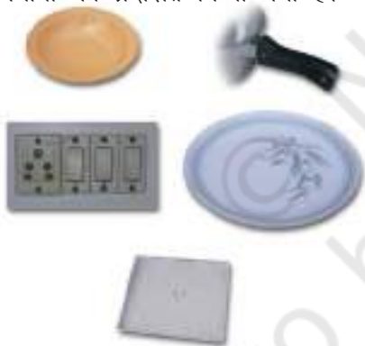
थर्मोसेटिंग प्लास्टिक से निर्मित वस्तुएँ

दूसरी ओर, कुछ प्लास्टिक ऐसे हैं जिन्हें एक बार साँचे में ढाल दिया जाता है तो इन्हें ऊष्मा देकर नर्म नहीं किया जा सकता। ये थर्मोसेटिंग प्लास्टिक कहलाते हैं। दो उदाहरण हैं - बैकेलाइट और मेलामाइन। बैकेलाइट ऊष्मा और विद्युत का कुचालक है। यह बिजली के स्विच, विभिन्न बर्तनों के हत्थे, आदि बनाने में काम आता है। मेलामाइन एक बहुउपयोगी पदार्थ है। यह आग का प्रतिरोधक है तथा अन्य प्लास्टिक की अपेक्षा ऊष्मा को सहने की अधिक क्षमता रखता है। यह फर्श की टाइलें, रसोई के बर्तन और कपड़े बनाने के उपयोग में लिया जाता है जो आग का प्रतिरोध करते हैं। चित्र 3.8 में थर्मोप्लास्टिक और थर्मोसेटिंग प्लास्टिक के विभिन्न उपयोगों को प्रदर्शित किया गया है।