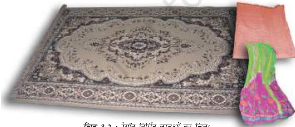
चित्र 3.2 : रेयॉन निर्मित वस्तुओं का चित्र।

आपने कक्षा VII में पढ़ा है कि रेशम कीट से प्राप्त किया जाता है। इसकी खोज चीन में हुई थी और इसे लम्बे समय तक कड़ी सुरक्षा में गोपनीय रखा गया। रेशम रेशे से प्राप्त कपड़ा बहुत मँहगा होता है परन्तु इसकी सुन्दर बुनावट (texture) ने प्रत्येक व्यक्ति को मोह लिया। रेशम को कृत्रिम रूप से बनाने के प्रयास किये गए। उन्नीसवीं शताब्दी के अन्तिम छोर पर वैज्ञानिकों को रेशम समान गुणों वाले रेशे प्राप्त करने में सफलता प्राप्त हुई। इस प्रकार का रेशा काष्ठ लुगदी के रासायनिक उपचार से प्राप्त किया गया। यह रेशा रेयॉन अथवा कृत्रिम रेशम कहलाया। यद्यपि रेयॉन प्राकृतिक स्रोत काष्ठ लुगदी से प्राप्त किया जाता है, यह एक मानव निर्मित रेशा है। यह रेशम से सस्ता होता है परन्तु इसे रेशम रेशों के समान बुना जा सकता है। इसे रंगों की कई किस्मों में रँगा जा सकता है। रेयॉन को कपास के साथ मिलाकर बिस्तर की चादरें बनाते हैं अथवा ऊन के साथ मिलाकर कालीन या गलीचा बनाते हैं। (चित्र 3.2)।