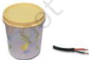
थर्मोप्लास्टिक से निर्मित वस्तुएँ