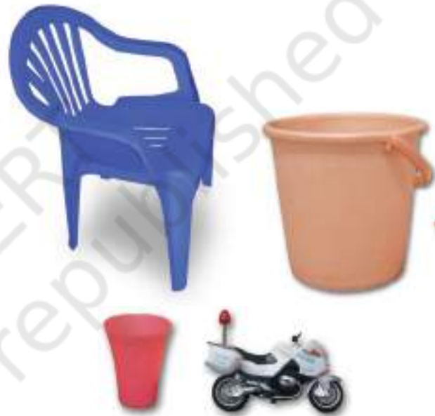
चित्र 3.7 : प्लास्टिक-निर्मित विभिन्न वस्तुएँ

प्लास्टिक की वस्तुएँ सभी सम्भव आकारों और साइजों में उपलब्ध हैं, जैसा आप चित्र 3.7 में देख सकते हैं। क्या आपको आश्चर्य नहीं होता कि यह कैसे संभव है? तथ्य यह है कि प्लास्टिक आसानी से साँचे में ढाला जा सकता है अर्थात् इसे कोई भी आकार दिया जा सकता है। प्लास्टिक का पुनः चक्रण हो सकता है, इसे पुनः प्रयुक्त किया जा सकता है, इसे रँगा और पिघलाया जा सकता है, इसे बेलकर चद्दरों में बदला जा सकता है अथवा इसकी तारें बनायी जा सकती हैं। इसलिए इनके इतने विभिन्न प्रकार के उपयोग हैं।