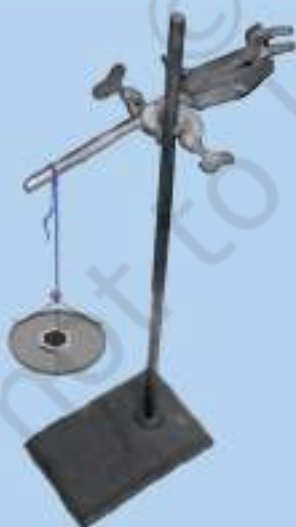
चित्र 3.5 : एक लोहे के स्टैण्ड पर क्लैम्प से लटकता हुआ एक धागा।

एक क्लैम्प युक्त लोहे का स्टैण्ड लीजिए। लगभग 60 सेमी लम्बा एक सूती धागा लीजिए। इसे क्लैम्प से बाँध दीजिए जिससे यह स्वतंत्र रूप से लटक जाए, जैसा चित्र 3.5 में प्रदर्शित है। मुक्त सिरे पर