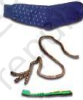
चित्र 3.3 : नाइलॉन से निर्मित विभिन्न वस्तुएँ।

हम नाइलॉन से निर्मित कई वस्तुओं को उपयोग में लाते हैं, जैसे— जुराबें, रस्से, तम्बू, दाँत साफ़ करने का ब्रुश, कारों की सीट के पट्टे, स्लीपिंग बैग (शयन थैला), परदे, आदि (चित्र 3.3)। नाइलॉन का उपयोग पैराशूट