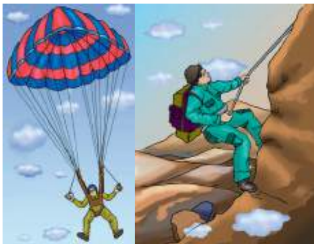
चित्र 3.4 : नाइलॉन रेशों के उपयोग।