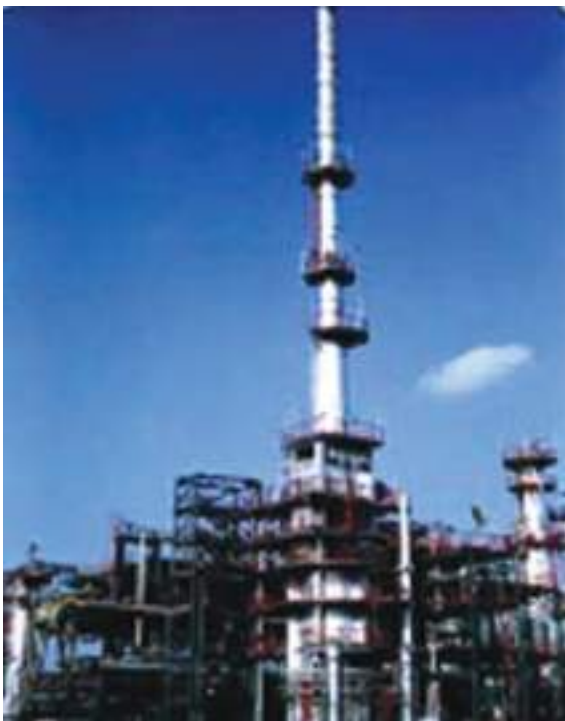
चित्र 5.5 : पेट्रोलियम परिष्करण।

को पृथक करने का प्रक्रम परिष्करण कहलाता है। यह कार्य पेट्रोलियम परिष्करण में सम्पादित किया जाता है (चित्र 5.5)।