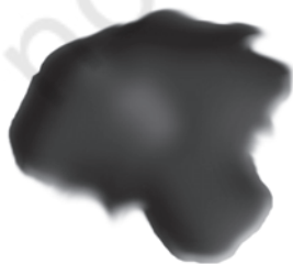
चित्र 5.3 : कोलतार।

यह एक अप्रिय गंध वाला काला गाढ़ा द्रव होता है (चित्र 5.3)। यह लगभग 200 पदार्थों का मिश्रण