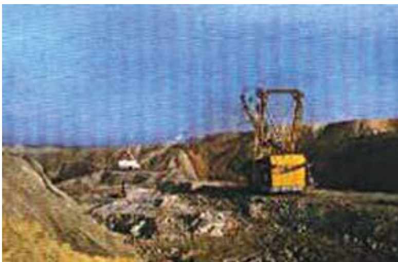
चित्र 5.2 : कोयले की एक खान।

वायु में गर्म करने पर कोयला जलता है और मुख्य रूप से कार्बन डाइऑक्साइड गैस उत्पन्न करता है।