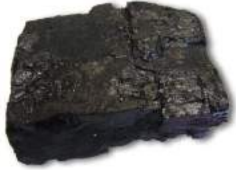
चित्र 5.1 : कोयला।

आपने कोयला देखा होगा या इसके बारे में सुना होगा (चित्र 5.1)। यह पत्थर जैसा कठोर और काले रंग का होता है।