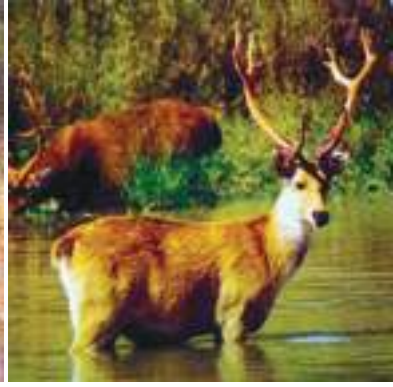
चित्र 7.6 : बारहसिंघा।