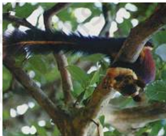
चित्र 7.3(b) : विशाल गिलहरी।