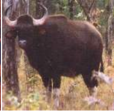
चित्र 7.5 : जंगली भैंसा।