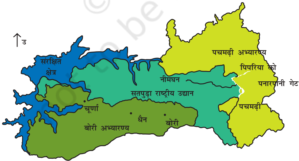
चित्र 7.1 : पचमढ़ी जैवमण्डल आरक्षित क्षेत्र।