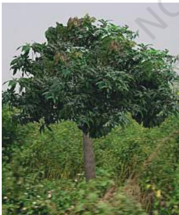
चित्र 7.3(a) : जंगली आम।