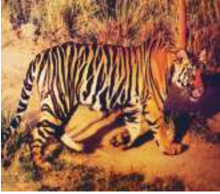
चित्र 7.4 : बाघ।