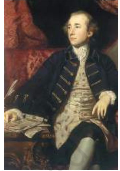
चित्र 3 - वॉरेन हेस्टिंग्स 1773 में भारत के पहले गवर्नर-जनरल बने।

मिल को लगता था कि सारे एशियाई समाज सभ्यता के मामले में यूरोप से पीछे हैं। इतिहास की उनकी समझदारी ये थी कि भारत में अंग्रेजों के आने से पहले यहाँ हिंदू और मुसलमान तानाशाहों का ही राज चलता था। यहाँ चारों ओर केवल धार्मिक बैर, जातिगत बंधनों और अंधविश्वासों का ही बोलबाला