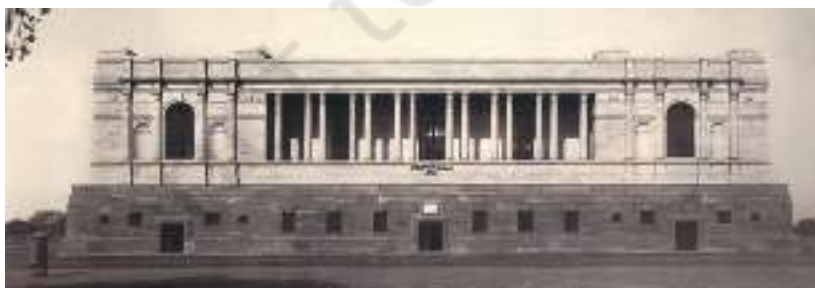
चित्र 4 - भारतीय राष्ट्रीय अभिलेखागार 1920 के दशक में बनाया गया।

उन्हें खुशनवीसी के माहिर लिखते थे। खुशनवीसी या सुलेखनवीस ऐसे लोग होते हैं जो बहुत सुंदर ढंग से चीजें लिखते हैं। उन्नीसवीं सदी के मध्य तक छपाई