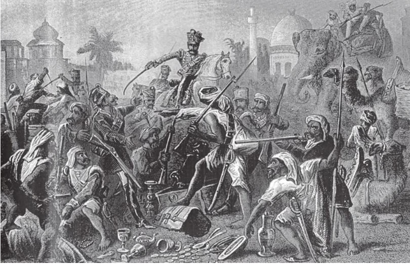
चित्र 7 - 1857 के विद्रोही।

तसवीरों को भी बहुत ध्यान से देखना चाहिए। उनसे हमें चित्रकार की सोच पता चलती है। 1857 के विद्रोह के बाद अंग्रेजों द्वारा तैयार की गई सचित्र पुस्तकों में यह तसवीर कई जगह दिखाई देती है। इस तसवीर के नीचे लिखा होता था : “बागी सिपाही लूट-खसोट में लगे हुए हैं”। अंग्रेजों की नज़र में विद्रोही जनता लालची, दुष्ट और बेरहम थी। इस विद्रोह के बारे में आप अध्याय 5 में पढ़ेंगे।