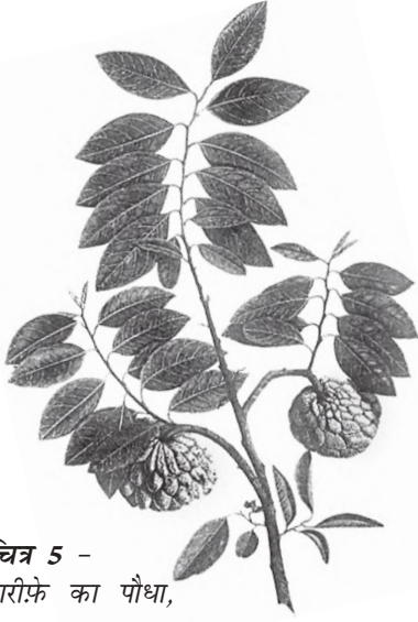
चित्र 5 - शरीफे का पौधा, 1770 का दशक।

अंग्रेजों द्वारा बनाए गए वानस्पतिक उद्यान और प्राकृतिक इतिहास के संग्रहालयों में विभिन्न पौधों के नमूने और उनसे संबंधित जानकारीयों इकट्ठा की जाती थीं। इन नमूनों के चित्र स्थानीय कलाकारों से बनवाए जाते थे। अब इतिहासकार इस बात पर ध्यान दे रहे हैं कि इस तरह की जानकारी किस तरह इकट्ठा की जाती थी और इससे उपनिवेशवाद के बारे में क्या पता चलता है।