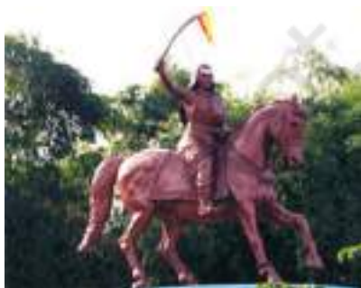
चित्र 12 - किट्टूर रानी चेन्नमा की स्मृति में बनाई गई मूर्ति।