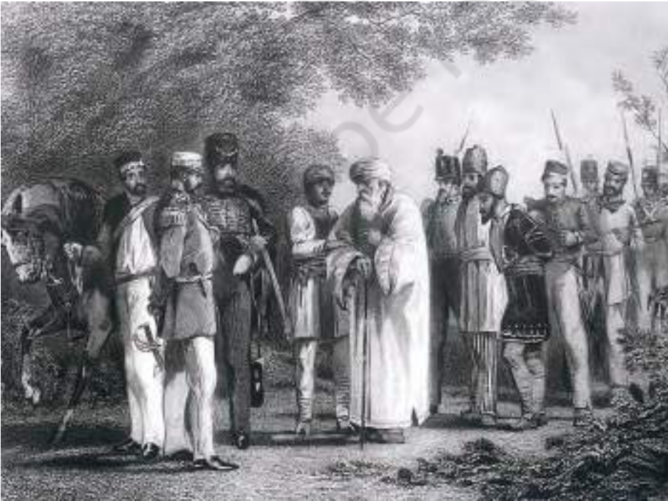
चित्र 1 - कैप्टन हडसन द्वारा बहादुर शाह ज़फ़र और उनके बेटों की गिरफ्तारी।

अठारहवीं सदी के उत्तरार्ध तक राजनीतिक क्षितिज पर अंग्रेजों के रूप में एक नयी ताकत उभरने लगी थी। क्या आप जानते हैं कि अंग्रेज पहले-पहल एक छोटी-सी व्यापारिक कंपनी के रूप में भारत आए थे और यहाँ के इलाकों पर कब्जे में उनकी ज़्यादा दिलचस्पी नहीं थी? तो फिर ऐसा कैसे हुआ कि एक दिन वे इस विशाल साम्राज्य के स्वामी बन बैठे? इस अध्याय में आप देखेंगे कि यह कैसे हुआ?