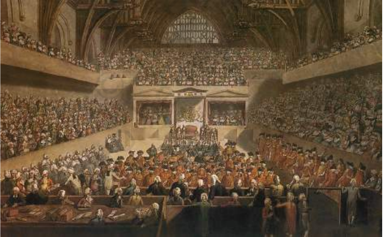
चित्र 12 - वॉरेन हेस्टिंग्स पर मुकदमा, आर.जी. पॉलार्ड द्वारा चित्रित, 1789.

महाभियोग - जब इंग्लैंड के हाउस ऑफ कॉमंस में किसी व्यक्ति के ख़िलाफ़ दुराचरण का आरोप लगाया जाता है तो हाउस ऑफ़ लॉर्ड्स (संसद का ऊपरी सदन) में उस व्यक्ति के ख़िलाफ़ मुकदमा चलता है। इसे महाभियोग कहा जाता है।