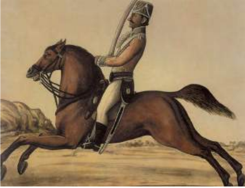
चित्र 13 - कंपनी के लिए काम करने वाला बंगाल का एक सवार, एक अज्ञात भारतीय चित्रकार द्वारा बनाया गया चित्र, 1780.

मराठों और मैसूर के साथ हुए युद्धों के बाद कंपनी को अपनी घुड़सवार टुकड़ियों को मजबूत करने की अहमियत समझ में आने लगी थी।