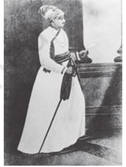
चित्र 6 - सिराजुद्दौला

ईस्ट इंडिया कंपनी के कोर्ट ऑफ प्रॉपराइटर्स की लंदन स्थित लेडनहॉल स्ट्रीट पर बने ईस्ट इंडिया हाउस में बैठकें होती थीं। यह ऐसी ही एक सभा का चित्र है।