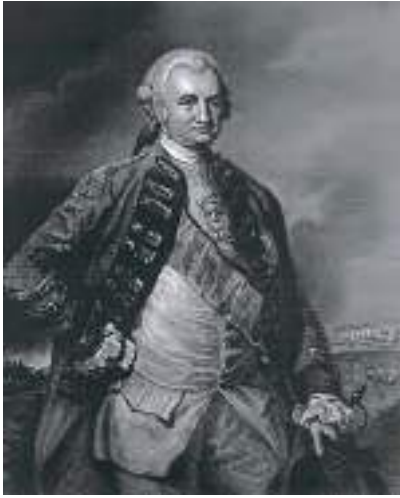
चित्र 4 - रॉबर्ट क्लाइव।

कठपुतली - यह एक खिलौना होता है जिसे आप धागों के सहारे अपने हिसाब से नचाते हैं। जो व्यक्ति किसी और के इशारों पर चलता है उसे भी मजाक उड़ाने के लिए अकसर कठपुतली कहा जाता है।