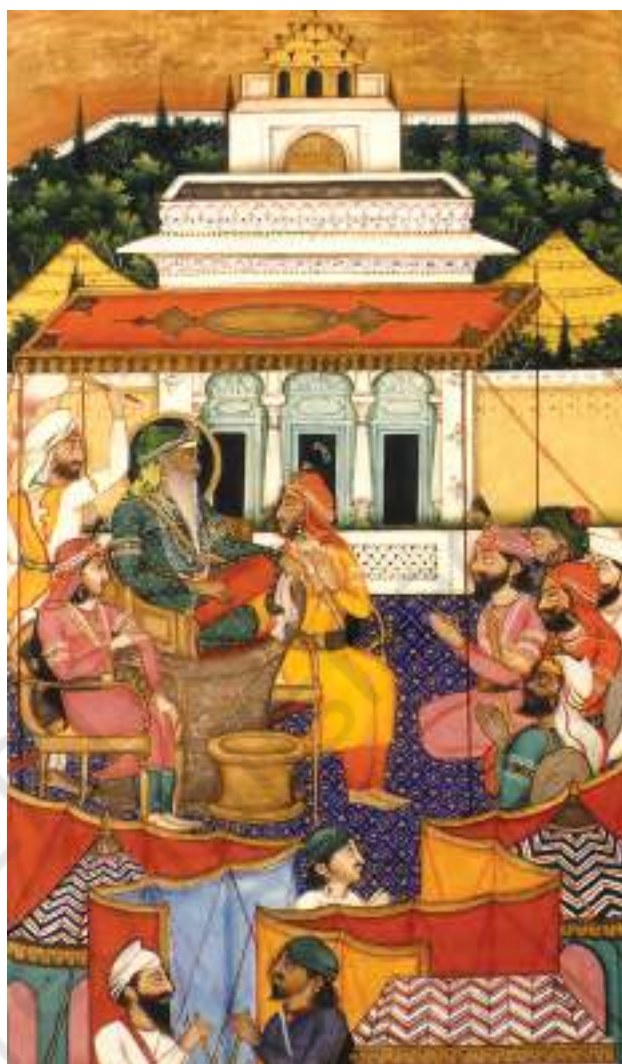
चित्र 13 - महाराजा रणजीत सिंह का दरबार।

कल्पना कीजिए कि आप नवाब के भतीजे हैं। आपको बचपन से ही यह एहसास कराया गया है कि एक दिन आप राजगद्दी सँभालेंगे। अब आपको पता चलता है कि विलय नीति के कारण अंग्रेज आपको राजा नहीं बनने देंगे। आपको कैसा लगेगा? राजगद्दी पाने के लिए आप क्या करेंगे?