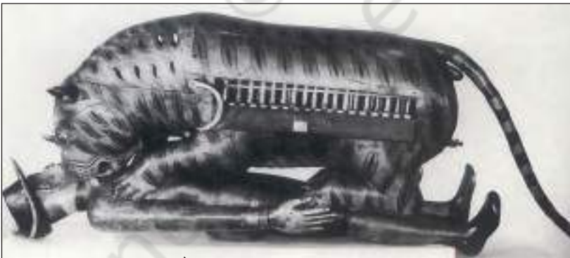
चित्र 10 - टीपू का खिलौना शेर।

राजाओं की छवि अकसर जनश्रुतियों से भी बनती है। प्रचलित किस्सों में उनकी ताकत का खूब यशगान किया जाता है। 1782 में मैसूर के राजा बने टीपू सुल्तान के बारे में कहा जाता है कि एक बार वे अपने फ्रांसीसी दोस्त के साथ जंगल में शिकार खेलने गए थे। वहाँ एक शेर उनके सामने आ गया। उनकी बंदूक ने मौके पर साथ नहीं दिया और कटार भी ज़मीन पर गिर गई। फिर भी टीपू ने निहत्थे ही शेर का मुकाबला किया और आखिरकार कटार उठा ली। अंत में उन्होंने शेर को मार गिराया। इसी के बाद से उन्हें “शेर-ए-मैसूर” कहा जाने लगा था। उनके राजसी झंडे पर भी शेर की तसवीर होती थी।