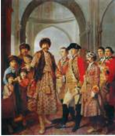
चित्र 7 - अपने बेटों और ब्रिटिश रेजिडेन्ट के साथ खड़े नवाब शुजाउद्दौला, टिली कैटल द्वारा बनाया चित्र (तैल, 1772)।

बक्सर की लड़ाई के बाद हुई संधियों के फलस्वरूप नवाब शुजाउद्दौला के ज़्यादातर अधिकार छिन गए थे लेकिन यहाँ वह रेजिडेन्ट के सामने अपनी चिर-परिचित शाही शानो-शौकत के साथ दिखाई दे रहे हैं।