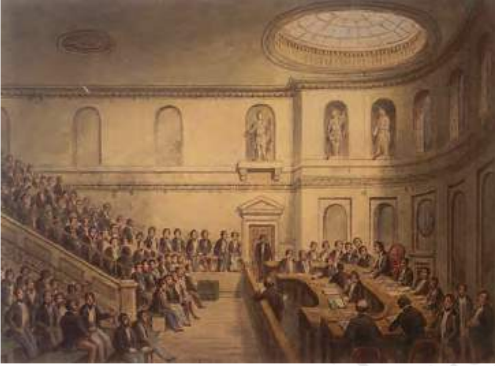
चित्र 5 - महान्यायालय कक्ष, ईस्ट इंडिया हाउस, लेडनहॉल स्ट्रीट।

ईस्ट इंडिया कंपनी के कोर्ट ऑफ प्रॉपराइटर्स की लंदन स्थित लेडनहॉल स्ट्रीट पर बने ईस्ट इंडिया हाउस में बैठकें होती थीं। यह ऐसी ही एक सभा का चित्र है।