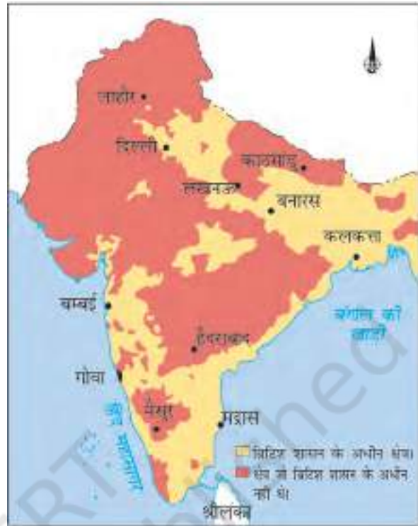
चित्र 11 (b) भारत, 1840