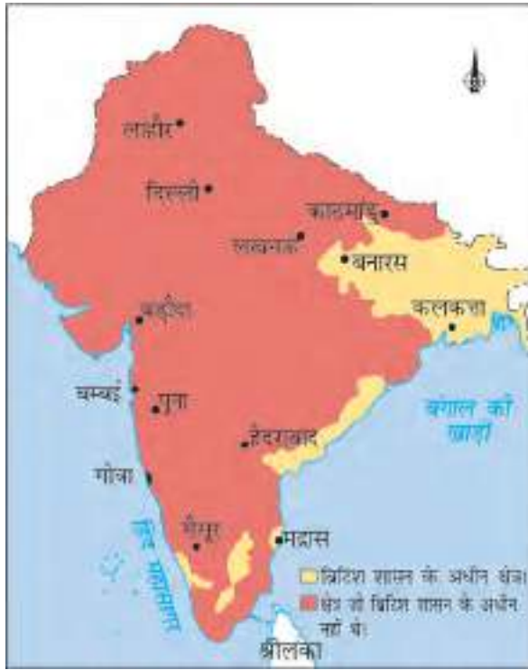
चित्र 11 (a) भारत, 1797