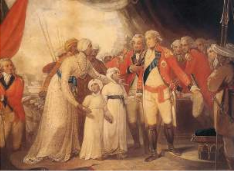
चित्र 9 - टीपू सुल्तान के बेटों को बंधक के रूप में कॉर्नवालिस के सामने पेश किया जा रहा है। डेनियल ऑर्म द्वारा चित्रित, 1793.

कंपनी की फौजों को हैदर अली और टीपू सुल्तान ने कई बार युद्ध में हराया था। लेकिन 1792 में मराठों, हैदराबाद के निजाम और कंपनी की संयुक्त फौजों के हमले के बाद टीपू सुल्तान को अंग्रेजों से संधि करनी पड़ी। इस संधि के तहत उनके दो बेटों को अंग्रेजों ने बंधक के रूप में अपने पास रख लिया। ब्रिटिश चित्रकारों को ऐसे दृश्यों की तसवीर बनाने में मजा आता था जिनमें अंग्रेजों की सत्ता की विजय दिखाई देती थी।