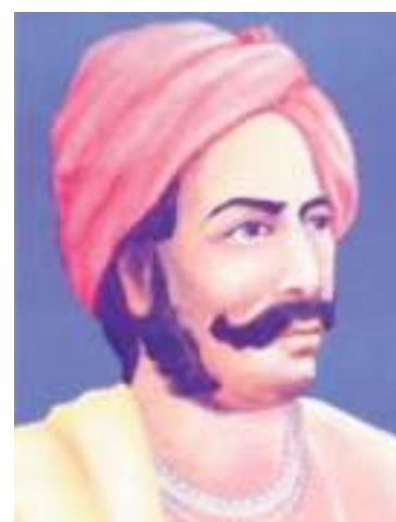
चित्र 14 - संबलपुर के वीर सुरेन्द्र साय का चित्र।