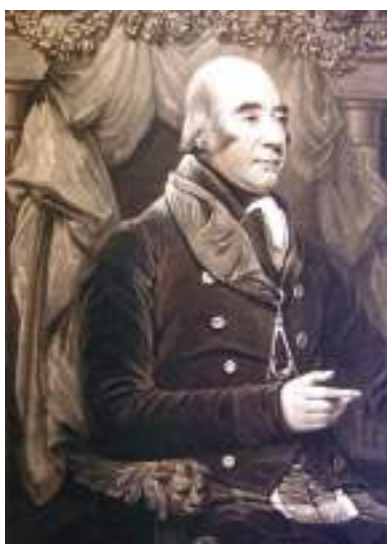
चित्र 11 - लॉर्ड हेस्टिंग्स