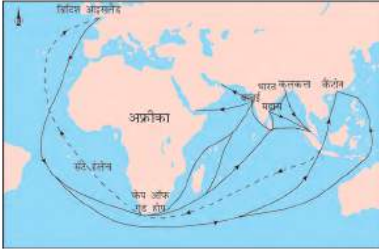
चित्र 2 - अठारहवीं सदी में भारत तक आने वाले रास्ते।

वाणिज्यिक - एक ऐसा व्यावसायिक उद्यम जिसमें चीजों को सस्ती कीमत पर खरीद कर और ज़्यादा कीमत पर बेचकर यानी मुख्य रूप से व्यापार के ज़रिए मुनाफा कमाया जाता है।