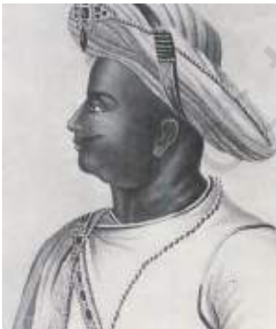
चित्र 8 - टीपू सुल्तान।