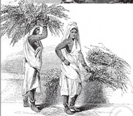
चित्र 11 - नील के पौधों को हौद तक औरतें ही ढोकर लाती थीं।