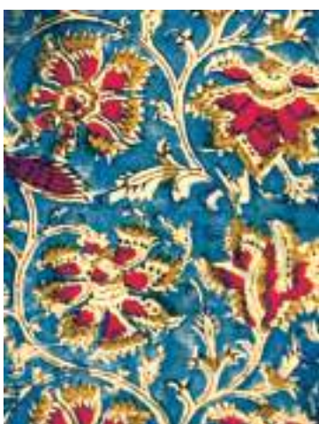
चित्र 5 - एक कलमकारी छापा, बीसवीं सदी, भारत।

यह कैसे किया गया? अंग्रेजों ने अपनी ज़रूरत की फ़सलों की खेती को फैलाने के लिए कई तरीके अपनाए। आइए इसी तरह की एक फ़सल, उत्पादन की ऐसी ही एक पद्धति को अच्छी तरह समझें।