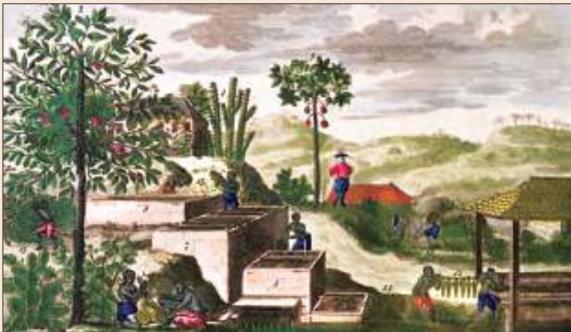
चित्र 14 - कैरिबियाई द्वीप समूह स्थित बाग़ानों में नील का उत्पादन।

अठारहवीं सदी की शुरुआत में एक फ़्रांसीसी मिशनरी जौं बेपतिस्त लबात ने कैरिबियाई द्वीपों का दौरा किया और इस इलाके के बारे में विस्तार से लिखा। यह तसवीर लबात की एक पुस्तक से ली गई है। इस तसवीर में यहाँ के फ़्रांसीसी बाग़ानों में नील उत्पादन के सारे चरणों को दर्शाया गया है। बाएँ सिरे पर आप देख सकते हैं कि गुलाम मज़दूर नील के पौधों को सेटलर वाट में डाल रहे हैं। एक और मज़दूर एक मशीनी चरखी से घोल को घुमा रहा है (दाएँ से दूसरा)। दो मज़दूर नील की लुगदी को बोरों में भरकर सुखाने के लिए ले जा रहे हैं। अगले हिस्से में दो मज़दूर नील की लुगदी को मिलाकर साँचों में डालने के लिए तैयार कर रहे हैं। तसवीर के बीचोंबीच बाग़ान मालिक ऊँची जगह खड़े होकर सारे गुलामों पर नज़र रख रहा है।