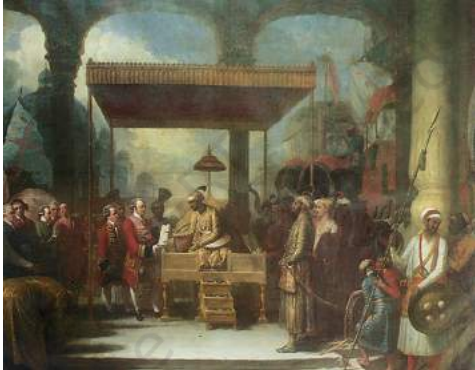
चित्र 1 - 1765 में रॉबर्ट क्लाइव मुगल बादशाह से बिहार और उड़ीसा की दीवानी ग्रहण करते हुए