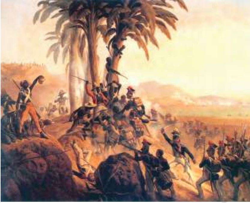
चित्र 7 - सेंट डॉमिंग्यू में गुलामों की बगावत, अगस्त 1791, जनवरी स्कुहदोल्स्की का चित्र।

अठारवीं सदी में फ्रांसीसी बागान मालिकों ने कैरीबियाई द्वीप समूह में स्थित फ्रांसीसी उपनिवेश सेंट डॉमिंग्यू में नील और चीनी का उत्पादन शुरू किया। इन बागानों में काम करने वाले अफ्रीकी गुलाम 1791 में बगावत पर उतर आए। उन्होंने बागान जला दिए और अपने धनी मालिकों को मार डाला। 1792 में फ्रांस ने अपने उपनिवेशों में दास प्रथा समाप्त कर दी। इन घटनाओं की वजह से कैरीबियाई द्वीपों में नील की खेती ठप्प हो गई।