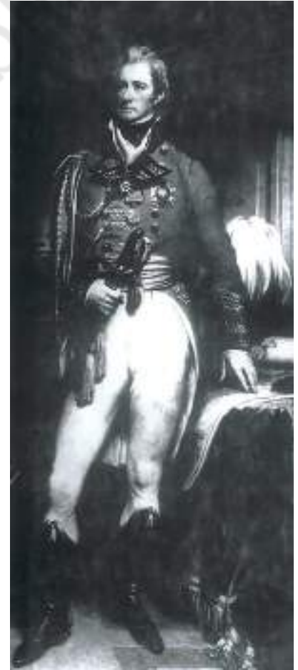
चित्र 4 - मद्रास का गवर्नर टॉमस मुनरो (1819-26)।

महाल - ब्रिटिश राजस्व दस्तावेजों में महाल एक राजस्व इकाई थी। यह एक गाँव या गाँवों का एक समूह होती थी।