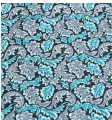
चित्र 6 - मॉरिस कॉटन छापा, उन्नीसवीं सदी का उत्तरार्ध, इंग्लैंड।