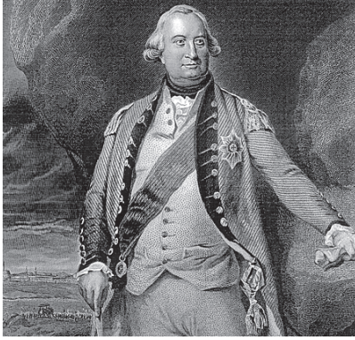
चित्र 3 - चार्ल्स कॉर्नवालिस।

जिस समय स्थायी बंदोबस्त लागू किया गया उस समय कॉर्नवालिस भारत का गवर्नर-जनरल था।