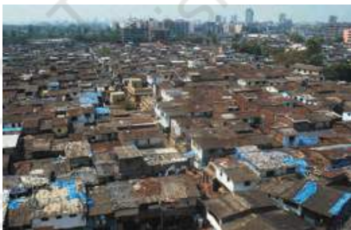
चित्र 11 - बम्बई स्थित धारावी दुनिया की सबसे बड़ी झुग्गी बस्तियों में से एक है। इसके दूर वाले सिरे पर आप गगनचुंबी इमारतें देख सकते हैं।

हमारा संविधान कानून की नज़र में सबको बराबर मानता है लेकिन असली जिंदगी में कुछ भारतीय औरों के मुकाबले ज्यादा बराबर हैं। स्वतंत्रता के समय तय की गई कसौटियों के हिसाब से देखें तो भारतीय गणतंत्र बहुत बड़ी सफलता का दावा नहीं कर सकता। लेकिन यह भी सच है कि वह विफल नहीं हुआ है।