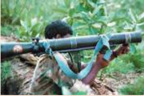
चि 12 - बंदूक लिए हुए तमिल उग्रवादी-श्रीलंका में गृहयुद्ध का प्रतीक।

1956 में, जिस समय भारत में भाषा के आधार पर राज्यों का पुनर्गठन किया जा रहा था, उसी समय श्रीलंका (तत्कालीन नाम सीलोन) की संसद ने एक कानून पारित करके सिंहला भाषा को देश की राजभाषा का दर्जा दे दिया। इस कानून के जरिए सिंहला भाषा को सभी सरकारी स्कूल-कॉलेजों, सरकारी परीक्षाओं और अदालतों की भाषा बना दिया गया। श्रीलंका के उत्तर में रहने वाले तमिलभाषी अल्पसंख्यकों ने इस नए कानून का विरोध किया। एक तमिल सांसद ने कहा कि “जब आप मुझसे मेरी भाषा छीन लेते हैं तो आप मेरा सब कुछ मुझसे छीन लेते हैं।” एक और नेता ने चेतावनी दी, “आप सीलोन को बाँटना चाहते हैं। निश्चित रहिए। मैं आश्वासन देता हूँ कि (आपको) एक विभाजित सीलोन ही मिलेगा।” सिंहला भाषी एक विपक्षी सदस्य ने कहा था कि अगर सरकार अपना रुख नहीं बदलती है और इस कानून पर अड़ी रहती है तो “इस छोटे से देश में से दो टूटे-फूटे रक्तरंजित देश भी पैदा हो सकते हैं।”