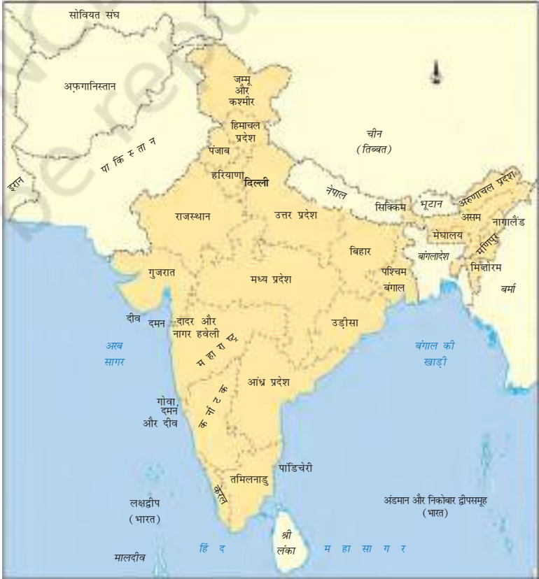
चित्र 5 (ग) - 1975 में भारतीय राज्य।

▶ गतिविधि चित्र 5 (क), 5 (ख) और 5 (ग) को देखें। ध्यान दें कि चित्र 5 (ख) में रियासतें दिखाई नहीं दे रही हैं। उन राज्यों को पहचानें जिनका 1956 और बाद में गठन किया गया था। उन राज्यों की कौन सी भाषाएँ थीं?