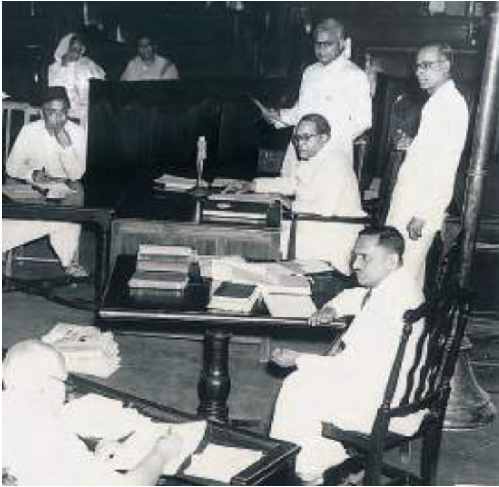
चित्र 3 - डॉ. बी.आर. अंबेडकर।

डॉ. बी.आर. अंबेडकर (1891-1956) को प्यार से लोग बाबासाहेब के नाम से पुकारते थे। वह एक मराठी भाषी दलित परिवार से थे। डॉ. अंबेडकर एक जाने-माने वकील और अर्थशास्त्री थे। उन्हें दलितों का एक महान नेता और भारतीय संविधान का जनक माना जाता है।