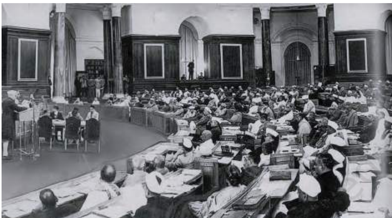
चित्र 2 - संविधान के उद्देश्यों पर रोशनी डालने वाले प्रस्ताव को पढ़ते हुए जवाहरलाल नेहरू।

ही दिया गया था। वहाँ सबसे पहले संपन्न पुरुषों को वोट देने का अधिकार मिला। इसके बाद शिक्षित पुरुषों को भी मताधिकार दिया गया। मजदूर पुरुषों को काफी लंबे संघर्ष के बाद यह अधिकार मिला। महिलाओं को सबसे अंत में मताधिकार दिया गया – वह भी लंबे जुझारू संघर्ष के बाद। इसके विपरीत, भारत में आज़ादी के कुछ ही समय बाद ये फैसला ले लिया गया था कि देश के सभी स्त्री-पुरुषों को यह अधिकार दिया जाएगा भले ही वे अमीर हों या गरीब, पढ़े-लिखे हों या अनपढ़ हों।