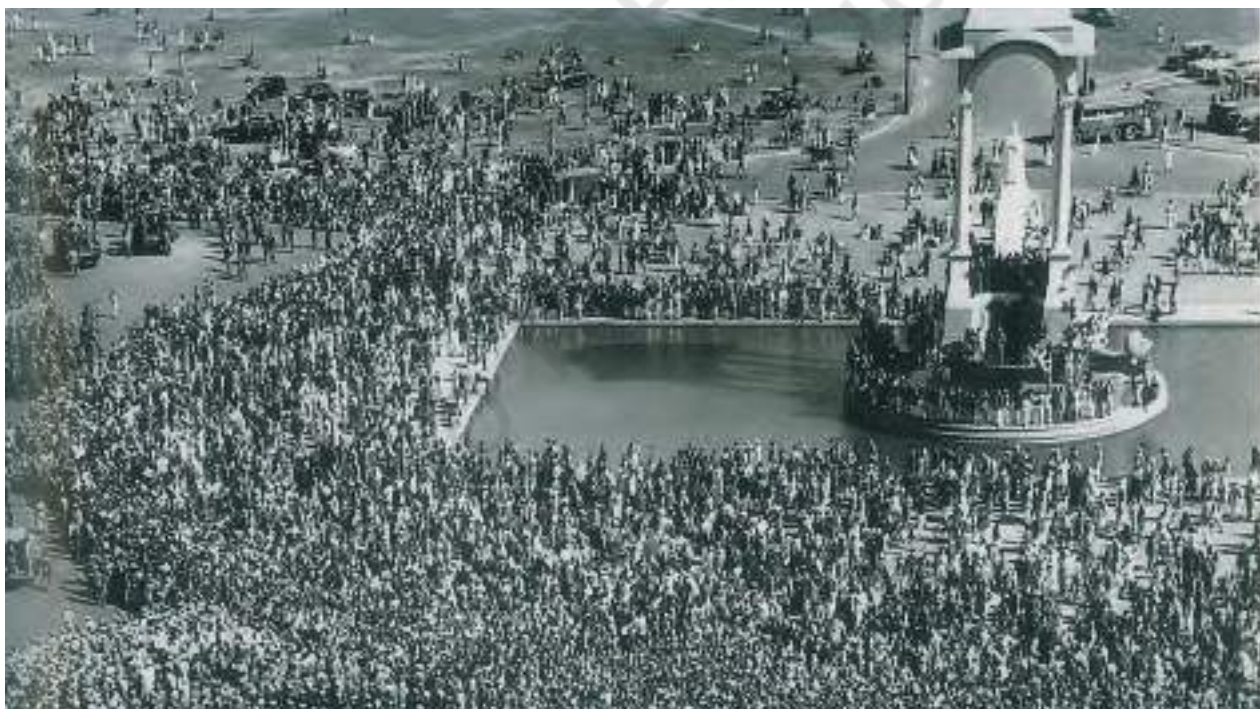
चित्र 1 - इलाहाबाद में महात्मा गांधी की अस्थियों का विर्सजन, फरवरी 1948

अगस्त 1947 में जब भारत आजाद हुआ तो उसके सामने कई बड़ी चुनौतियाँ थीं। बँटवारे की वजह से 80 लाख शरणार्थी पाकिस्तान से भारत आ गए थे। इन लोगों के लिए रहने का इंतजाम करना और उन्हें रोजगार देना ज़रूरी था। इसके बाद रियासतों की समस्या थी। तकरीबन 500 रियासतें राजाओं या नवाबों के शासन में चल रही थीं। इन सभी को नए राष्ट्र में शामिल होने के लिए तैयार करना एक टेढ़ा काम था। शरणार्थियों और रियासतों की समस्या पर फौरन ध्यान देना लाज़िमी था। लंबे दौर में इस नवजात राष्ट्र को एक ऐसी राजनीतिक व्यवस्था भी विकसित करनी थी जो यहाँ के लोगों की आशाओं और आकांक्षाओं को सबसे अच्छी तरह व्यक्त कर सके।