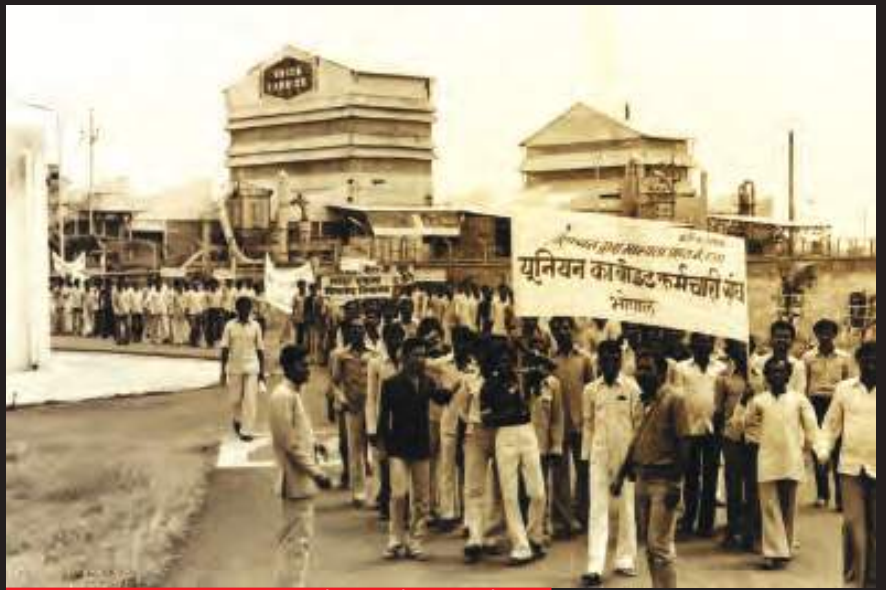
यूनियन कार्बाइड कर्मचारी यूनियन के सदस्यों का आंदोलन

यह तबाही कोई दुर्घटना नहीं थी। यूनियन कार्बाइड ने पैसा बचाने के लिए सुरक्षा उपायों को जानबूझकर नज़रअंदाज़ किया था। 2 दिसंबर की त्रासदी से बहुत पहले भी कारखाने में गैस का रिसाव हो चुका था। इन घटनाओं में एक मजदूर की मौत हुई थी जबकि बहुत सारे घायल हुए थे।