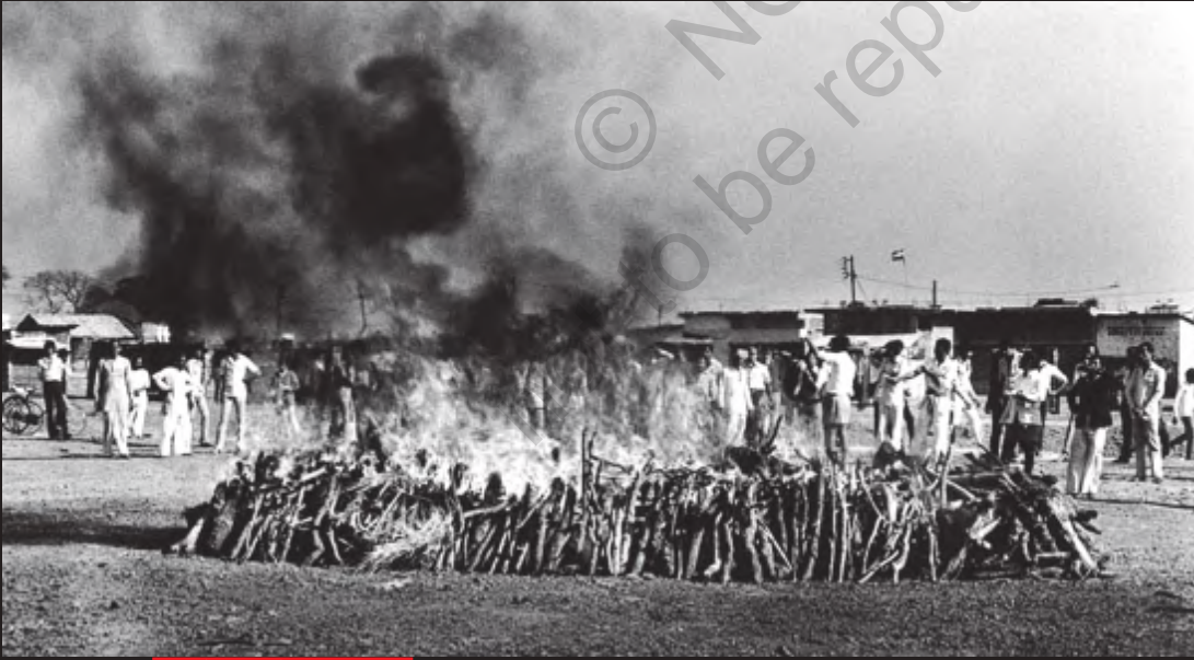
सामूहिक अंतिम संस्कार

जहरीली गैस के संपर्क में आने वाले ज्यादातर लोग गरीब कामकाजी परिवारों के लोग थे। उनमें से लगभग 50,000 लोग आज भी इतने बीमार हैं कि कुछ काम नहीं कर सकते। जो लोग इस गैस के असर में आने के बावजूद जिंदा रह गए उनमें से बहुत सारे लोग गंभीर श्वास विकारों, आँख की बीमारियों और अन्य समस्याओं से पीड़ित हैं। बच्चों में अजीबो-गरीब विकृतियाँ पैदा हो रही हैं। इस चित्र में दिखाई दे रही लड़की इस बात का उदाहरण है।