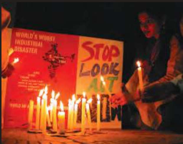
इंसाफ़ की लड़ाई अभी जारी है...।

24 साल बाद भी लोग न्याय के लिए संघर्ष कर रहे हैं। वे पीने के साफ़ पानी, स्वास्थ्य सुविधाओं और यूनियन कार्बाइड के जहर से ग्रस्त लोगों के लिए नौकरियों की माँग कर रहे हैं। उन्होंने यूनियन कार्बाइड के चेयरमैन एंडरसन को सज़ा दिलाने के लिए भी आंदोलन चलाया है।