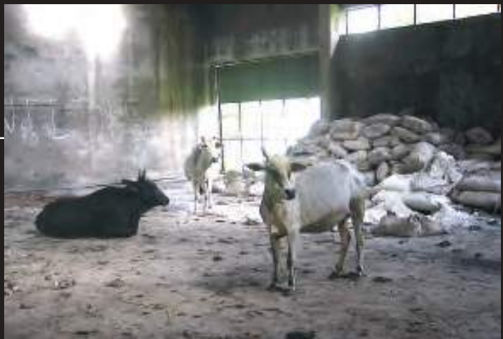
यूनियन कार्बाइड संयंत्र के इर्द-गिर्द बिखरे पड़े रसायनों के बोरे

यूनियन कार्बाइड ने कारखाना तो बंद कर दिया, लेकिन भारी मात्रा में विषैले रसायन वहीं छोड़ दिए। ये रसायन रिस-रिस कर ज़मीन में जा रहे हैं जिससे वहाँ का पानी दूषित हो रहा है। अब यह संयंत्र डाओ कैमिकल नामक कंपनी के कब्जे में है जो इसकी साफ़-सफ़ाई का जिम्मा उठाने को तैयार नहीं है।