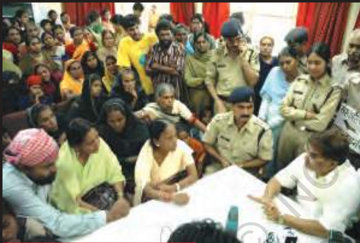
गैस राहत मंत्री से बात करते गैस पीड़ित।

सबूतों से पूरी तरह साफ़ था कि इस महाविनाश के लिए यूनियन कार्बाइड ही दोषी है, लेकिन कंपनी ने अपनी गलती मानने से इनकार कर दिया।