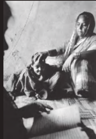
गैस से बुरी तरह प्रभावित एक बच्चा

तीन दिन के भीतर 8,000 से ज्यादा लोग मौत के मुँह में चले गए। लाखों लोग गंभीर रूप से प्रभावित हुए।