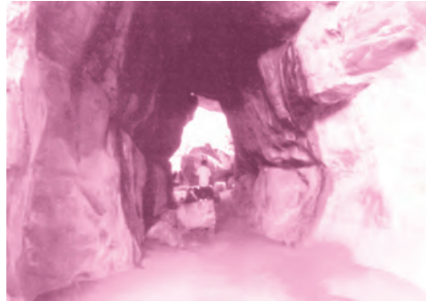
भीमबेटका की गुफा के चित्र