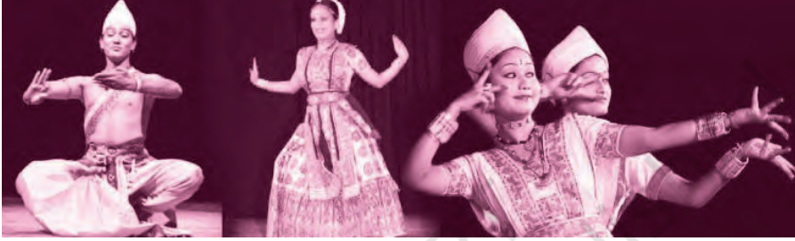
असम का सत्रिय नृत्य

मैसूर में डोडवा कबीले के लोग बालाकल नृत्य करते हैं। इसमें रंगीन वेशभूषा के साथ-साथ हाथ में तलवारें होती हैं। केरल के कुरुवांजी नृत्य को भरतनाट्यम का प्रेरणा स्रोत माना जाता है। गुजरात का टिप्पणी नृत्य भी समूह के साथ होता है। यह फसल की कटाई के बाद खलिहान में किया जाता है।