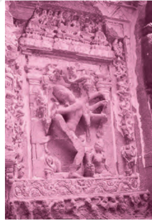
एलोरा की गुफ़ाओं में कैलाश मंदिर का चित्र