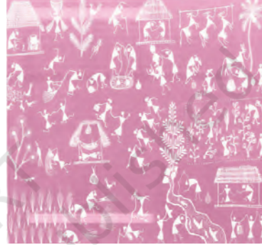
महाराष्ट्र की वरली शैली में बने चित्र

चौथी से छठी सदी के बीच गुप्त साम्राज्य कलाओं के लिए स्वर्ण युग कहलाता है। अजंता की गुफ़ाएँ उन्हीं दिनों खोदी गयीं। उनकी दीवारों पर चित्र बनाए गए। बाग और बादामी की गुफ़ाएँ भी