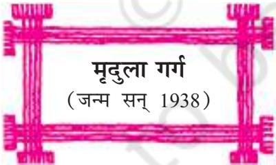
मृदुला गर्ग (जन्म सन् 1938)

प्रमुख कृतियाँ— मैला आँचल , परती परिकथा , कितने चौराहे (उपन्यास); ठुमरी , आदिम रात्रि की महक , अगिनखोर (कहानी-संग्रह); ऋणजल-धनजल , नेपाली क्रांति कथा (रिपोर्टाज)।