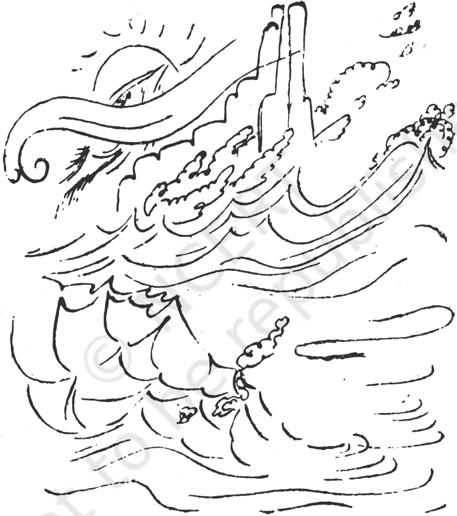
शमशेर की एक कलाकृति