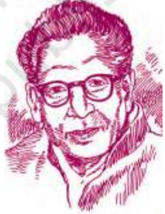
हरिवंश राय बच्चन

इलाहाबाद मुझे बच्चन ही खींचकर ला सकते थे। कोई इस संभावना की कल्पना भी नहीं कर सकता था। मैं स्वयं नहीं। और उस पर मैं बच्चन को तब जानता भी कितना था! बराय नाम 3 । मगर उस परिचय के जितने भी क्षण थे सटीक थे। थे वो मात्र क्षण ही। आजकल की तरह ही, मैं बहुत कम कहीं आता-जाता या किसी से मिलता-जुलता था।