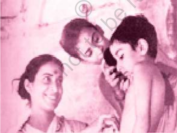
पथेर पांचाली फ़िल्म का एक दृश्य

शूटिंग की शुरुआत में ही एक गड़बड़ हो गई। अपू और दुर्गा को लेकर हम कलकत्ता* से सत्तर मील पर पालसिट नाम के एक गाँव गए। वहाँ रेल-लाइन के पास