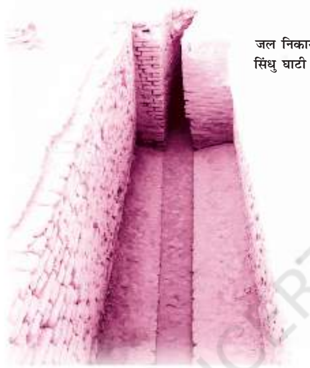
जल निकासी का उन्नत प्रबंध जो सिंधु घाटी की अनूठी विशेषता है