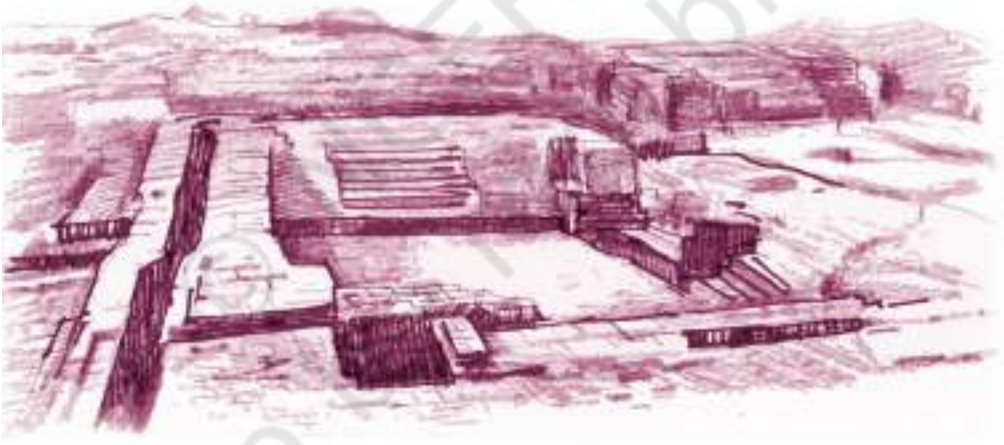
मुअनजो-दड़ो का प्रसिद्ध जल कुंड

हम पहले स्तूप के टीले से महाकुंड के विहार की दिशा में उतरे। दाईं तरफ़ एक लंबी गली दीखती है। इसके आगे महाकुंड है। पता नहीं सायास है या संयोग कि धरोहर के प्रबंधकों ने उस गली का नाम दैव मार्ग (डिविनिटि स्ट्रीट) रखा है। माना जाता है कि उस सभ्यता में सामूहिक स्नान किसी अनुष्ठान का अंग होता था। कुंड करीब चालीस फुट लंबा और पच्चीस फुट चौड़ा है। गहराई सात फुट। कुंड में उत्तर और दक्षिण से सीढ़ियाँ उतरती हैं। इसके तीन तरफ़ साधुओं के कक्ष बने हुए हैं। उत्तर में दो पाँत में आठ स्नानघर हैं। इनमें किसी का द्वार दूसरे के सामने नहीं खुलता। सिद्ध वास्तुकला का यह भी एक नमूना है।