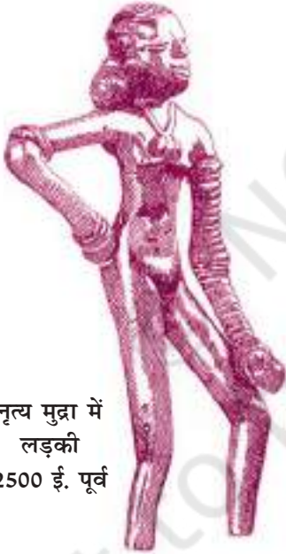
नृत्य मुद्रा में लड़की 2500 ई. पूर्व

मुअनजो-दड़ो सिंधु सभ्यता का सबसे बड़ा शहर ही नहीं था, उसे साधनों और व्यवस्थाओं को देखते हुए सबसे समृद्ध भी माना गया है। फिर भी इसकी संपन्नता की बात कम हुई है तो शायद इसलिए कि उसमें भव्यता का आडंबर नहीं है। दूसरी वजह यह भी है कि मुअनजो-दड़ो और हड़प्पा पिछली सदी में ही उद्घाटित हो सके। उनकी अनबूझ लिपि अभी भी सारे रहस्य अपने में छिपाए हुए है।