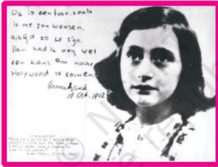
ऐन फ्रैंक की डायरी का एक पन्ना

मेरी प्यारी किट्टी, अब मैं तुम्हें कितना उलझा रही हूँ। लेकिन मैं चीज़ें एक बार लिखकर उन्हें काटना पसंद नहीं करती