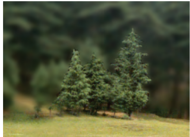
चित्र 6.6 पर्वतीय आवास के कुछ वृक्ष

पर्वतीय क्षेत्रों में पौधों एवं जंतुओं की अनेक प्रजातियाँ पाई जाती हैं। क्या आपने चित्र 6.6 में दर्शाए गए वृक्ष देखे हैं?