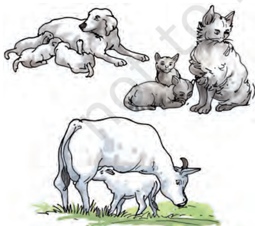
चित्र 6.14 बच्चे देने वाले कुछ जंतु

जंतु प्रजनन द्वारा अपने समान संतान उत्पन्न करते हैं। भिन्न जंतुओं में प्रजनन का ढंग अलग-अलग होता है। कुछ जंतु अंडे देते हैं जिनसे शिशु निकलते हैं। कुछ जंतु शिशु को जन्म देते हैं (चित्र 6.14)।