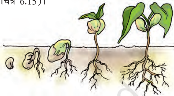
चित्र 6.15 एक पौधे का बीज अंकुरित होकर नया पौधा बनता है

पौधे भी प्रजनन करते हैं? जंतुओं की तरह पौधों में भी प्रजनन के तरीके भिन्न-भिन्न हैं। बहुत-से पौधे बीजों द्वारा प्रजनन करते हैं। पौधे बीज उत्पादित करते हैं। हम उन्हें अंकुरित करके नए पौधे उगा सकते हैं (चित्र 6.15)।