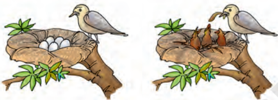
चित्र 6.13 (a) पक्षी अंडे देते हैं (b) जिनके स्फुटन द्वारा नवजात उत्पन्न होते हैं

क्या आपने कभी कबूतर अथवा किसी पक्षी के नीड़ (घोंसले) देखे हैं? वे नीड़ में अंडे देते हैं। कुछ अंडे प्रस्फुटित होते हैं तथा उनसे छोटे-छोटे बच्चे बाहर निकल आते हैं (चित्र 6.13)।