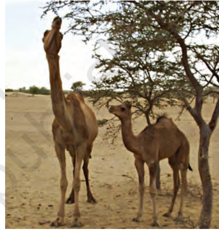
चित्र 6.2 ऊँट एवं उनका परिवेश

मरुस्थल में जल बहुत कम मात्रा में उपलब्ध होता है। मरुस्थल दिन में बहुत गरम एवं रात में ठंडा होता है। मरुस्थल में पाए जाने वाले पौधे एवं जंतु भूमि पर रहते हैं एवं श्वसन के लिए आस-पास की वायु का उपयोग करते हैं।