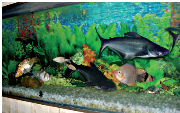
चित्र 6.3 विभिन्न प्रकार की मछलियाँ

में रहने योग्य बनाती है। ऊँट के पैर लंबे होते हैं जिससे उसका शरीर रेत की गरमी से दूर रहता है (चित्र 6.2)। उनमें मूत्रोत्सर्जन की मात्रा बहुत कम होती है तथा मल शुष्क होता है। उन्हें पसीना (स्वेद) भी नहीं आता क्योंकि शरीर से जल का हास बहुत कम होता है। इसलिए जल के बिना भी वे अनेक दिनों तक रह सकते हैं।