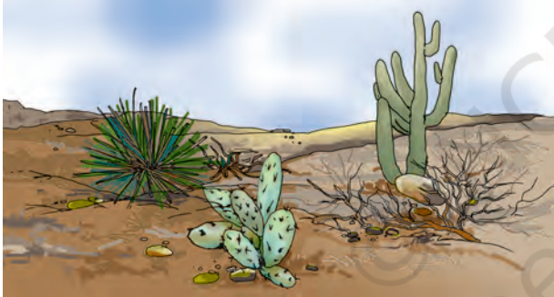
चित्र 6.5 मरुस्थल में उगने वाले कुछ पौधे

मरुस्थल में रहने वाले चूहे एवं साँप के, ऊँट की भाँति लंबे पैर नहीं होते। दिन की तेज़ गरमी से बचने के लिए वे भूमि के अंदर गहरे बिलों में रहते हैं (चित्र 6.4)। रात्रि के समय जब तापमान में कमी आती है, तो ये जंतु बाहर निकलते हैं।