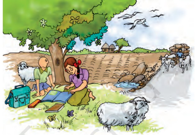
चित्र 6.1 सजीवों के लिए खोज

उन्होंने यह जानने की कोशिश की कि क्या पृथ्वी पर कोई ऐसा भी स्थान है, जहाँ कोई भी जीव नहीं पाया जाता। बूझो ने अपने घर के आस-पास के स्थानों का ध्यान किया। घर के अंदर उसने अलमारी एवं दरवाज़ों को देखा। उसने सोचा था कि इनमें कोई सजीव नहीं होगा, परंतु उसे एक छोटी-सी मकड़ी नज़र आई। घर से बाहर भी वह किसी ऐसे स्थान के बारे में नहीं सोच पाया जहाँ किसी न किसी प्रकार के जीव न पाए जाते हों (चित्र 6.1)। पहेली ने दूर-दूर के स्थानों के विषय में पढ़ना एवं सोचना प्रारंभ किया। उसे पता लगा कि लोगों ने तो ज्वालामुखी के मुख (मुहाने) में भी सूक्ष्म जीवों को खोज निकाला है।