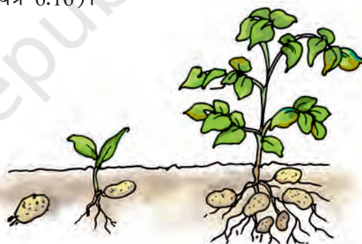
चित्र 6.16 आलू की सुप्त कलिका से उगता एक पौधा

कुछ पौधे बीज के अतिरिक्त अपने कायिक भागों द्वारा भी नए पौधे उत्पन्न करते हैं। उदाहरणतः आलू के कलिका वाले भाग से नया पौधा बनता है (चित्र 6.16)।