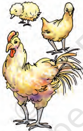
चित्र 6.11 एक चूजा वृद्धि कर वयस्क हो जाता है

क्या हम श्वसन के बिना जीवित रह सकते हैं? जब हम श्वास लेते हैं तो बाहर की वायु शरीर के अंदर