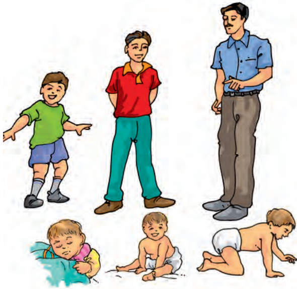
चित्र 6.10 एक शिशु वृद्धि करके वयस्क हो जाता है

का बच्चा) वृद्धि करके मुर्गी अथवा मुर्गा में परिवर्तित हो जाता है (चित्र 6.11)।