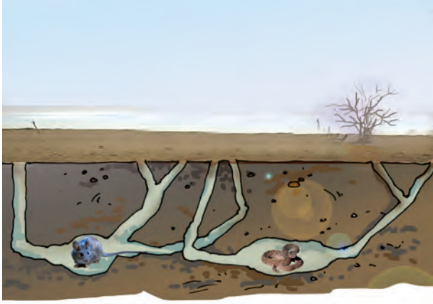
चित्र 6.4 बिल में मरुस्थलीय जंतु

मरुस्थल में रहने वाले चूहे एवं साँप के, ऊँट की भाँति लंबे पैर नहीं होते। दिन की तेज़ गरमी से बचने के लिए वे भूमि के अंदर गहरे बिलों में रहते हैं (चित्र 6.4)। रात्रि के समय जब तापमान में कमी आती है, तो ये जंतु बाहर निकलते हैं।