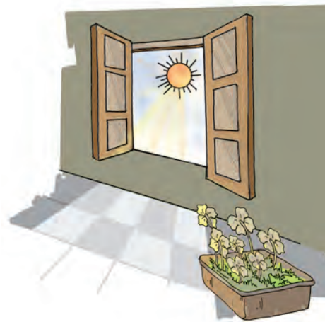
चित्र 6.12 पौधे की सूर्य के प्रकाश के प्रति अनुक्रिया

एक कमरे की खिड़की जिससे दिन के समय धूप (सूर्य का प्रकाश) आती हो, के पास एक पौधे का