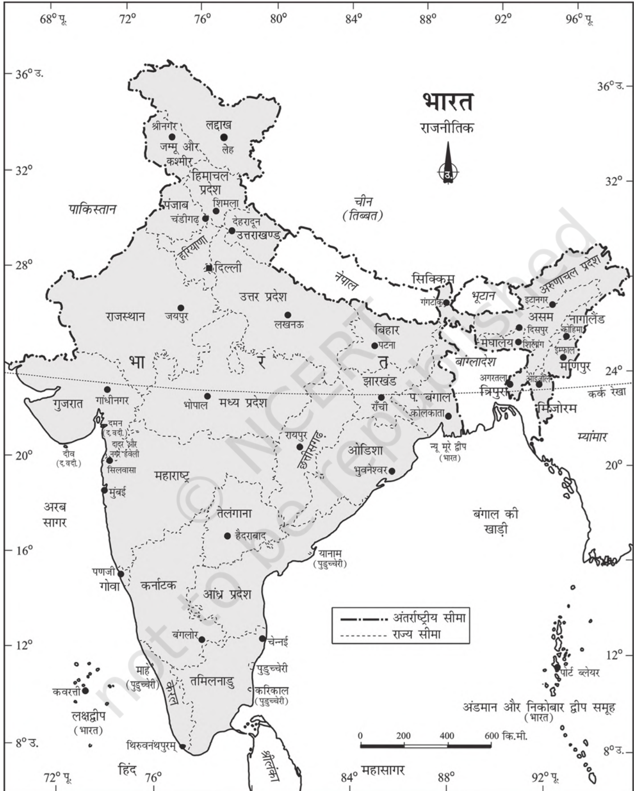
चित्र 1.1 : भारत : राजनीतिक