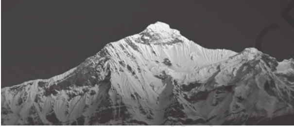
चित्र 2.3 : हिमालय

उत्तरी-पूर्वी पहाड़ियाँ शामिल हैं। हिमालय में कई समानांतर पर्वत श्रृंखलाएँ हैं। इसमें बृहत् हिमालय, पार हिमालय श्रृंखलाएँ, मध्य हिमालय और शिवालिक प्रमुख श्रेणियाँ हैं। भारत के उत्तरी-पश्चिमी भाग में हिमालय की ये श्रेणियाँ उत्तर-पश्चिम दिशा से दक्षिण-पूर्व दिशा की ओर फैली हैं। दार्जिलिंग और सिक्किम क्षेत्रों में ये श्रेणियाँ पूर्व-पश्चिम दिशा में फैली हैं जबकि अरुणाचल प्रदेश में ये दक्षिण-पश्चिम से उत्तर-पश्चिम की ओर घूम जाती हैं। मिजोरम, नागालैंड और मणिपुर में ये पहाड़ियाँ उत्तर-दक्षिण दिशा में फैली हैं। बृहत् हिमालय श्रृंखला, जिसे केंद्रीय अक्षीय श्रेणी भी कहा जाता है, की पूर्व-पश्चिम लंबाई लगभग 2,500 किलोमीटर तथा उत्तर से दक्षिण इसकी चौड़ाई 160 से 400 किलोमीटर है। जैसाकि मानचित्र से स्पष्ट है हिमालय, भारतीय उपमहाद्वीप तथा मध्य एवं पूर्वी एशिया के देशों के बीच एक मजबूत लंबी दीवार के रूप में खड़ा है। क्या आप भारतीय उपमहाद्वीप के देशों के नाम बता सकते हैं?