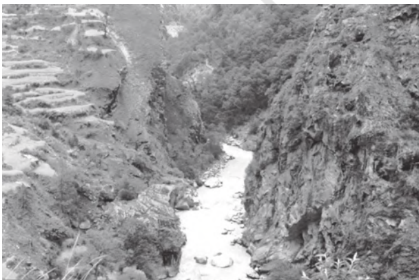
चित्र 2.1 : गॉर्ज

कठोर एवं स्थिर प्रायद्वीपीय खंड के विपरीत हिमालय और अतिरिक्त-प्रायद्वीपीय पर्वतमालाओं की भूवैज्ञानिक संरचना तरुण, दुर्बल और लचीली है। ये पर्वत वर्तमान समय में भी बहिर्जनिक तथा अंतर्जनित बलों की अंतर्क्रियाओं से प्रभावित हैं। इसके परिणामस्वरूप इनमें वलन, भ्रंश और क्षेप (thrust) बनते हैं। इन पर्वतों की उत्पत्ति विवर्तनिक हलचलों से जुड़ी है। तेज बहाव वाली नदियों से अपरदित ये पर्वत अभी भी युवा अवस्था में हैं। गॉर्ज, V-आकार घाटियाँ, क्षिप्रिकाएँ व जल-प्रपात इत्यादि इसका प्रमाण हैं।