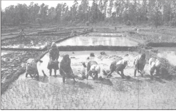
चित्र 2.10 : उत्तरी मैदान

इस मैदान में नदी की प्रौढ़ावस्था में बनने वाली अपरदनी और निक्षेपण स्थलाकृतियाँ, जैसे- बालू-रोधिका, विसर्प, गोखुर झीलें और गुंफित नदियाँ पाई जाती हैं। ब्रह्मपुत्र घाटी का मैदान नदीय द्वीप और बालू-रोधिकाओं की उपस्थिति के लिए जाना जाता है। यहाँ ज़्यादातर क्षेत्र में समय-समय पर बाढ़ आती रहती है और नदियाँ अपना रास्ता बदल कर गुंफित वाहिकाएँ बनाती रहती हैं।