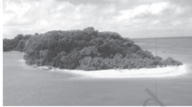
चित्र 2.14 : एक द्वीप

इस द्वीप समूह की मुख्य पर्वत चोटियों में सैडल चोटी (उत्तरी अंडमान - 738 मीटर), माउंट डियोवोली (मध्य अंडमान - 515 मीटर), माउंट कोयोब (दक्षिणी अंडमान - 460 मीटर) और माउंट थुईल्लर (ग्रेट निकोबार - 642 मीटर) शामिल हैं।