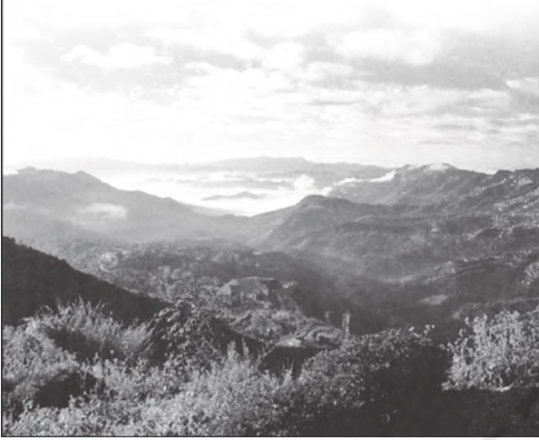
चित्र 2.8 : मिजो पहाड़ियाँ

कृषि भी कहा जाता है। यह क्षेत्र जैव विविधता में धनी है जिसका संरक्षण देशज समुदायों ने किया। ऊबड़-खाबड़ स्थलाकृति के कारण यहाँ पर विभिन्न घाटियों के बीच परिवहन जुड़ाव लगभग नाम मात्र ही है। इसलिए, अरुणाचल-असम सीमा पर स्थित दुआर क्षेत्र से होकर ही यहाँ कारोबार किया जा सकता है।