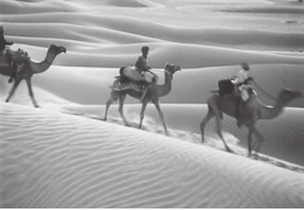
चित्र 2.12 : भारतीय मरुस्थल

क्या आप इस चित्र में दिखाए गए बालू के टिब्बों के प्रकार को पहचान सकते हैं?