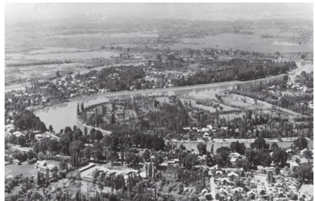
चित्र 2.4 : विसर्पित झेलम

जम्मू और कश्मीर की राजधानी श्रीनगर झेलम नदी