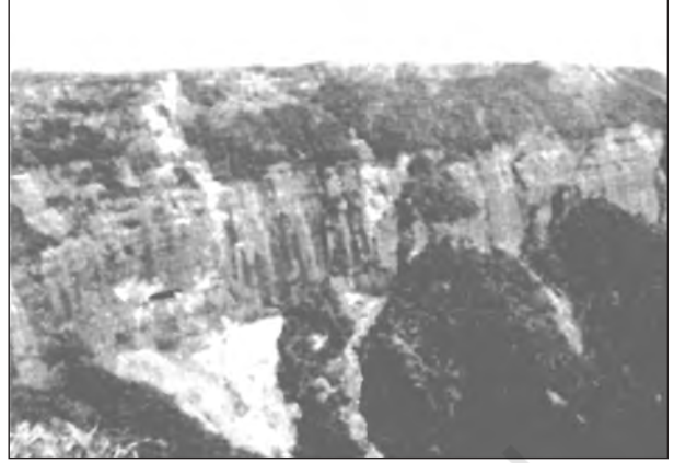
चित्र 2.11 : प्रायद्वीपीय पठार का एक भाग

नदियों के मैदान से 150 मीटर ऊँचाई से ऊपर उठता हुआ प्रायद्वीपीय पठार तिकोने आकार वाला कटा-फटा भूखंड है, जिसकी ऊँचाई 600 से 900 मीटर है। उत्तर पश्चिम में दिल्ली, कटक (अरावली विस्तार), पूर्व में राजमहल पहाड़ियाँ, पश्चिम में गिर पहाड़ियाँ और दक्षिण में इलायची (कार्डामम) पहाड़ियाँ, प्रायद्वीप पठार की सीमाएँ निर्धारित करती हैं। उत्तर-पूर्व में शिलांग तथा