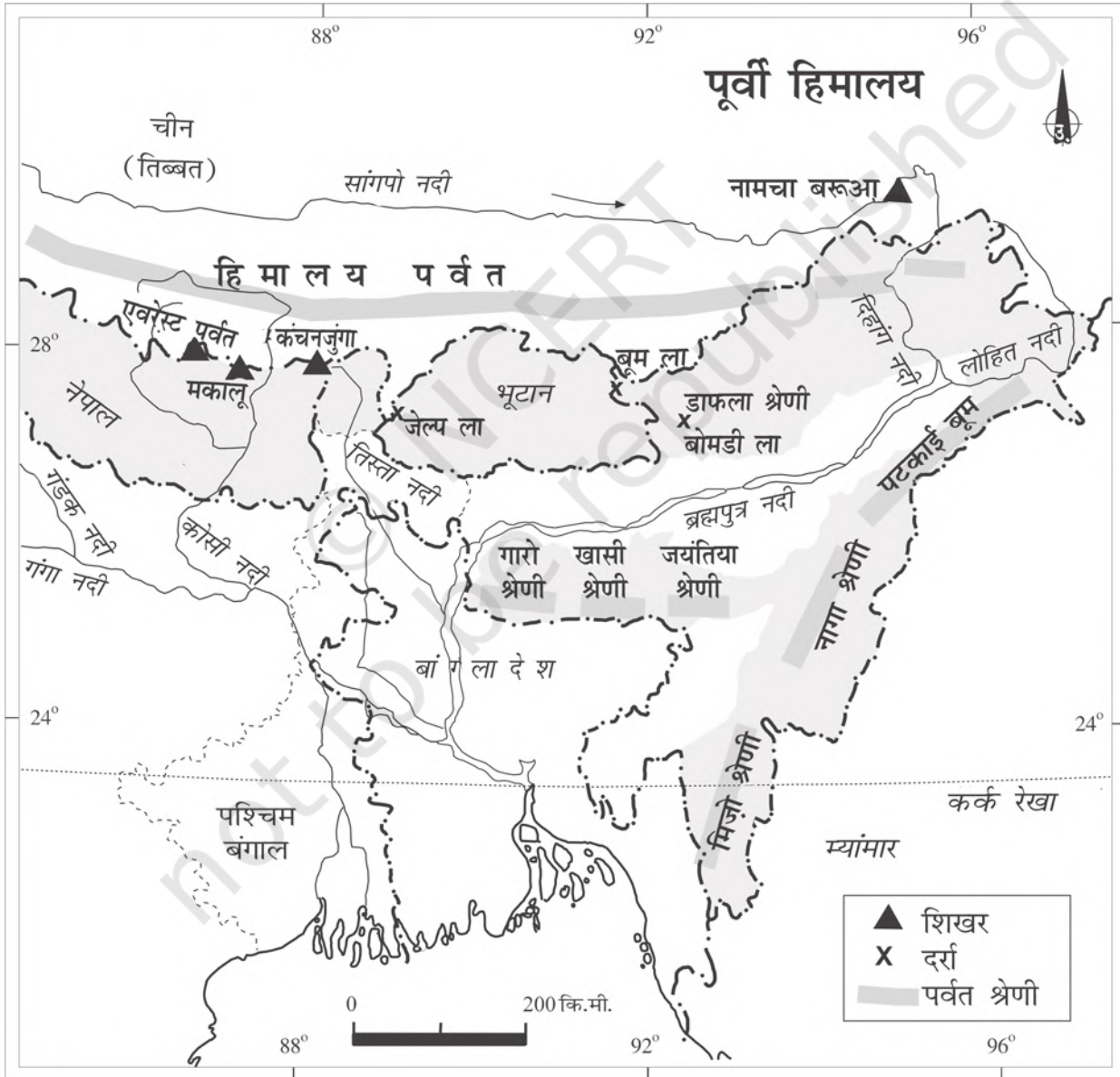
चित्र 2.7 : पूर्वी हिमालय

लोहित यहाँ की प्रमुख नदियाँ हैं। ये बारहमासी नदियाँ हैं और बहुत से जल-प्रपात बनाती हैं। इसलिए, यहाँ जल विद्युत उत्पादन की क्षमता काफी है। अरुणाचल हिमालय की एक मुख्य विशेषता यह है कि यहाँ बहुत-सी जनजातियाँ निवास करती हैं। इस क्षेत्र में पश्चिम से पूर्व में बसी कुछ जनजातियाँ इस प्रकार हैं— मोनपा, अबोर, मिशामी, निशी और नागा। इनमें से ज्यादातर जनजातियाँ झूम (Jhumming) खेती करती हैं, जिसे स्थानांतरी कृषि या स्लैश और बर्न