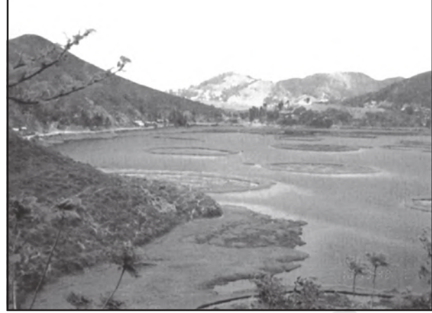
चित्र 2.9 : लोकताक झील

हिमालय पर्वत के इस भाग में पहाड़ियों की दिशा उत्तर से दक्षिण है। ये पहाड़ियाँ विभिन्न स्थानीय नामों से जानी जाती हैं। उत्तर में ये पटकाई बूम, नागा पहाड़ियाँ, मणिपुर पहाड़ियाँ और दक्षिण में मिजो या लुसाई पहाड़ियों के नाम से जानी जाती हैं। यह एक नीची पहाड़ियों का क्षेत्र है जहाँ अनेक जनजातियाँ 'झूम' या स्थानांतरी खेती करती हैं। यहाँ ज्यादातर पहाड़ियाँ, छोटे-बड़े नदी-नालों द्वारा अलग होती हैं। बराक मणिपुर और मिजोरम की एक मुख्य नदी है। मणिपुर घाटी के मध्य एक झील स्थित है जिसे 'लोकताक' झील कहा जाता है और यह चारों ओर से पहाड़ियों से घिरी है। मिजोरम जिसे 'मोलेसिस बेसिन' भी कहा जाता है मृदुल और असंगठित चट्टानों से बना है। नागालैंड में बहने वाली ज्यादातर नदियाँ ब्रह्मपुत्र नदी की सहायक नदियाँ हैं। मिजोरम और मणिपुर की दो नदियाँ बराक नदी की सहायक नदियाँ हैं, जो मेघना नदी की एक सहायक नदी है। मणिपुर के पूर्वी भाग में बहने वाली नदियाँ चिंदविन नदी की सहायक