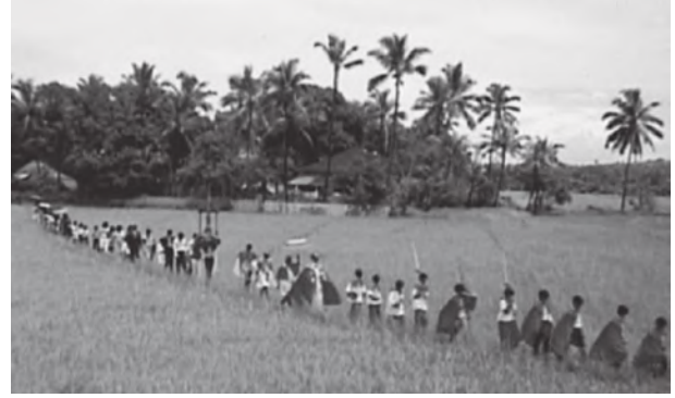
चित्र 2.13 : तटीय मैदान

आप पहले ही पढ़ चुके हैं कि भारत की तट रेखा बहुत लंबी है। स्थिति और सक्रिय भूआकृतिक प्रक्रियाओं के आधार पर तटीय मैदानों को दो भागों में बाँटा जा सकता है; (i) पश्चिमी तटीय मैदान (ii) पूर्वी तटीय मैदान।