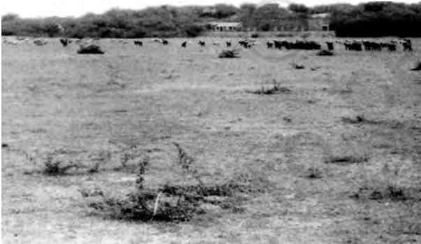
चित्र 6.4 : शुष्क मृदा

शुष्क मृदाओं का रंग लाल से लेकर किशमिशी तक होता है। ये सामान्यतः संरचना से बलुई और प्रकृति से लवणीय होती हैं। कुछ क्षेत्रों की मृदाओं में नमक की मात्रा इतनी अधिक होती है कि इनके पानी को वाष्पीकृत करके नमक प्राप्त किया जाता है। शुष्क जलवायु, उच्च