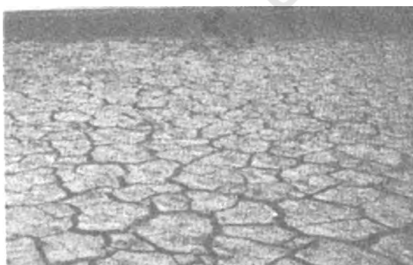
चित्र 6.3 : शुष्क ऋतु में काली मिट्टी

काली मृदाएँ दक्कन के पठार के अधिकतर भाग पर पाई जाती हैं। इसमें महाराष्ट्र के कुछ भाग, गुजरात, आंध्र प्रदेश तथा तमिलनाडु के कुछ भाग शामिल हैं। गोदावरी और कृष्णा नदियों के ऊपरी भागों और दक्कन के पठार के उत्तरी-पश्चिमी भाग में गहरी काली मृदा पाई जाती है। इन मृदाओं को 'रेगर' तथा 'कपास वाली काली मिट्टी' भी कहा जाता है। आमतौर पर काली मृदाएँ मृण्मय, गहरी और अपारगम्य होती हैं। ये मृदाएँ गीले होने पर फूल जाती हैं और चिपचिपी हो जाती हैं। सूखने पर ये सिकुड़ जाती हैं। इस प्रकार शुष्क ऋतु में इन मृदाओं में चौड़ी दरारें पड़ जाती हैं। इस समय ऐसा प्रतीत होता है कि जैसे इनमें 'स्वतः जुताई' हो गई हो। नमी के धीमे अवशोषण और नमी के क्षय की इस विशेषता के कारण काली मृदा में एक लम्बी अवधि तक नमी बनी रहती है।