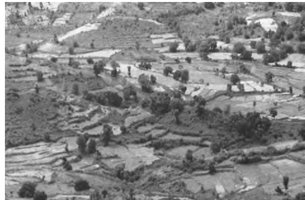
चित्र 6.6 : सीढ़ीदार कृषि

मृदा अपरदन मूल रूप से दोषपूर्ण पद्धतियों द्वारा बढ़ता है। किसी भी तर्कसंगत समाधान के अंतर्गत पहला काम ढालों की कृषि योग्य खुली भूमि पर खेती को रोकना है। 15 से 25 प्रतिशत ढाल प्रवणता वाली भूमि का उपयोग कृषि के लिए नहीं होना चाहिए। यदि ऐसी भूमि पर खेती करना जरूरी भी हो जाए तो इस पर सावधानी से सीढ़ीदार खेत बना लेने चाहिए। भारत के विभिन्न भागों में, अति चराई और स्थानांतरी कृषि ने भूमि के प्राकृतिक आवरण को दुष्प्रभावित किया है, जिससे विस्तृत क्षेत्र अपरदन की चपेट में आ गए हैं। ग्रामवासियों को इनके दुष्परिणामों से अवगत करवा कर इन्हें