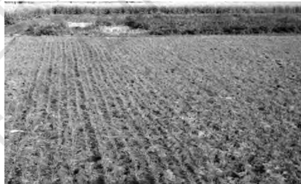
चित्र 6.1 : जलोढ़ मृदा

जलोढ़ मृदाएँ उत्तरी मैदान और नदी घाटियों के विस्तृत भागों में पाई जाती हैं। ये मृदाएँ देश के कुल क्षेत्रफल के