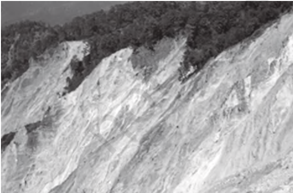
चित्र 6.3 : भारत-नेपाल सीमा, उत्तर प्रदेश में शारदा नदी के निकट शिवालिक हिमालय शृंखलाओं में भूस्खलन स्कार

ढाल, जिसपर संचलन होता है, के संदर्भ में पश्च-आवर्तन (Rotation) के साथ शैल-मलवा की एक या कई इकाइयों के फिसलन (Slipping) को अवसर्पण कहते हैं। पृथ्वी के पिंड के पश्च-आवर्तन के बिना मलवा का तीव्र लोटन (Rolling) या स्खलन मलवा स्खलन कहलाता है। मलवा स्खलन में खड़े (Vertical) या प्रलंबी फलक (Face) से मिट्टी मलवा का प्रायः स्वतंत्र पतन होता है। संस्तर जोड़ या भ्रंश के नीचे पृथक शैल बृहत् के स्खलन को शैल