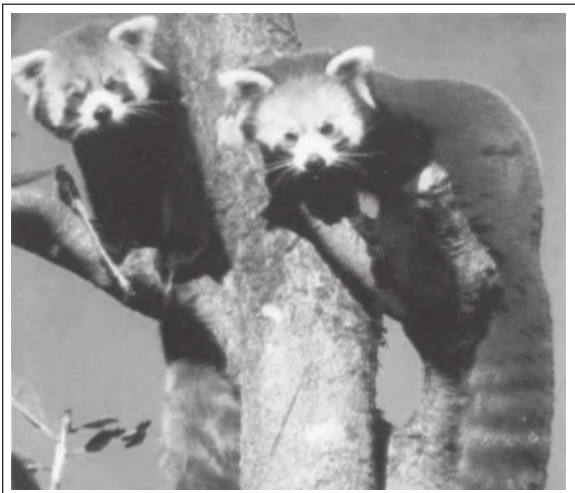
रेड पांडा - एक संकटापन्न प्रजाति