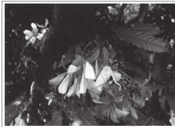
हमबोशिया डेकरेंस बेड- दक्षिण पश्चिमी घाट ( भारत ) की एक दुर्लभ प्रजाति

विश्व की सभी संकटापन्न प्रजातियों के बारे में (Red list) रेड लिस्ट के नाम से सूचना प्रकाशित करता है।