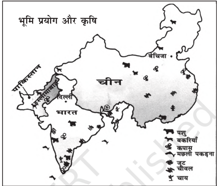
चित्र 10.2 भारत, चीन तथा पाकिस्तान में भूमि-प्रयोग तथा कृषि (स्केल के अनुसार नहीं)

चीन में प्रजनन दर भी बहुत कम है और पाकिस्तान में बहुत अधिक। चीन में नगरीकरण अधिक है। भारत में नगरीय क्षेत्रों में 34 प्रतिशत लोग रहते हैं।