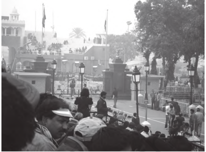
चित्र 10.1 बाघा बॉर्डर केवल पर्यटन स्थल ही नहीं बल्कि भारत तथा पाकिस्तान के

कि स्वामित्व के लिए)। वे प्रकल्पित कर देने के बाद भूमि से होने वाली समस्त आय को अपने पास रख सकते थे। बाद के चरण में औद्योगिक क्षेत्र में सुधार आरंभ किये गये। सामान्य, नगरीय तथा ग्रामीण उद्यमों की निजी क्षेत्रक की उन फर्मों को वस्तुएँ उत्पादित करने की अनुमति थी, जो स्थानीय लोगों के स्वामित्व और संचालन के अधीन थे। इस अवस्था में उद्यमों को जिन पर सरकार का स्वामित्व था, (जिन्हें राज्य के उद्यम एस.ओ.ई. के